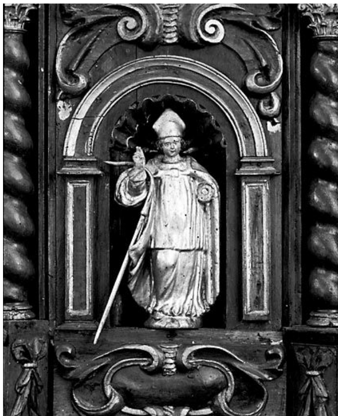
Evêque (autel-retable sud).