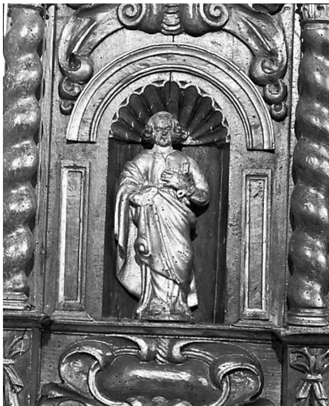
Saint Pierre (autel-retable nord). 25, Bugny