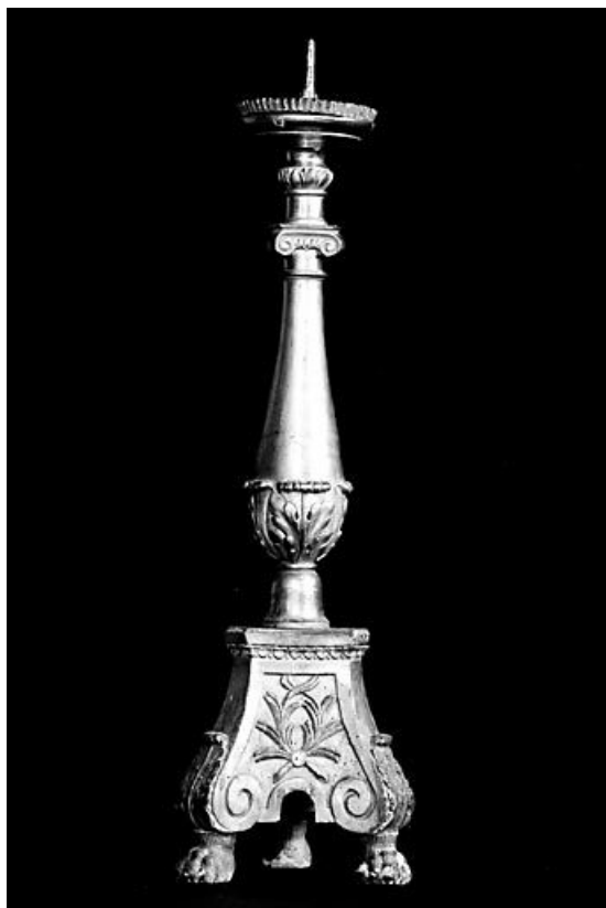
Vue de la face avec branche de feuillage.