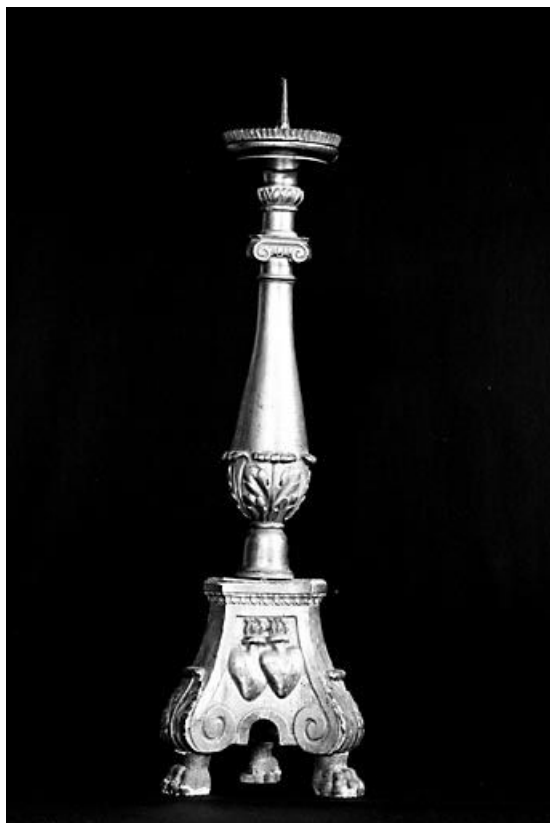
Vue de la face avec deux coeurs.