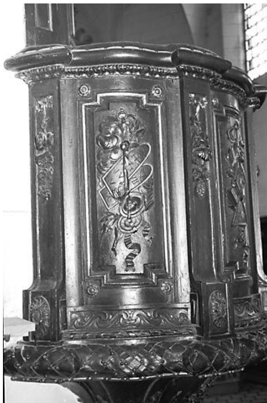
Premier panneau de la cuve.