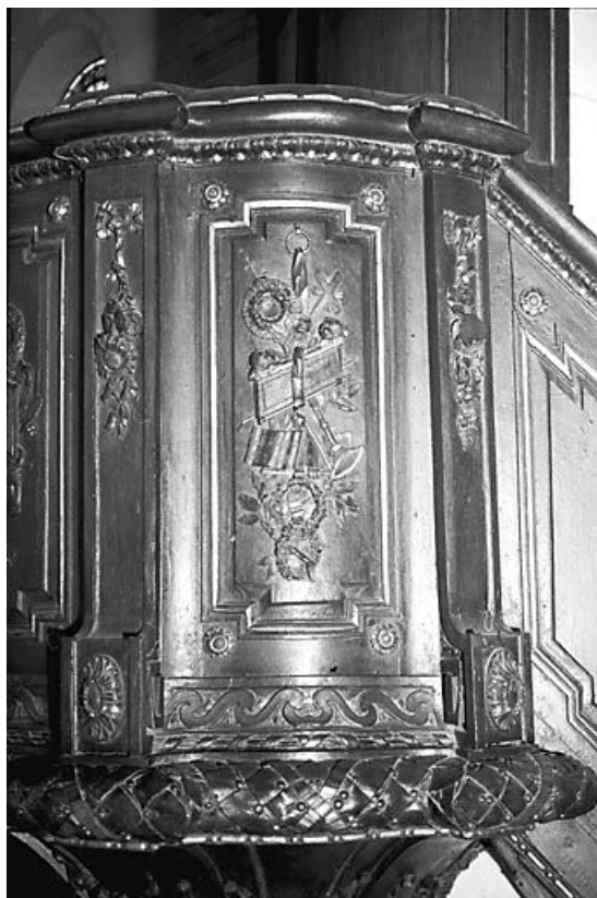
Quatrième panneau de la cuve.