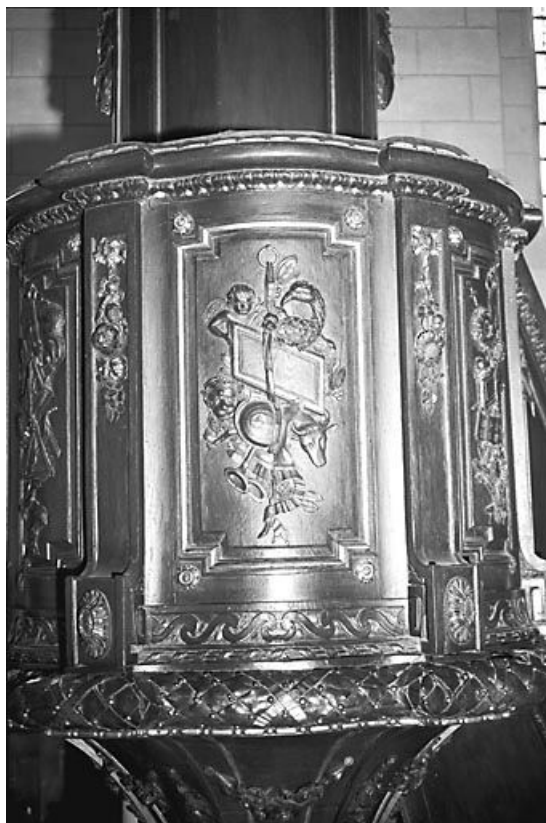
Troisième panneau de la cuve.