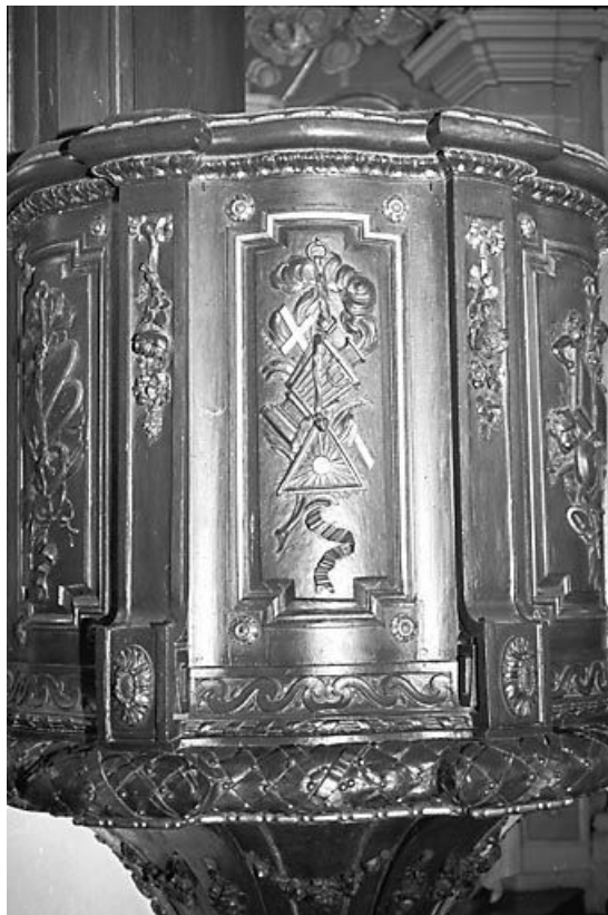
Deuxième panneau de la cuve.