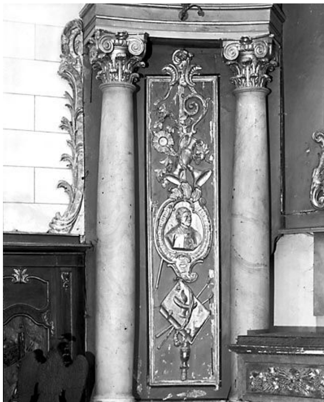
Retable du maître-autel : aile droite avec médaillon et instruments liturgiques. 25, Arc-sous-Cicon