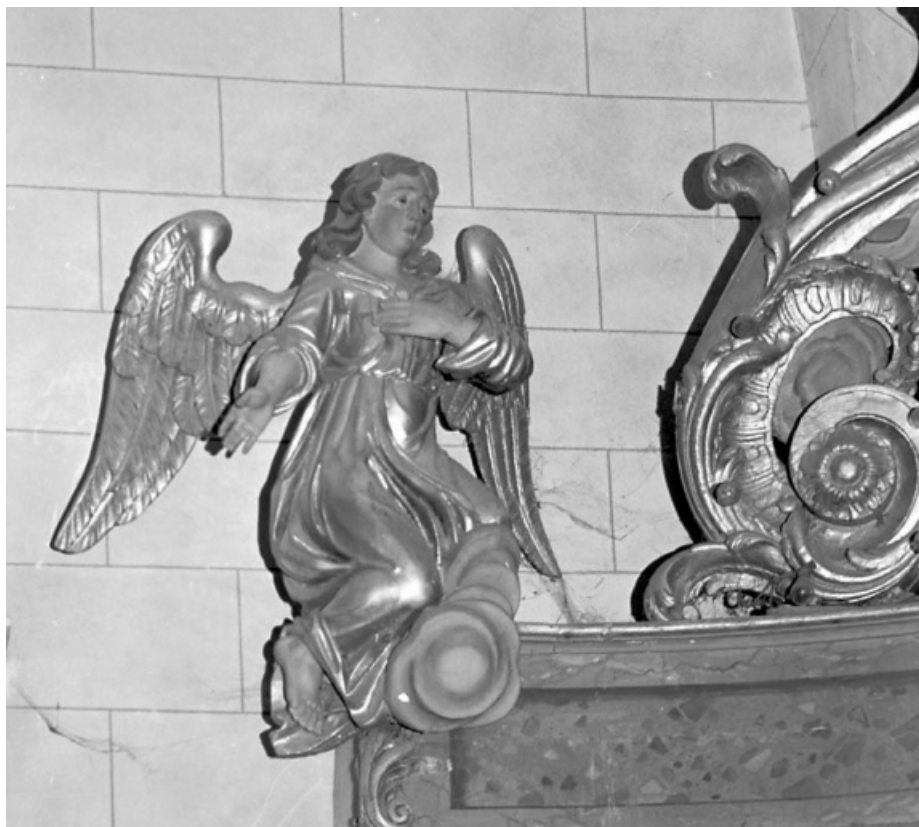
Retable du maître-autel : anges en pendant, ange gauche. 25, Arc-sous-Cicon