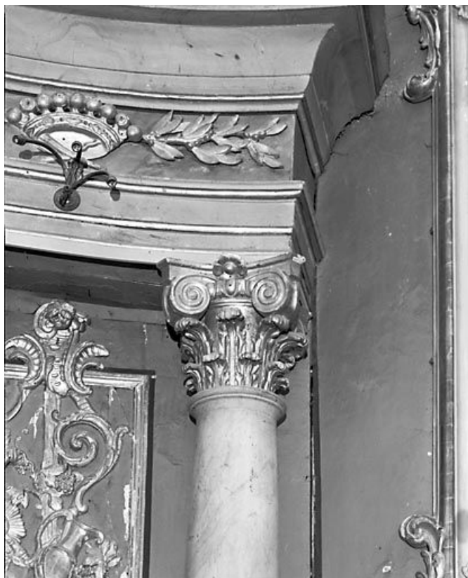
Retable du maître-autel : chapiteau et entablement. 25, Arc-sous-Cicon