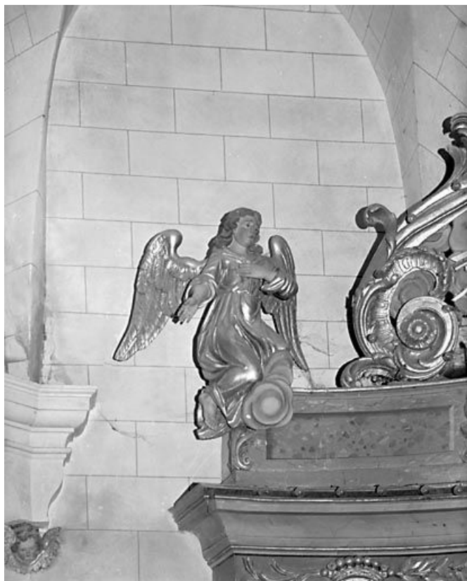
Retable du maître-autel : anges en pendant, ange gauche. 25, Arc-sous-Cicon