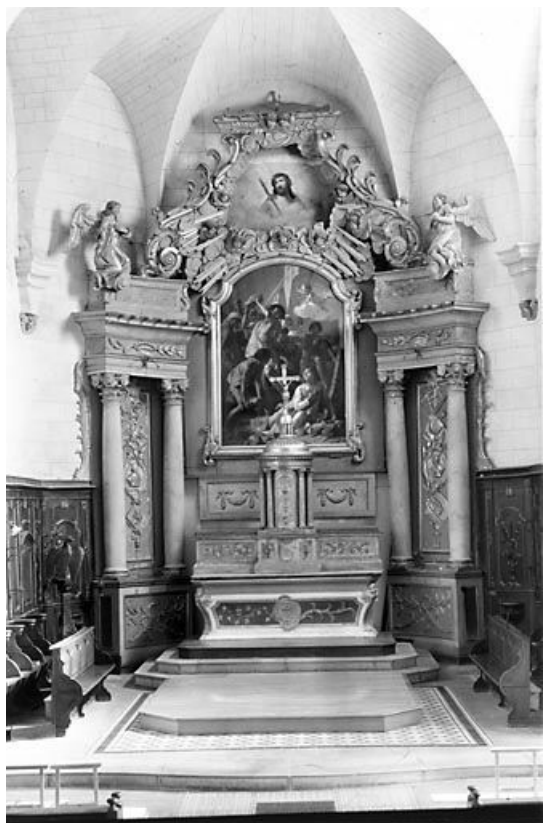
Vue d'ensemble. 25, Arc-sous-Cicon