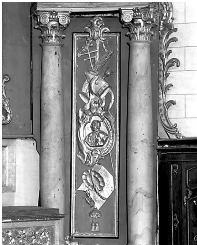
Retable du maître-autel : aile droite avec médaillon et instruments liturgiques. 25, Arc-sous-Cicon