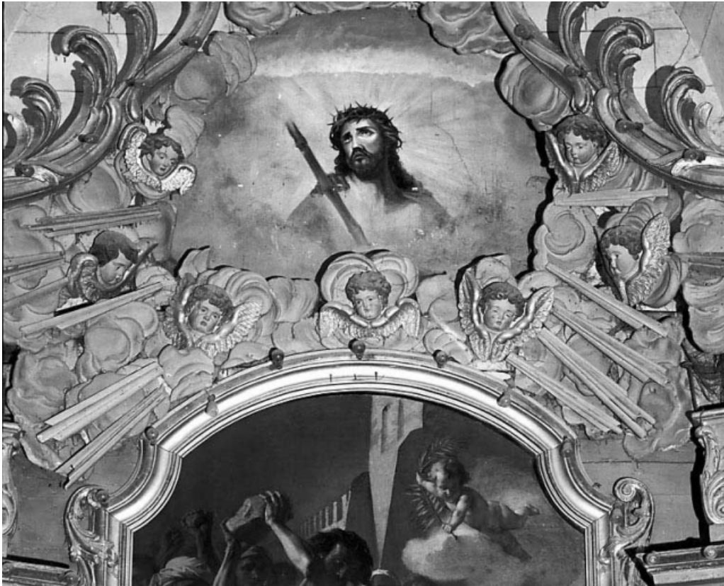
Retable du maître-autel : détail du couronnement. 25, Arc-sous-Cicon