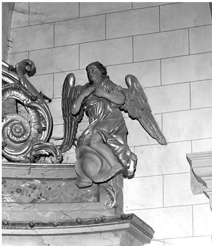
Retable du maître-autel : anges en pendant, ange droit. 25, Arc-sous-Cicon