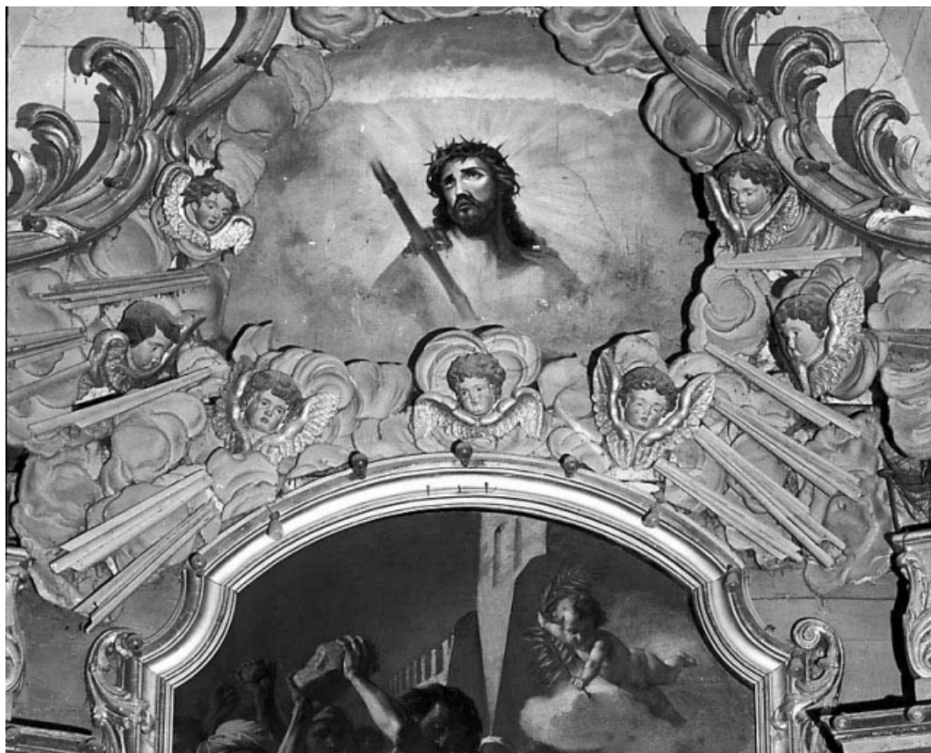
Retable du maître-autel : détail du couronnement. 25, Arc-sous-Cicon