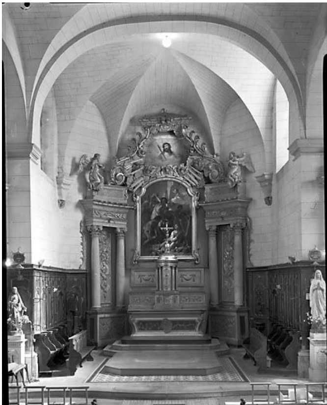
Vue d'ensemble. 25, Arc-sous-Cicon