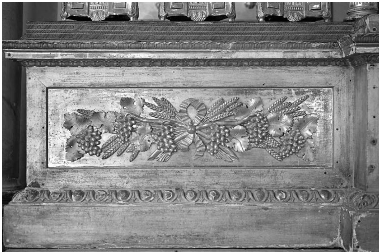
Détail : décor d'un gradin.