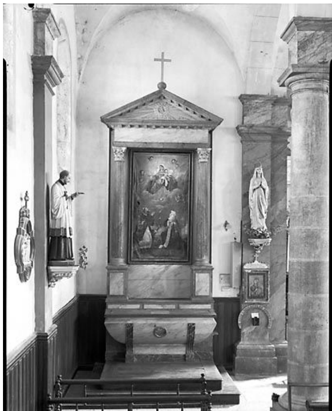
Vue générale de l'autel-retable nord. 25, Arçon