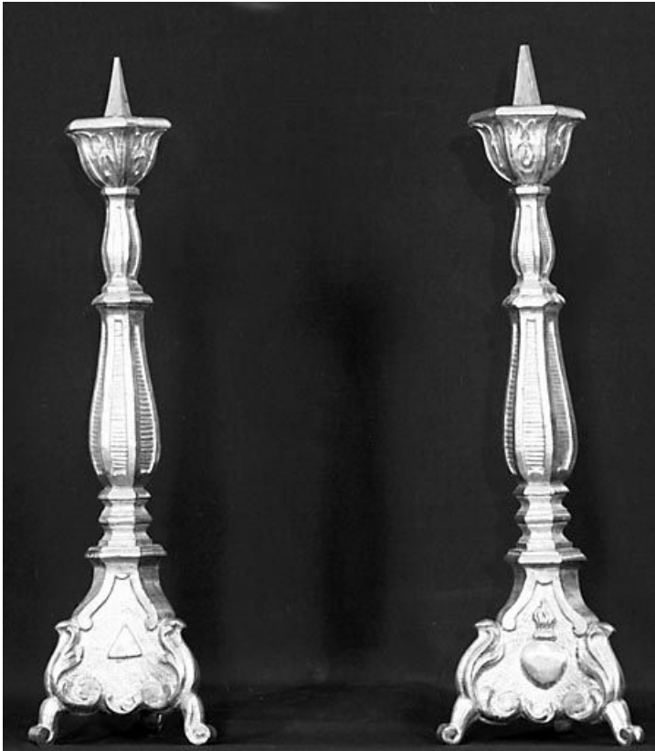
Vue générale de 2 chandeliers.