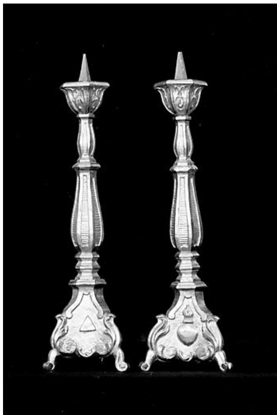
Vue générale de 2 chandeliers.