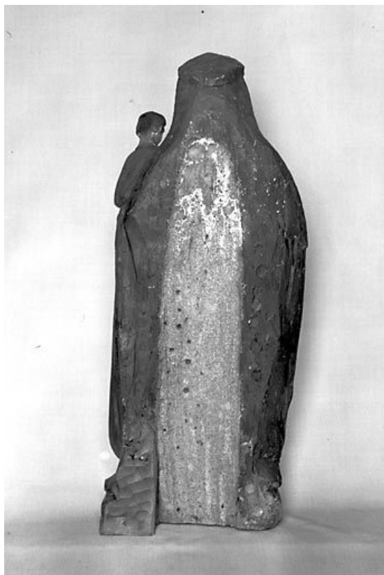
Vue du revers.