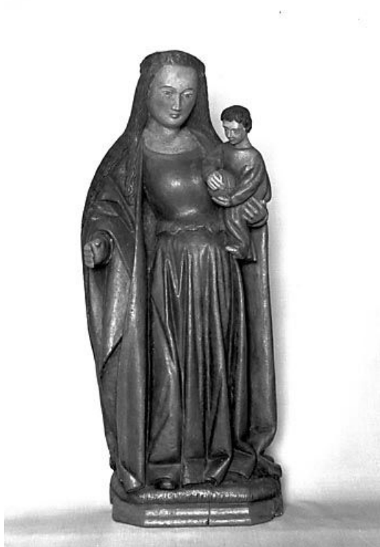
Vue générale de face.