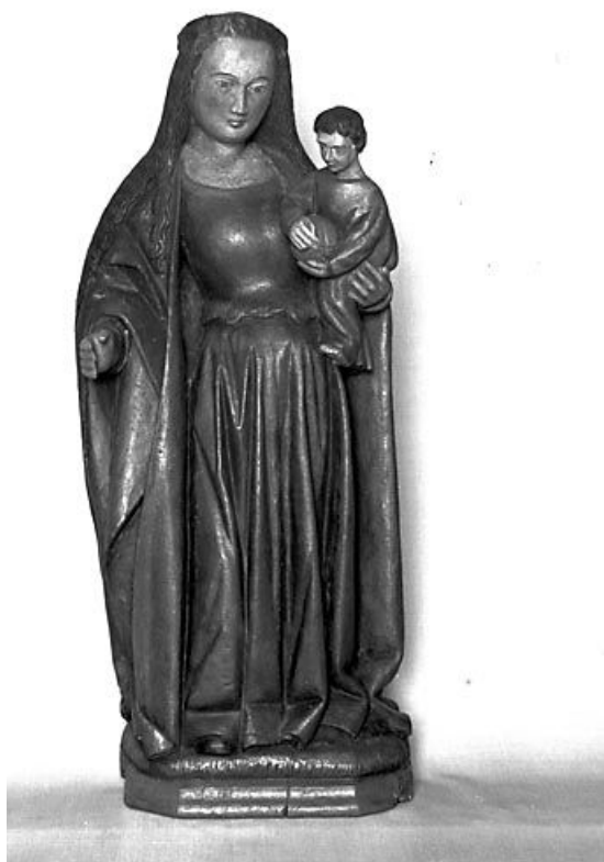
Vue générale de face.