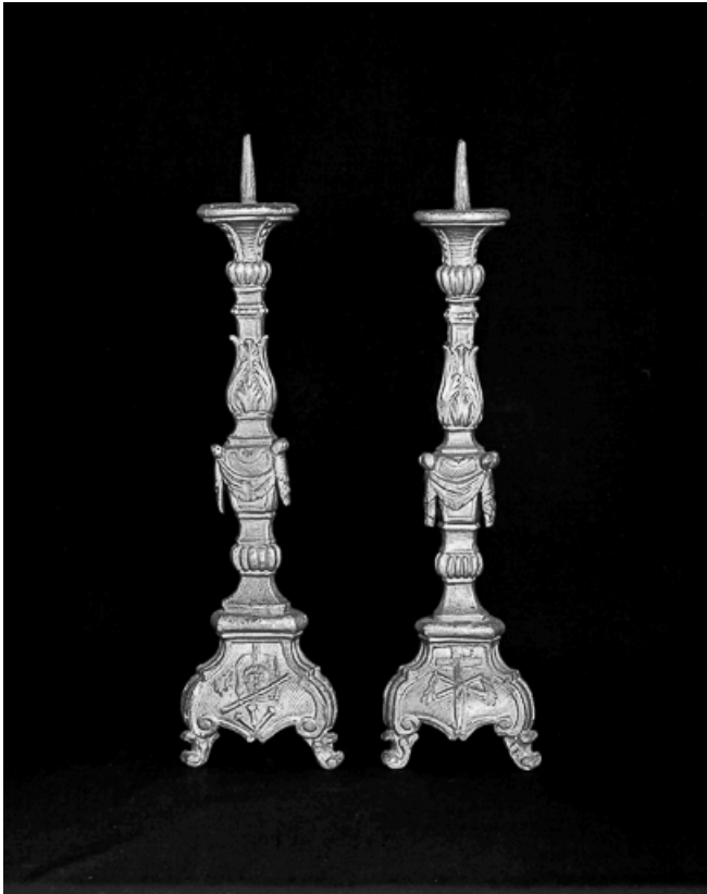
Vue de deux chandeliers.

25, Villers-le-Lac, lieudit : le Chauffaud