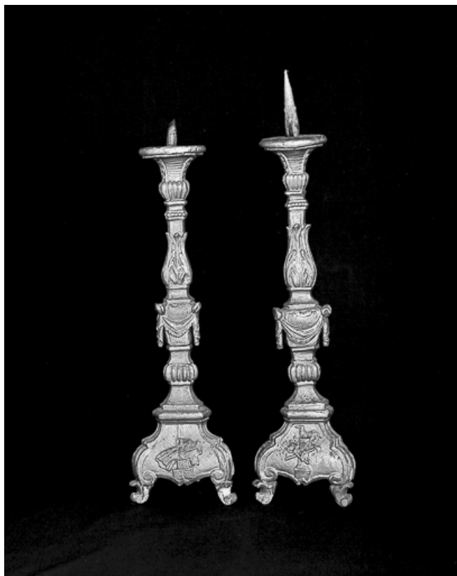
Vue de deux chandeliers.

25, Villers-le-Lac, lieudit : le Chauffaud