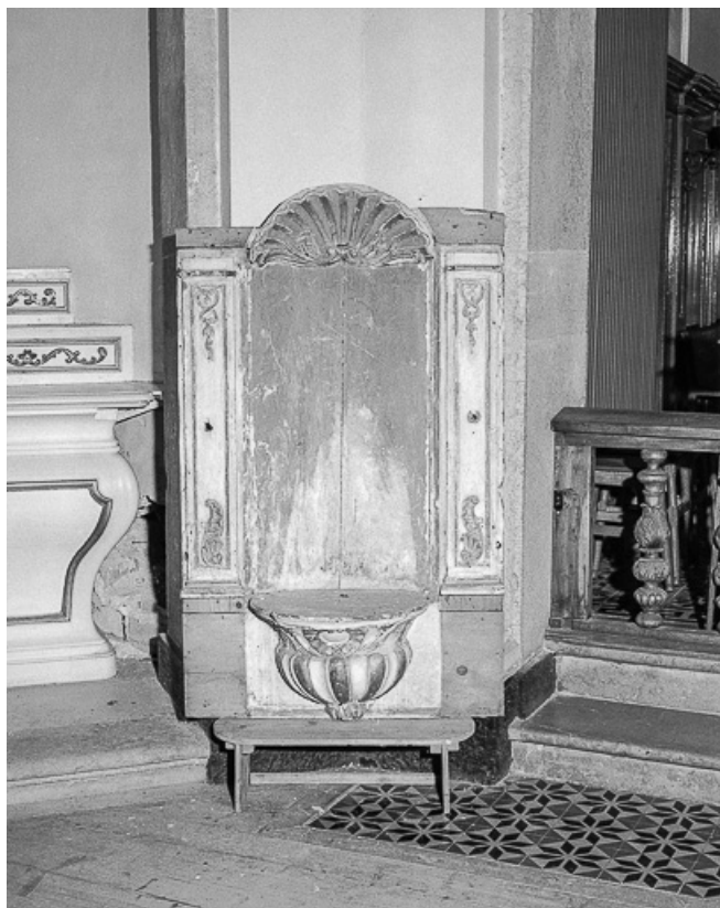
Fragment de retable sans la statue.

25, Villers-le-Lac, lieudit : le Chauffaud