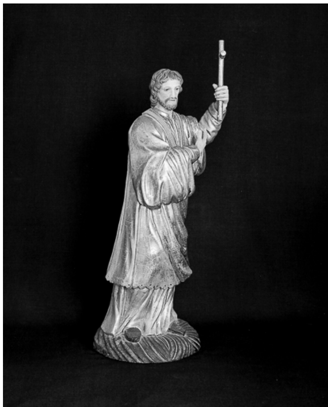
Vue de trois quarts avant droit.

25, Villers-le-Lac, lieudit : le Chauffaud