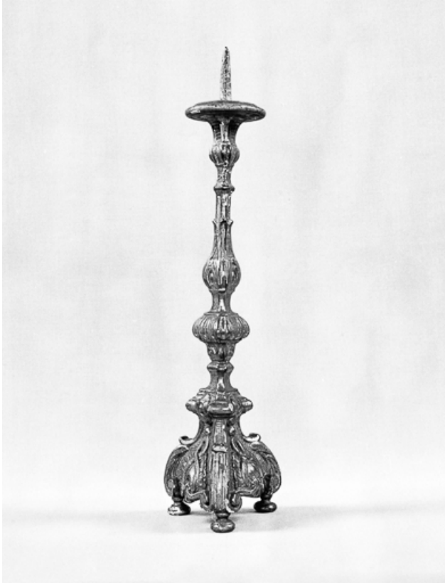
Chandelier : vue de profil.

25, Villers-le-Lac, lieudit : les Bassots