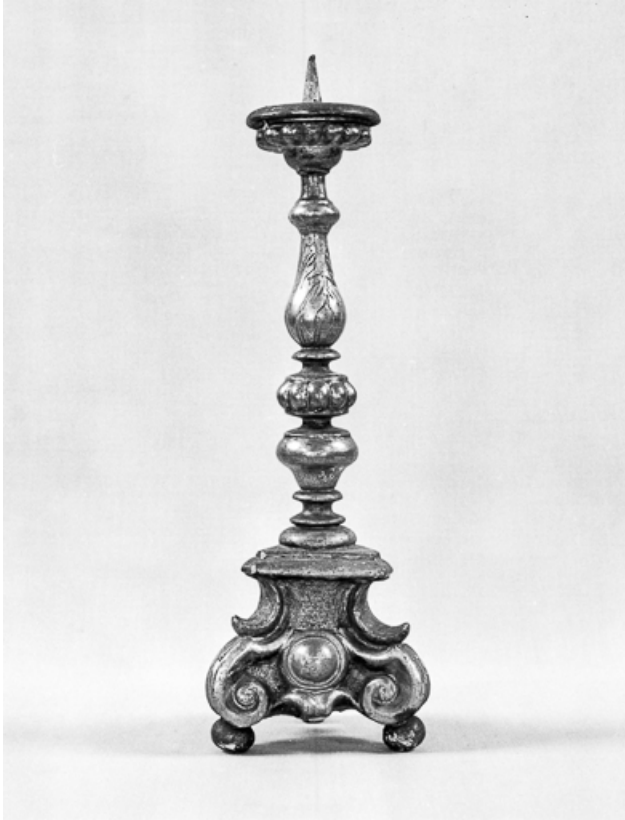
Chandelier : vue de face.

25, Villers-le-Lac, lieudit : les Bassots