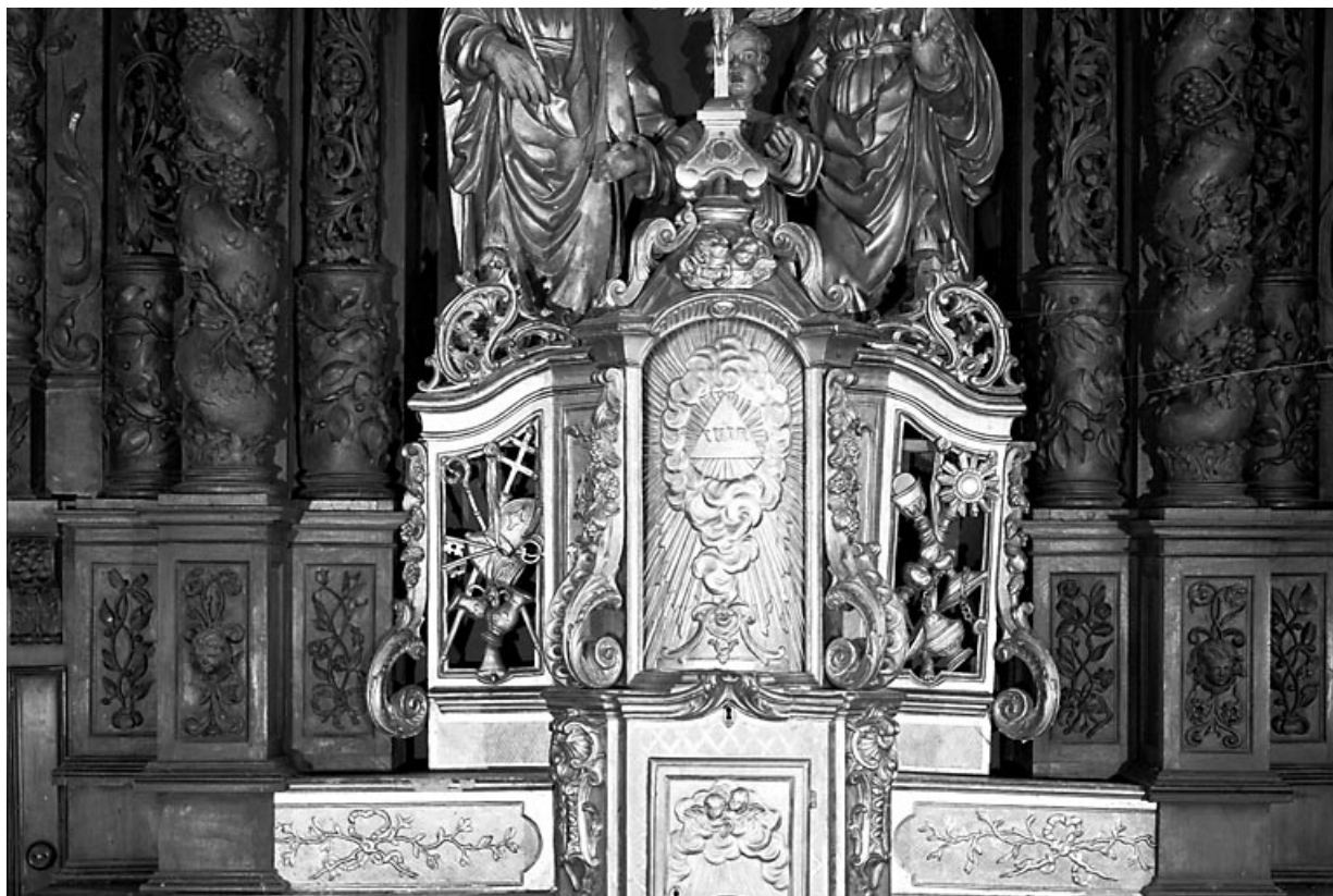
Détail : le tabernacle fermé

25, Villers-le-Lac, lieudit : les Bassots