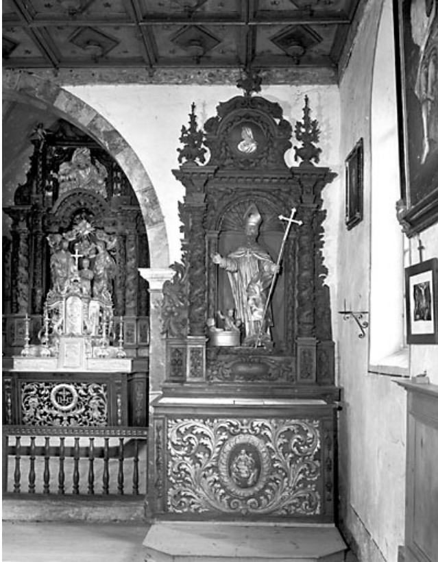
Vue de l'autel latéral droit.

25, Villers-le-Lac, lieudit : les Bassots