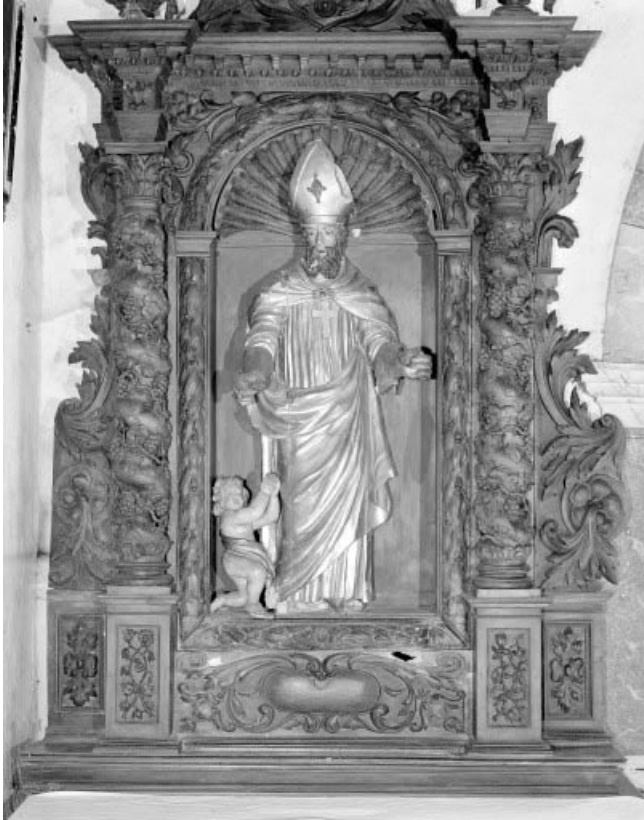
Saint Claude vu de face.

25, Villers-le-Lac, lieudit : les Bassots