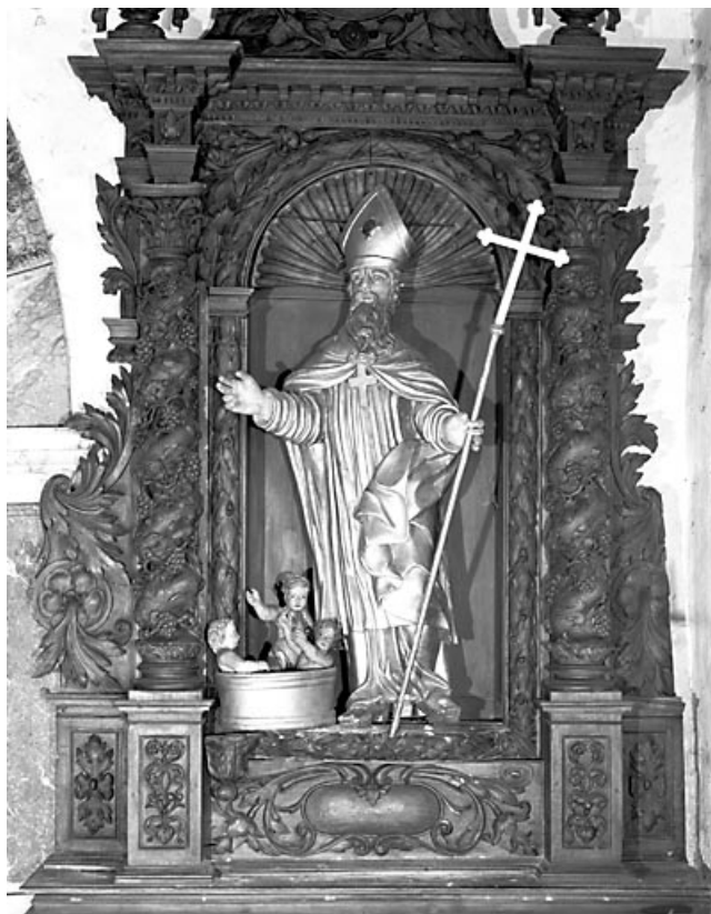
Saint Nicolas vu de face.

25, Villers-le-Lac, lieudit : les Bassots