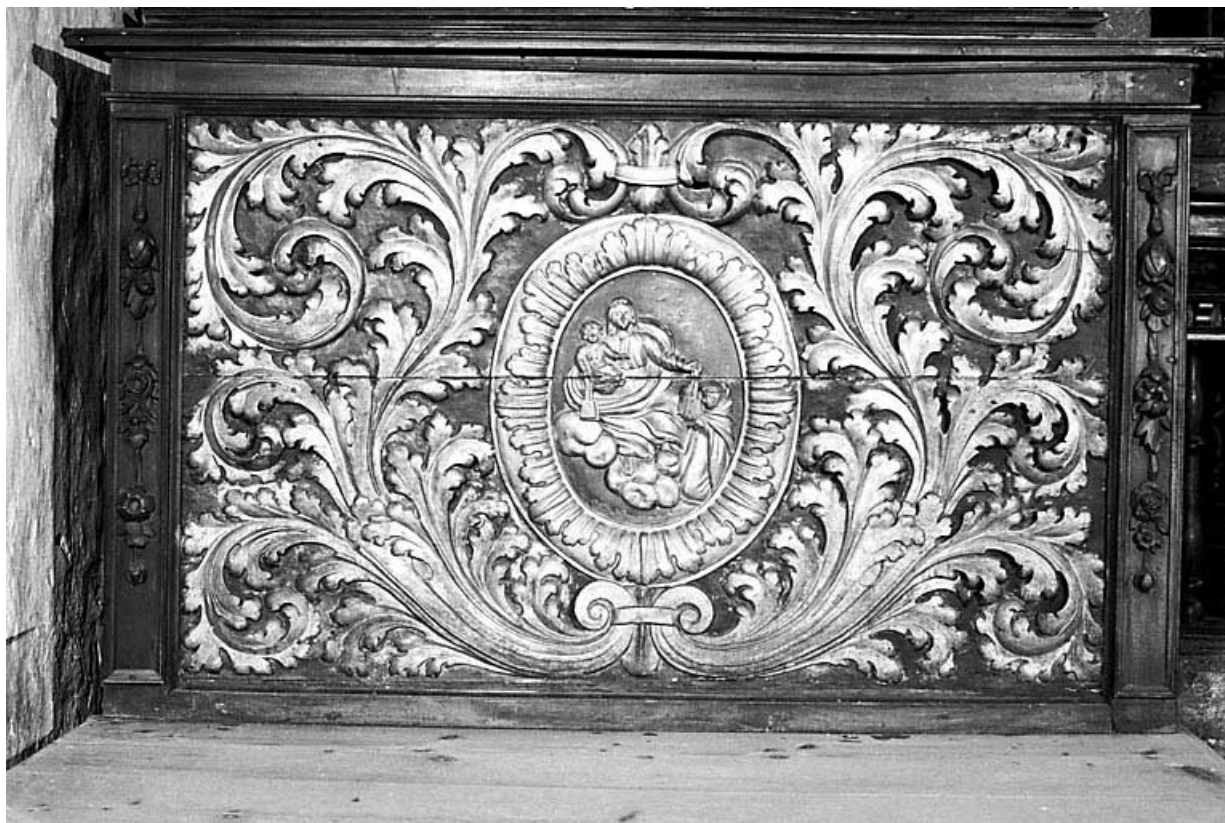
Vue du retable latéral gauche.

25, Villers-le-Lac, lieudit : les Bassots