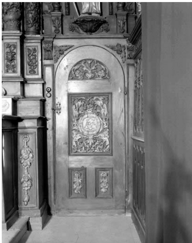
Détail : colonnes du retable.

25, Villers-le-Lac, lieudit : les Bassots