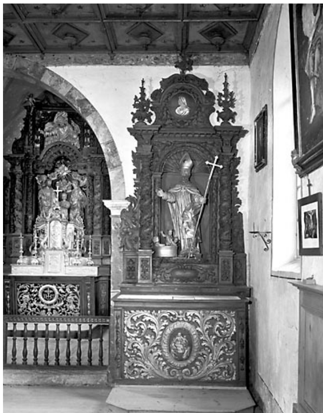
Vue de l'autel latéral droit.

25, Villers-le-Lac, lieudit : les Bassots