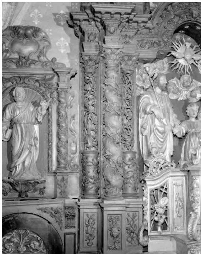
Détail : colonnes du retable.

25, Villers-le-Lac, lieudit : les Bassots