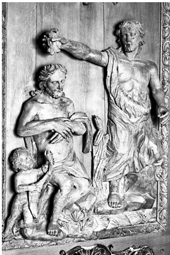
Vue du relief du Baptême du Christ. 25, Villers-le-Lac