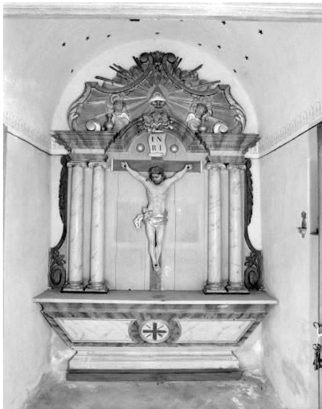
Vue générale du maître-autel.