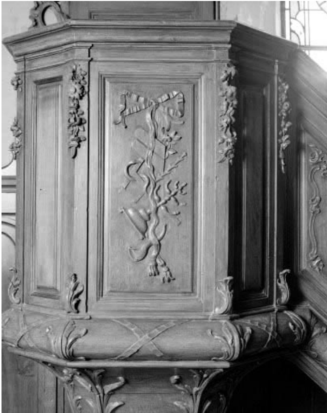
Détail : un panneau de la cuve avec représentation de l'Ancien Testament. 25, Montlebon, lieudit : les Fontenottes