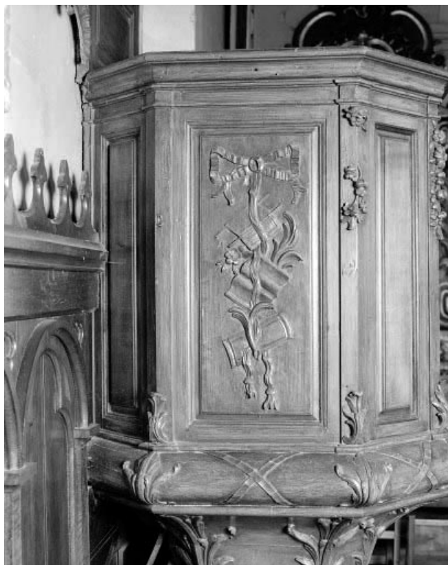
Détail : un panneau de la cuve avec représentation du Nouveau Testament. 25, Montlebon, lieudit : les Fontenottes