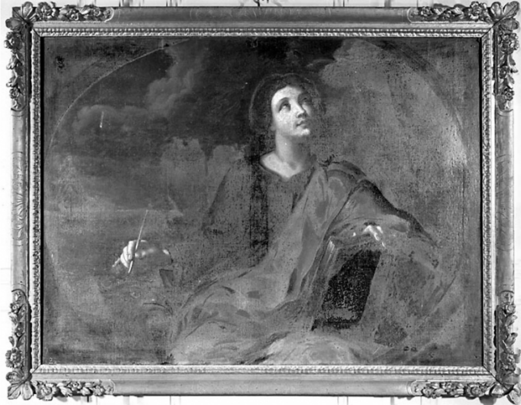
Saint Jean l'Evangéliste.

25, Montlebon, lieudit : Derrière le Mont