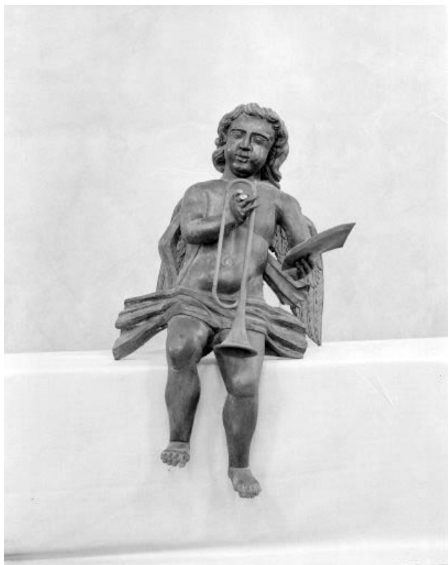
Détail : ange jouant de la trompette, vue de face.