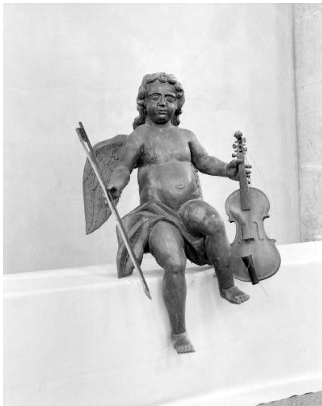
Détail : ange jouant du violon, vue de trois quarts.