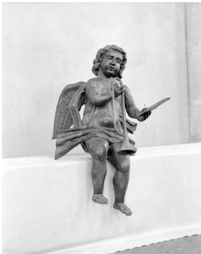
Détail : ange jouant de la trompette, vue de trois quarts.