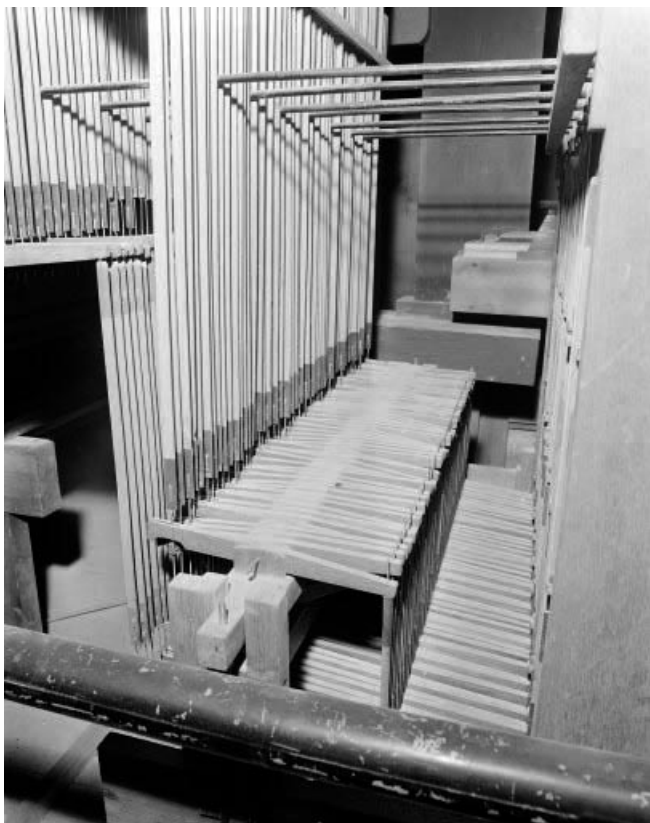
Mécanique, vergettes et balanciers vus de trois quarts droit.