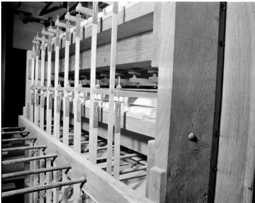
Mécanique, machine Barker vue de trois quarts gauche.