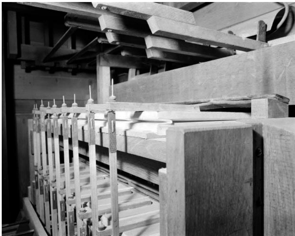
Mécanique, machine Barker, vue de trois quarts gauche.