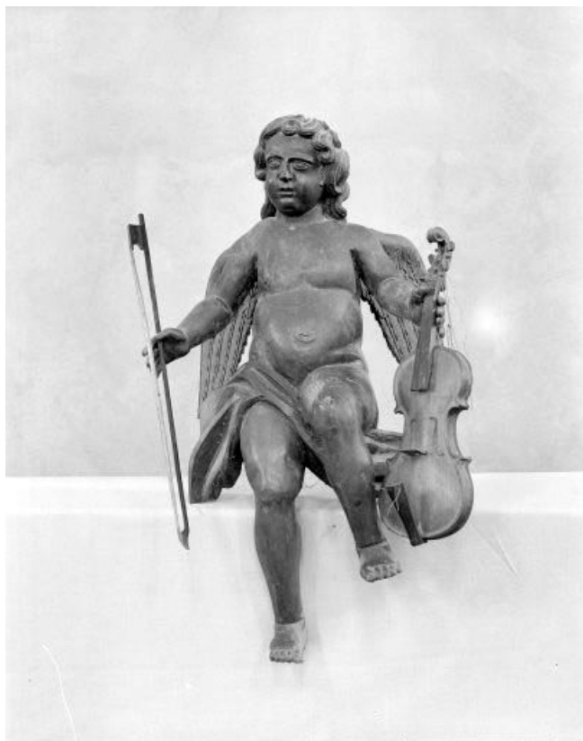
Détail : ange jouant du violon, vue de face.