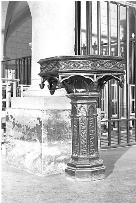
Vue d'un bénitier en fonte.