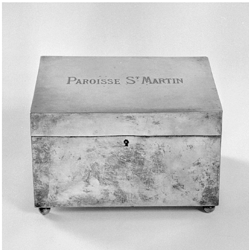
Vue d'ensemble, face antérieure.