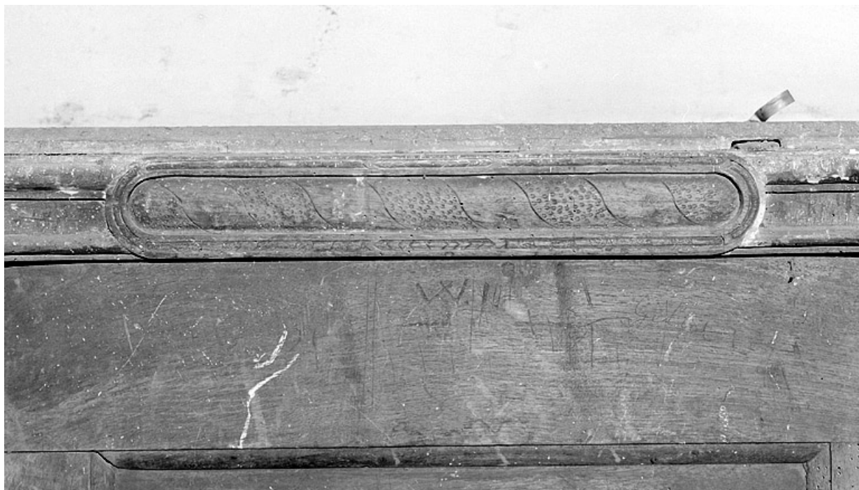
Rangée de droite, détail de l'appui d'un dossier.