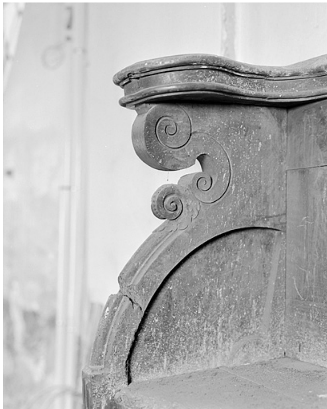
Rangée de droite, détail de la partie supérieure d'une autre parclose. 25, Montbéliard place Saint-Martin