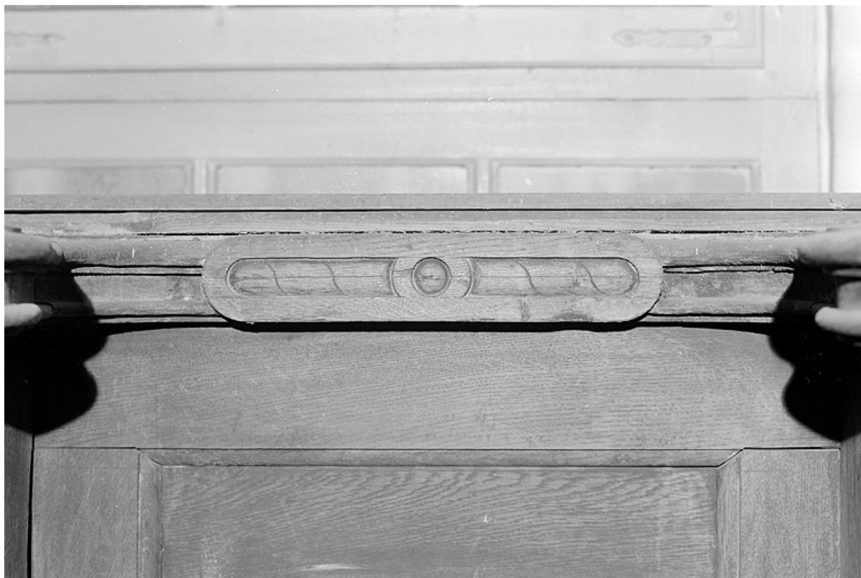
Rangée de gauche, détail de l'appui d'un dossier. 25, Montbéliard place Saint-Martin