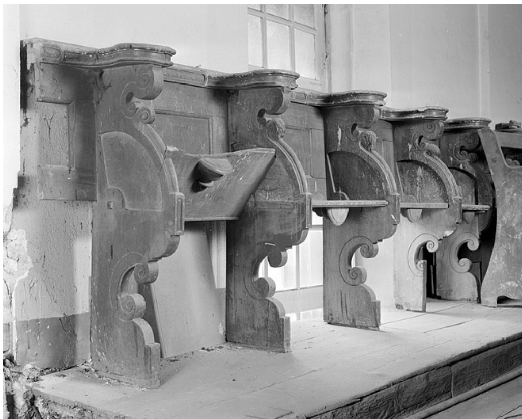
Vue d'ensemble de la rangée de droite. 25, Montbéliard place Saint-Martin