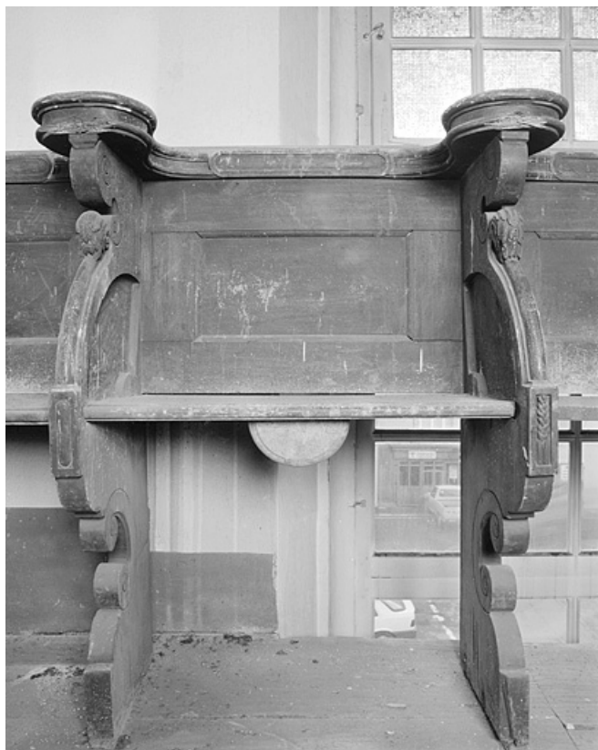
Rangée de droite, détail d'une stalle. 25, Montbéliard place Saint-Martin