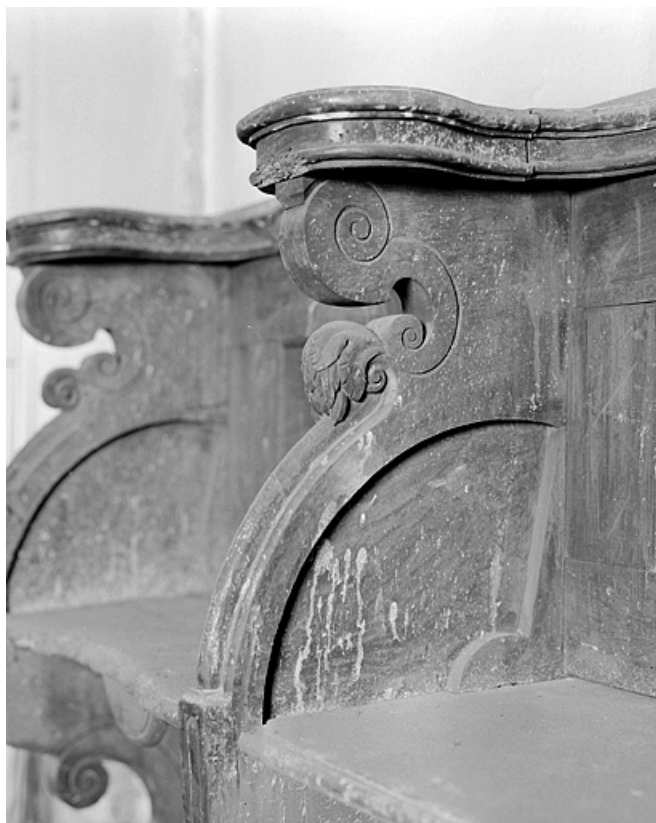
Rangée de droite, détail de la partie supérieure d'une parclose. 25, Montbéliard place Saint-Martin