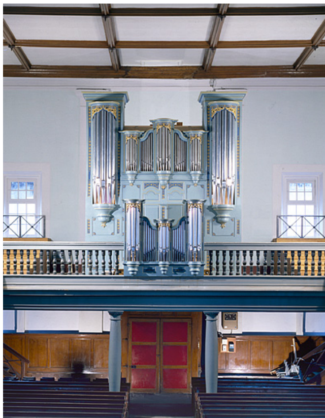
Vue d'ensemble, face, après restauration.