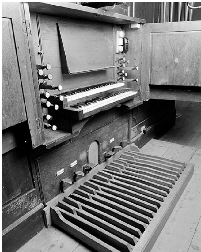
Console sur le soubassement du grand orgue. 25, Montbéliard place Saint-Martin