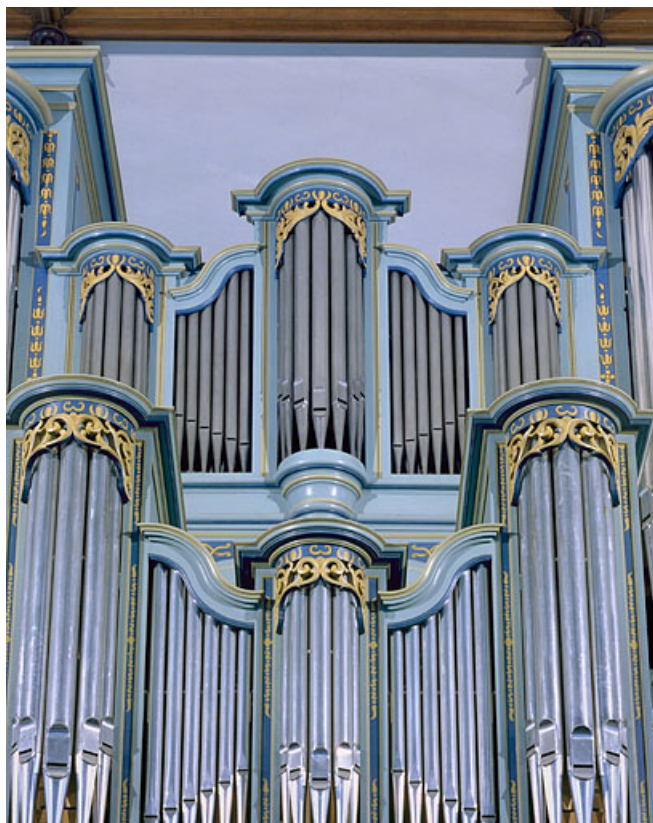
Façade du grand orgue, détail de la partie centrale, après restauration. 25, Montbéliard place Saint-Martin