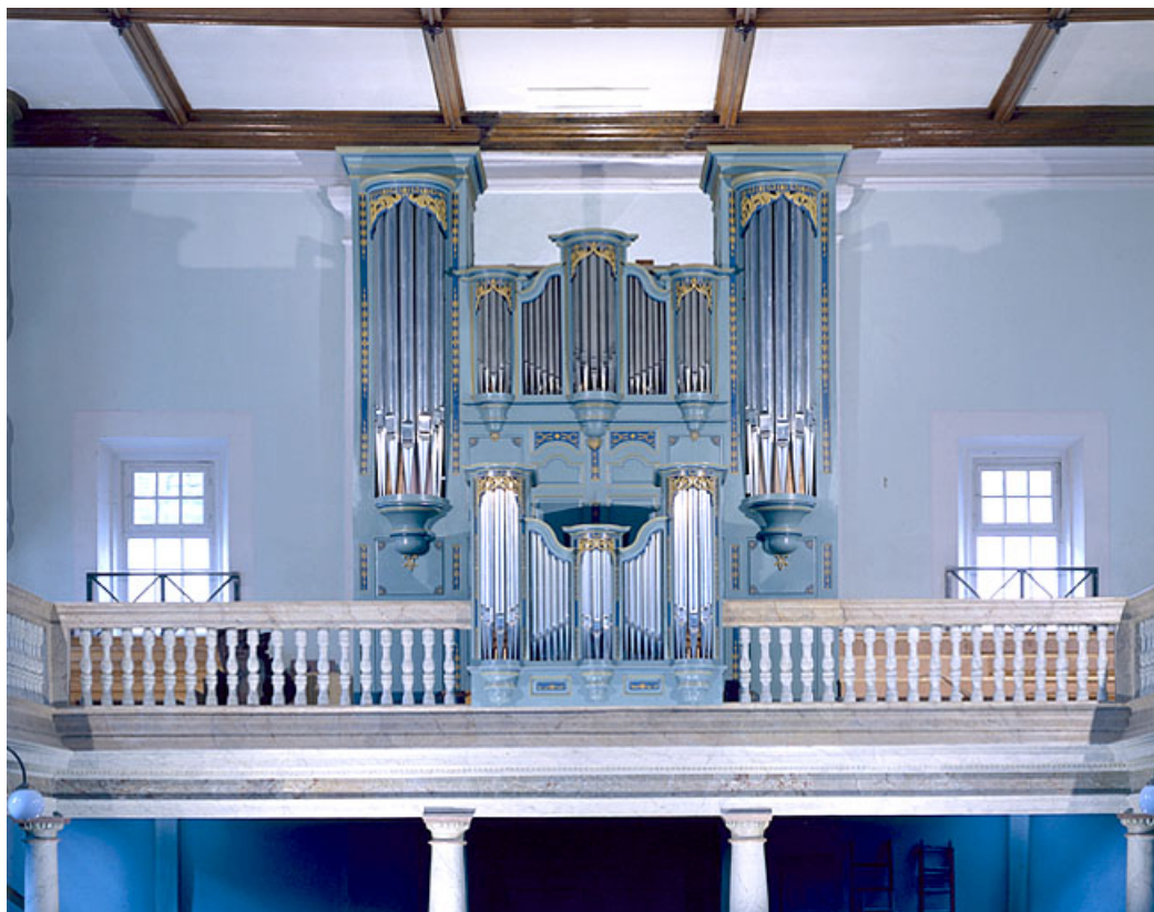
Vue d'ensemble, face, après restauration. 25, Montbéliard place Saint-Martin