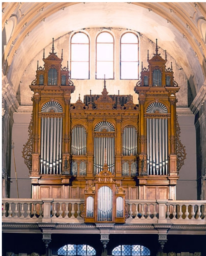
Vue d'ensemble, face.