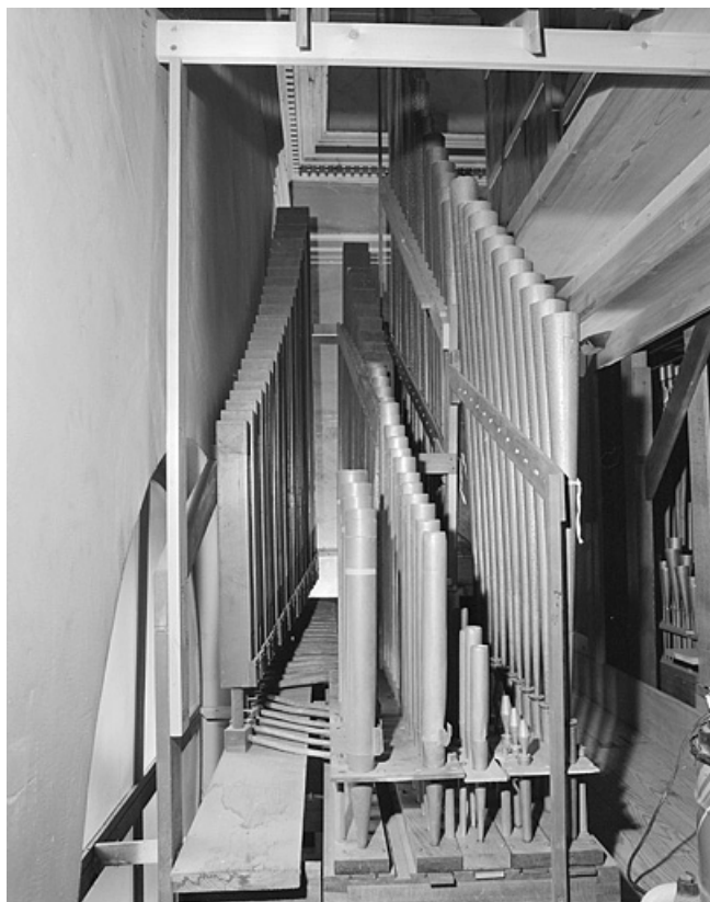
Vue d'ensemble de la tuyauterie de pédale.