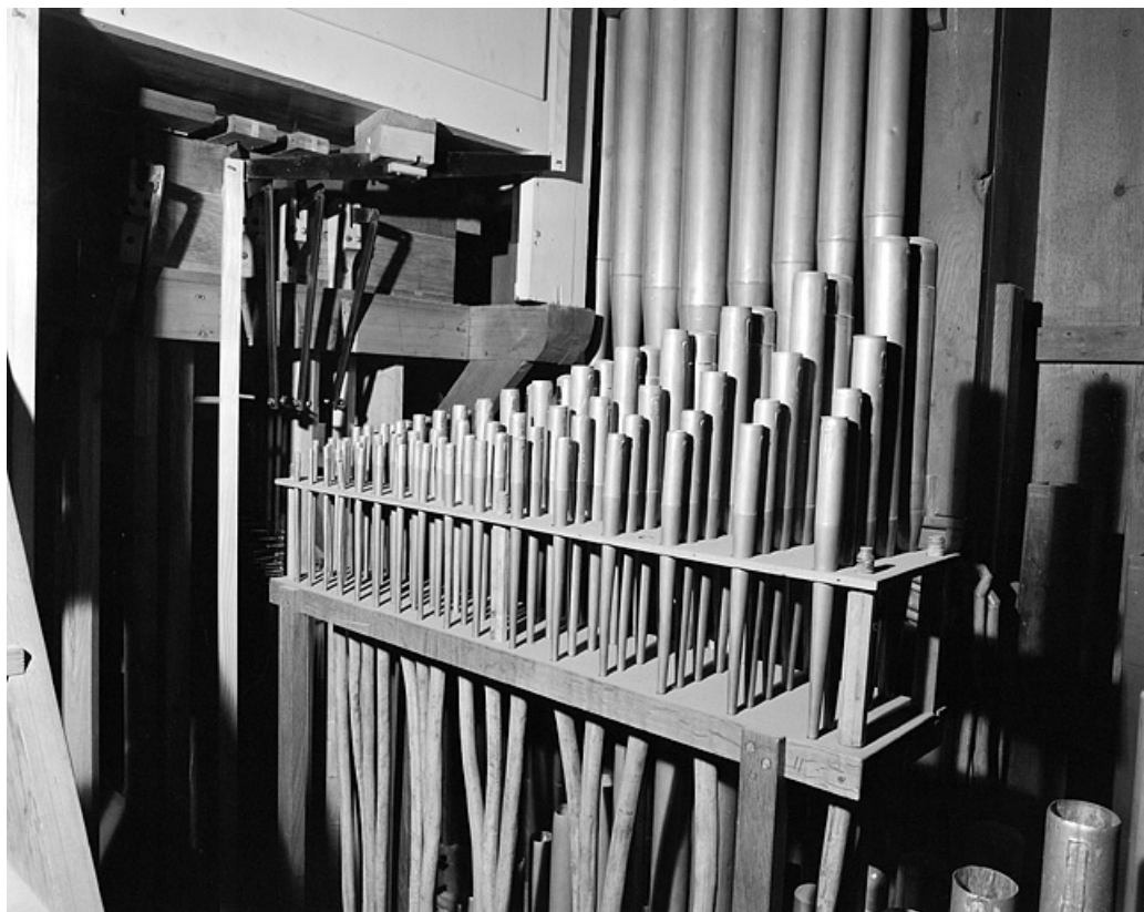
Tuyauterie du grand orgue, détail des tuyaux de cornet.