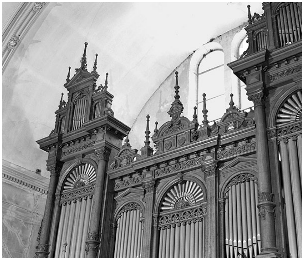
Détail du couronnement du buffet du grand orgue.