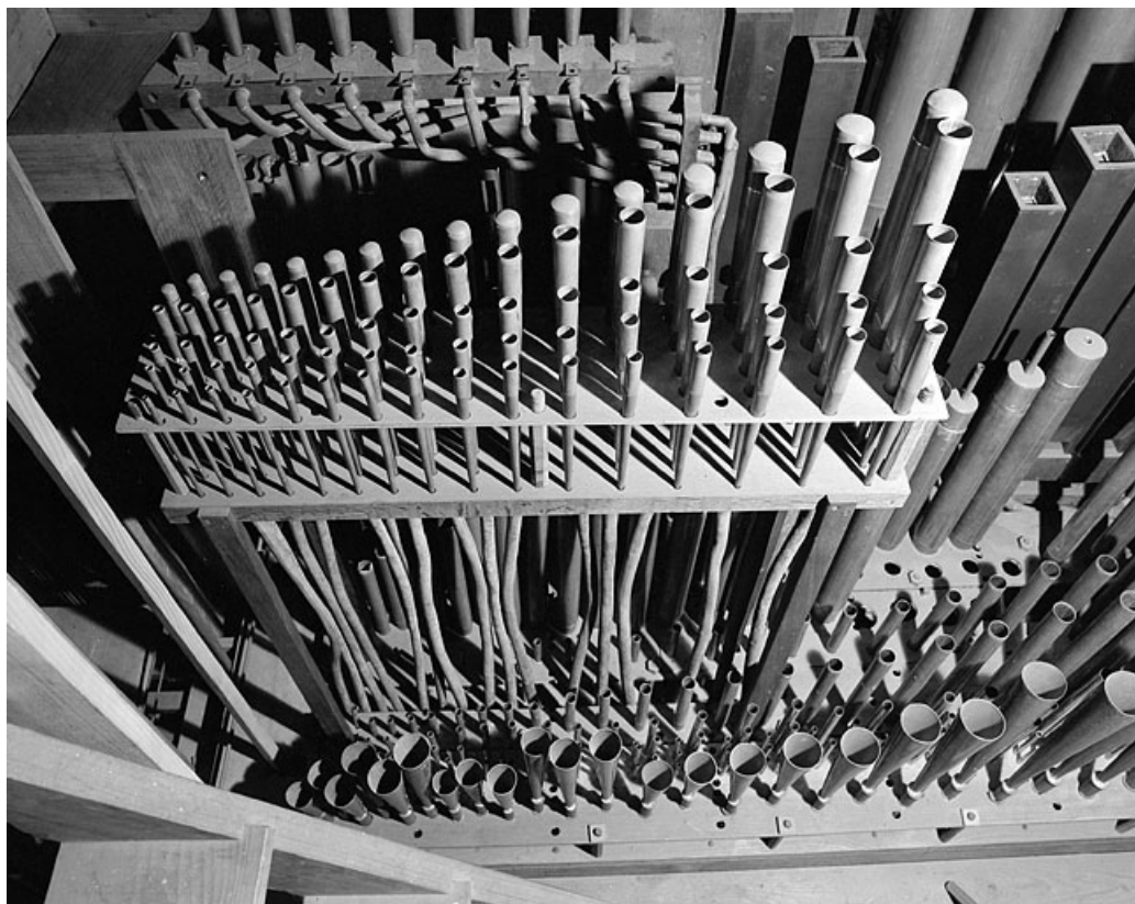
Détail de la tuyauterie du grand orgue (vue plongeante). 25, Montbéliard rue Saint-Maimboeuf