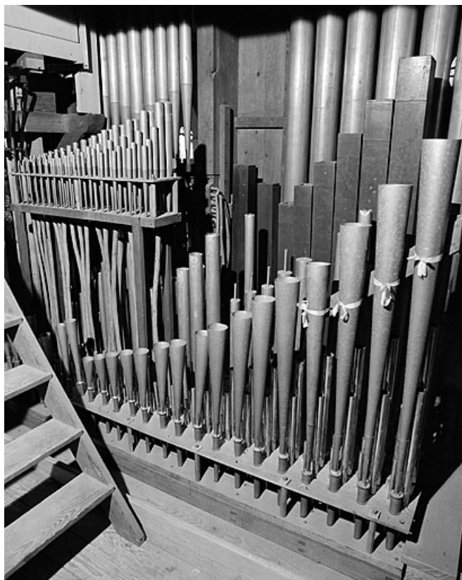
Détail de la tuyauterie du grand orgue. 25, Montbéliard rue Saint-Maimboeuf