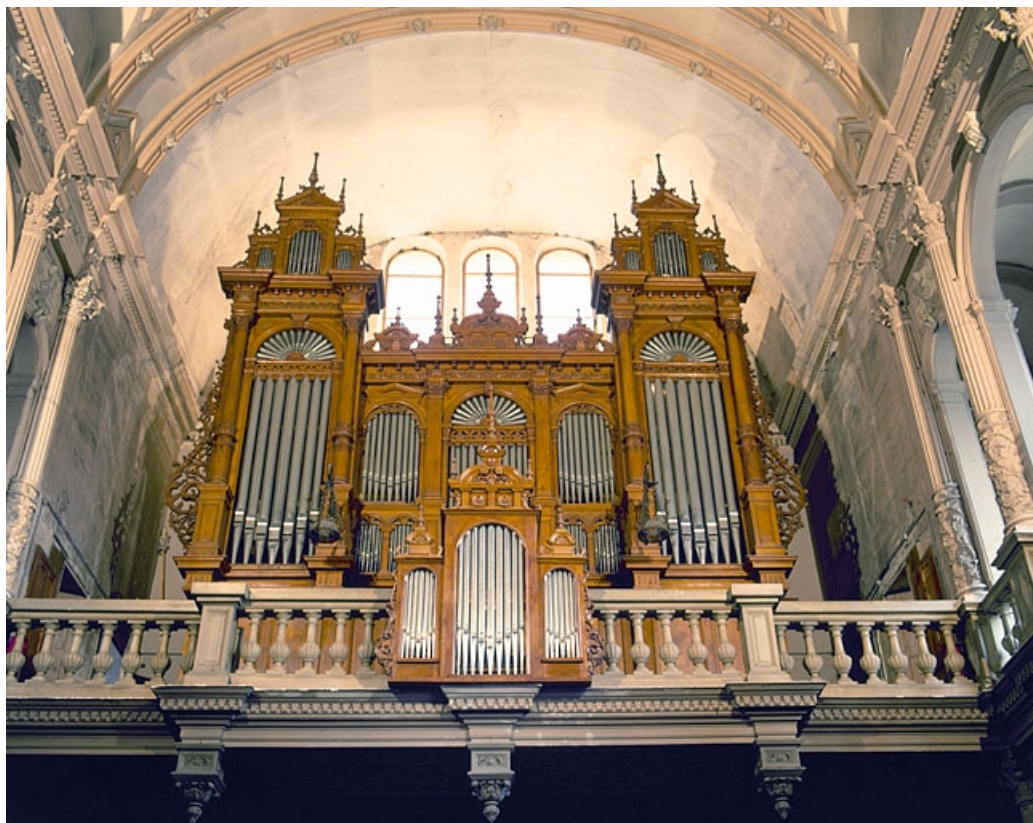
Vue d'ensemble, prise du bas de la nef. 25, Montbéliard rue Saint-Maimboeuf