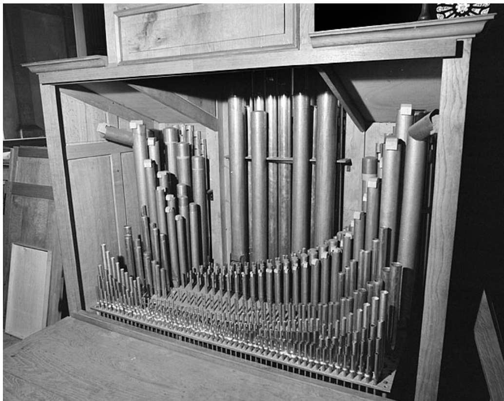
Vue d'ensemble de la tuyauterie du positif.