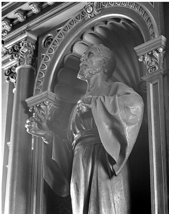
Détail, trois quarts droit.