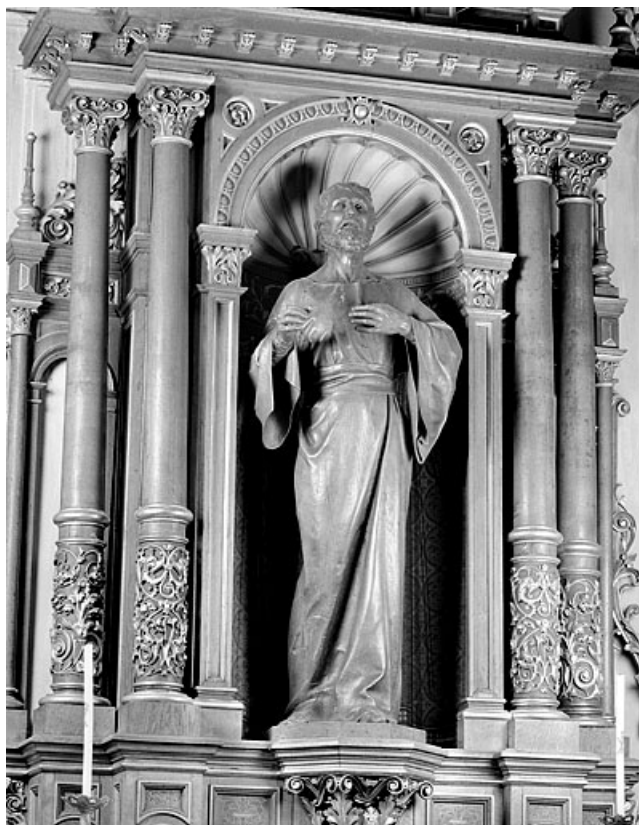
Vue d'ensemble, trois quarts gauche. 25, Montbéliard rue Saint-Maimboeuf