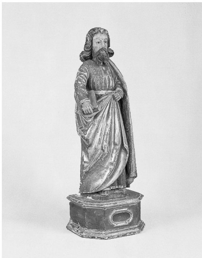
Vue de trois quarts avant droit.