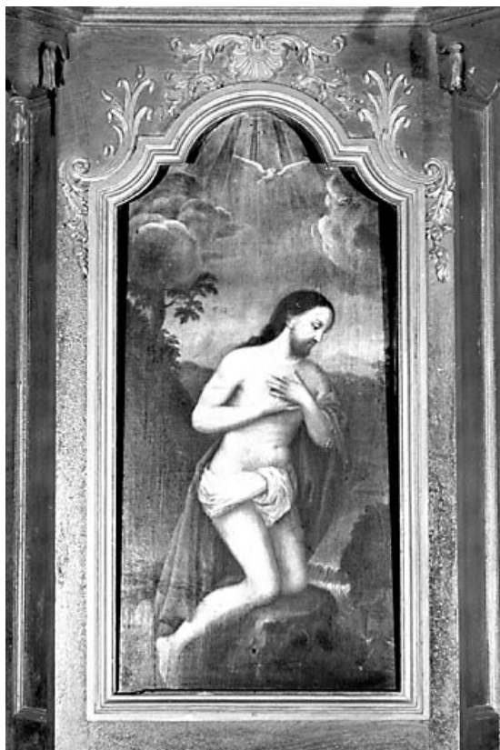
Vue d'ensemble du tableau : le Baptême du Christ. 25, Grand'Combe-Châteleu