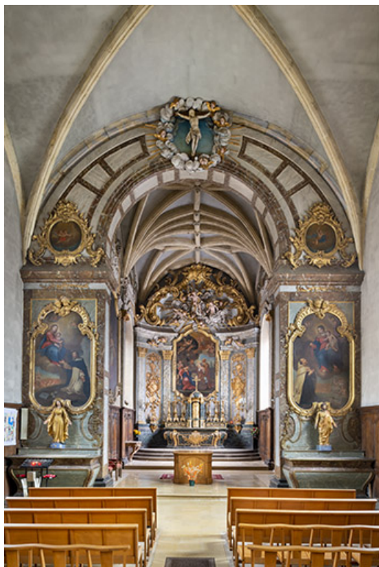
Le chœur vu depuis la tribune en 2021.