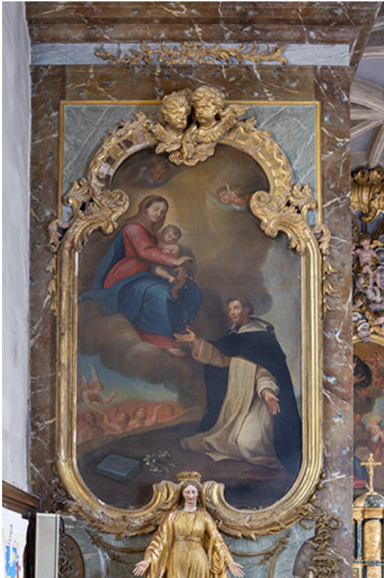
vue d'ensemble en 2021.