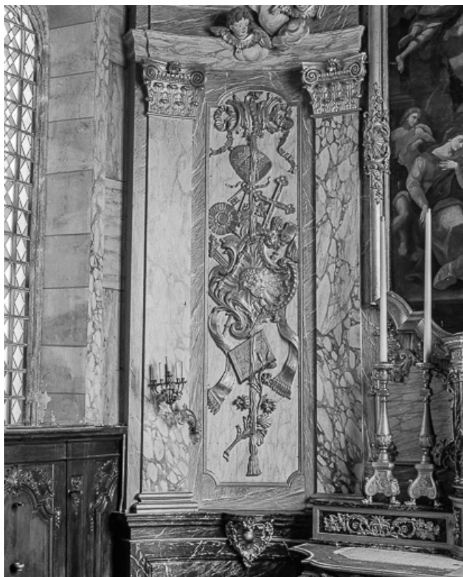
Détail : parclose gauche du retable.