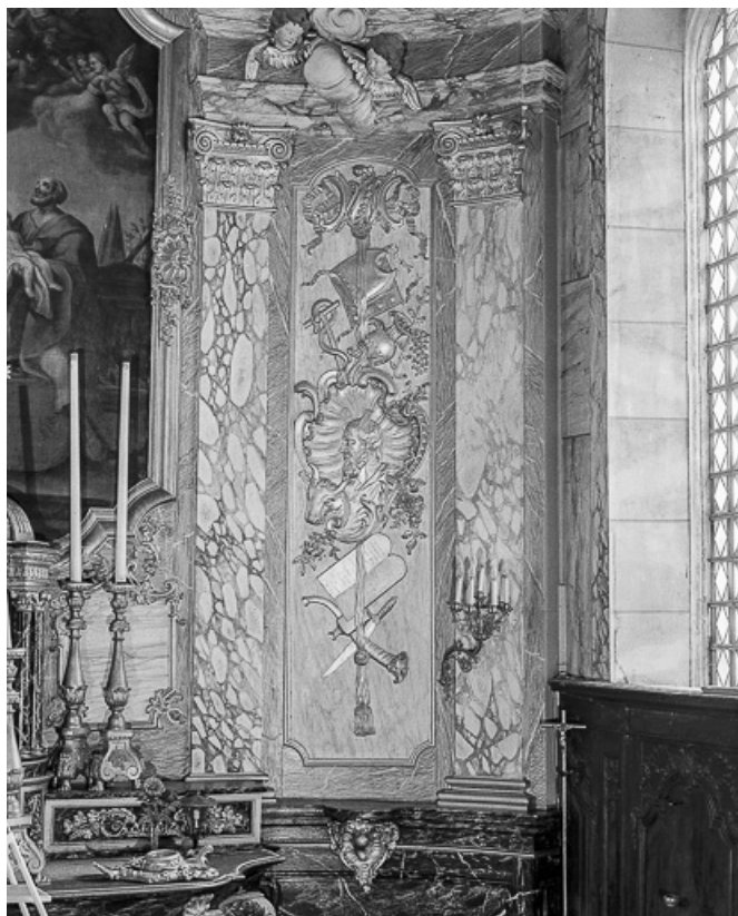
Détail : parclose droit du retable. 25, Grand'Combe-Châteleu