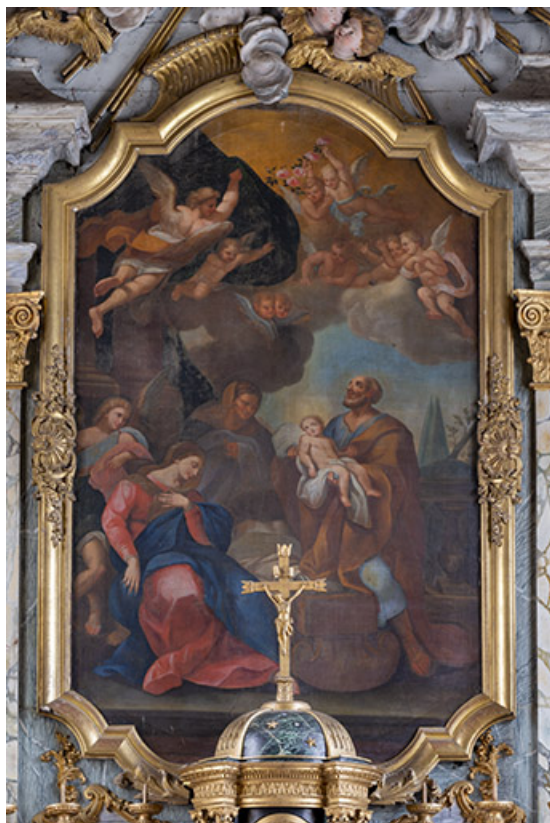
Vue d'ensemble en 2021.