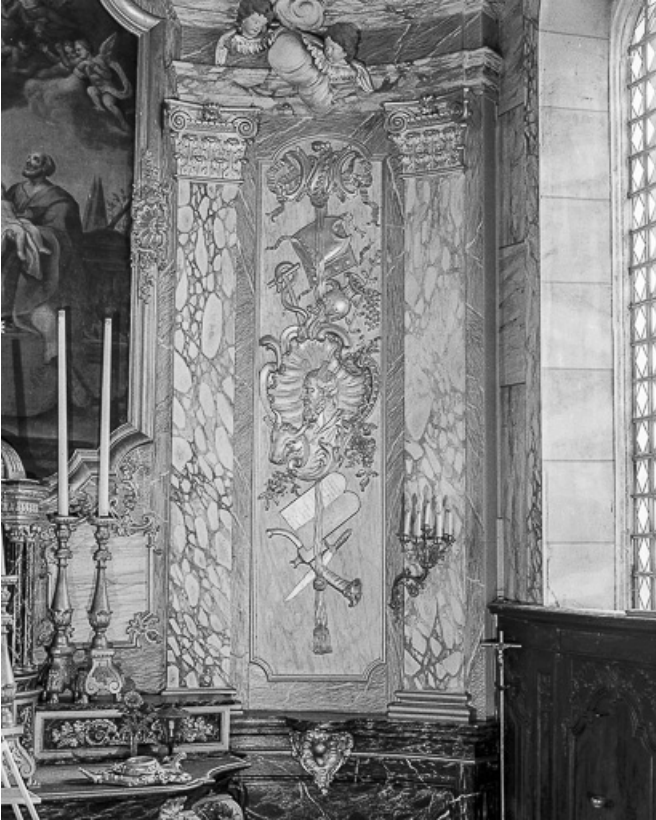
Détail : parclose droit du retable. 25, Grand'Combe-Châteleu