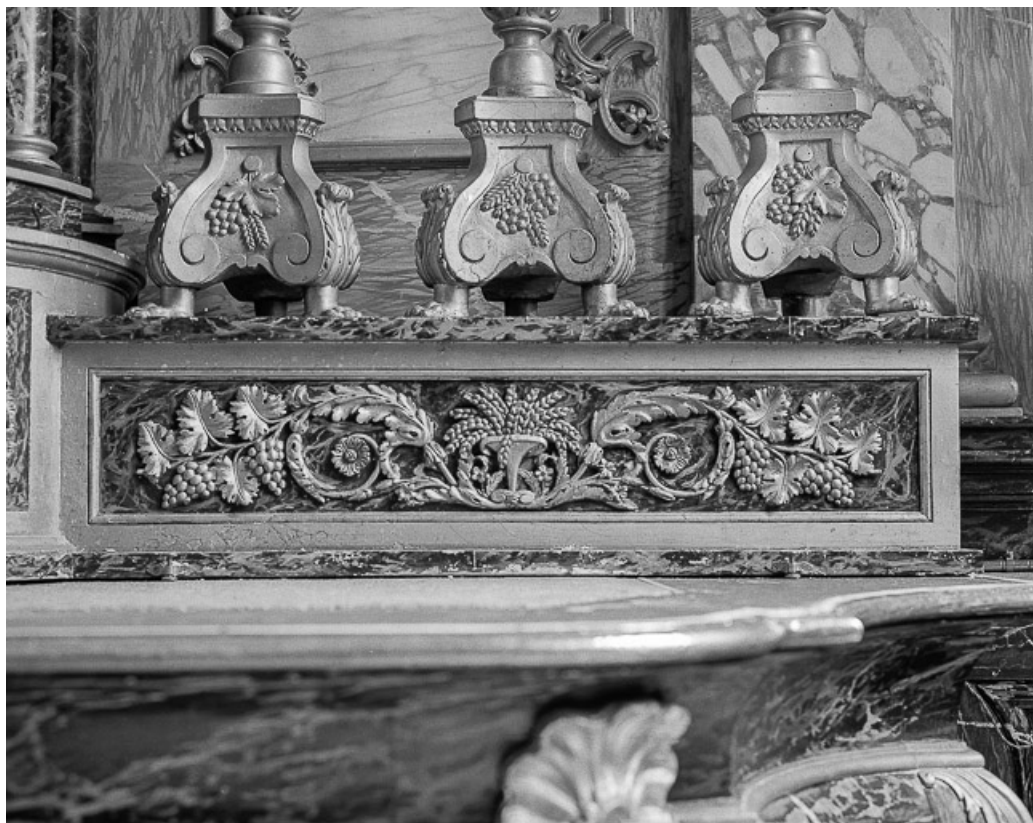
Détail : le gradin, côté droit. 25, Grand'Combe-Châteleu