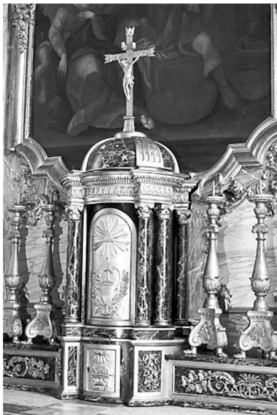
Vue d'ensemble tabernacle fermé.