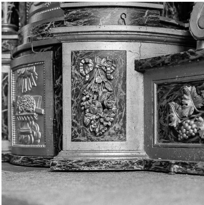
Détail : le tabernacle inférieur, côté droit. 25, Grand'Combe-Châteleu