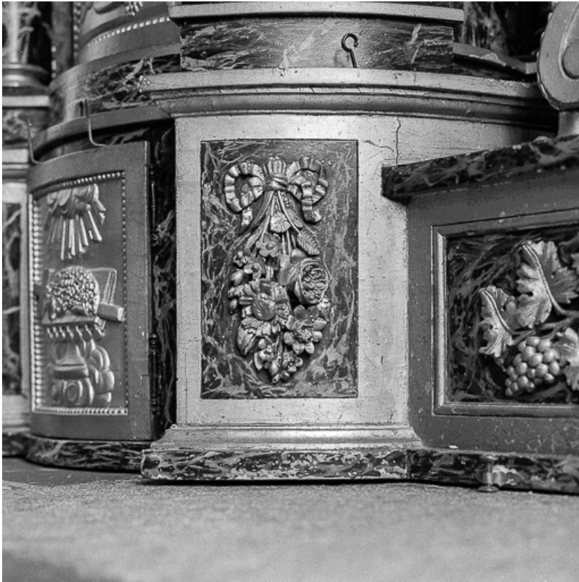
Détail : le tabernacle inférieur, côté droit. 25, Grand'Combe-Châteleu