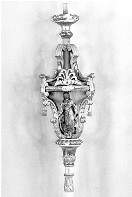
Vue d'un bâton de procession avec une statuette de la Vierge.