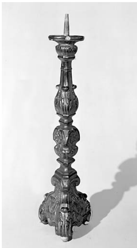
Vue d'un chandelier : pied vu de face.