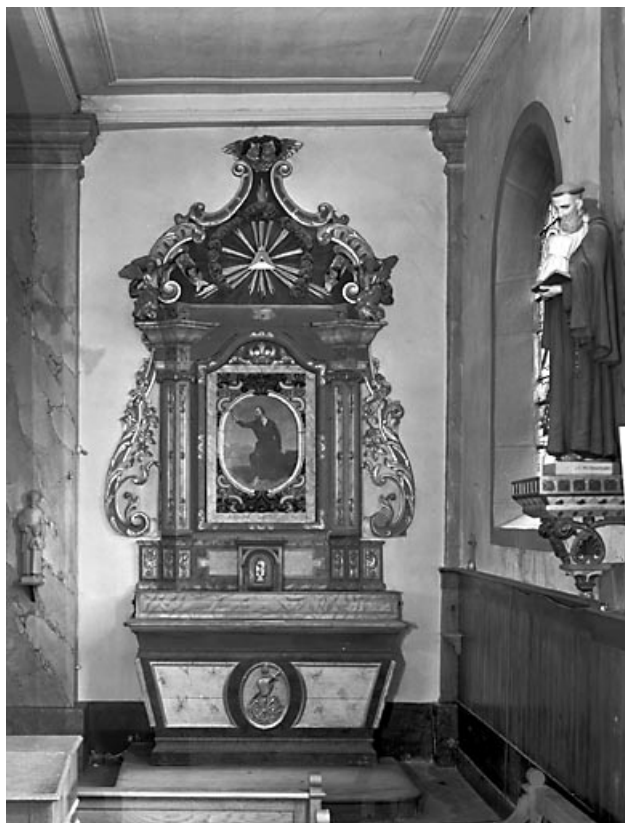
Vue de l'autel-retable latéral droit.