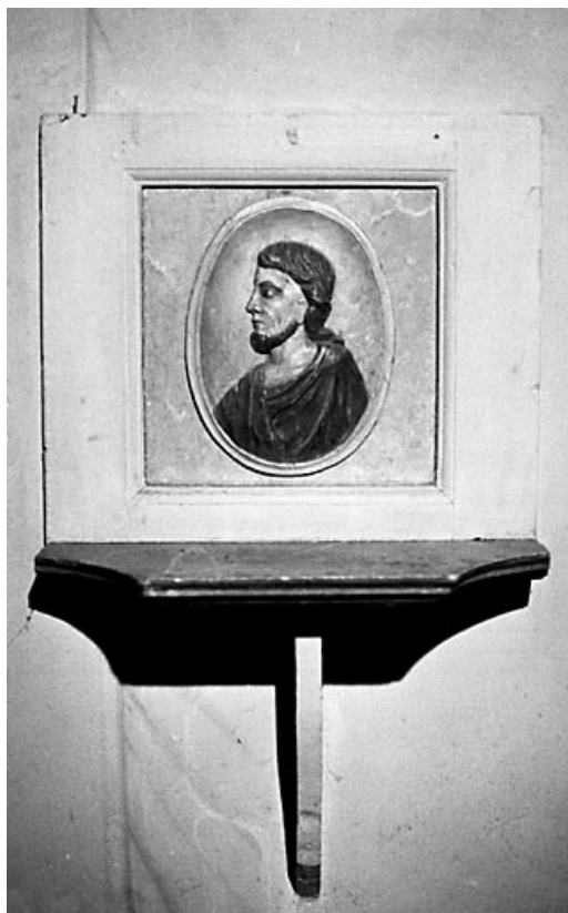
Bas-relief figurant saint Joseph.