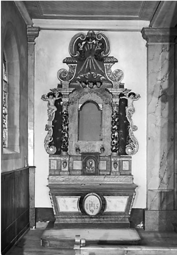
Vue d'ensemble de l'autel-retable latéral gauche.