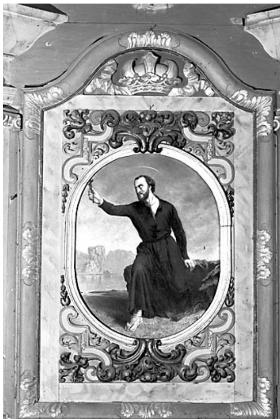
Peinture du retable droit.