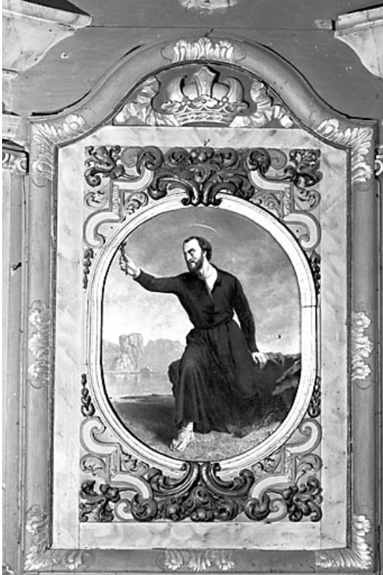
Peinture du retable droit.