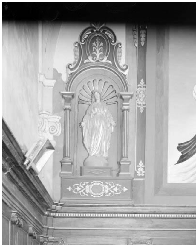
Détail : statue de la vierge de l'Immaculée Conception