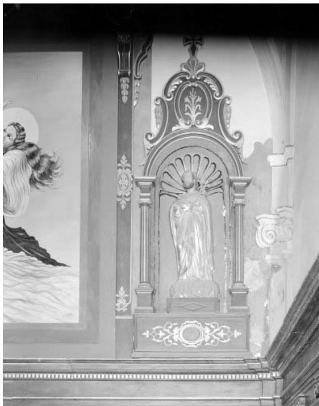
Détail : statue de saint Joseph