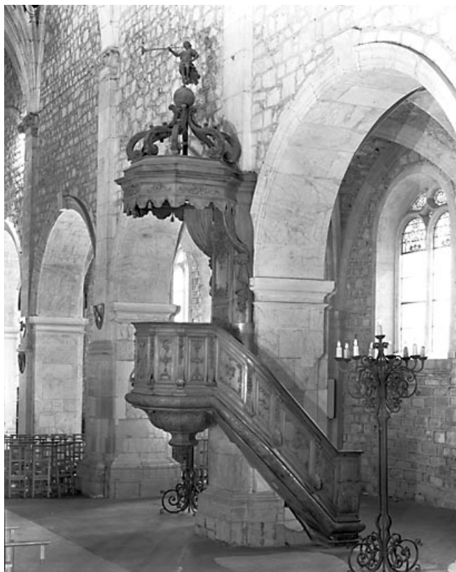
Vue d'ensemble. 25, Morteau