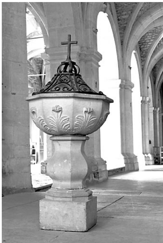
Vue générale. 25, Morteau