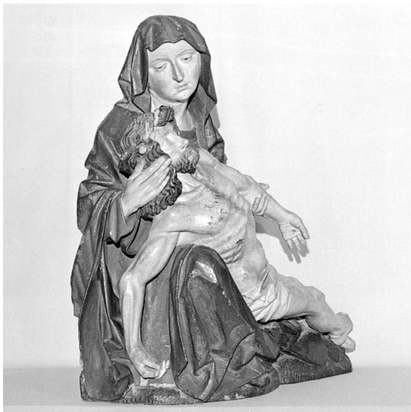
Vierge de Pitié en bois : vue de trois quarts droit.