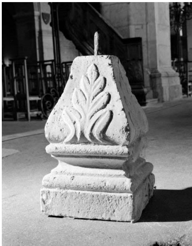
Support de bénitier ou de cuve baptismale. 25, Morteau