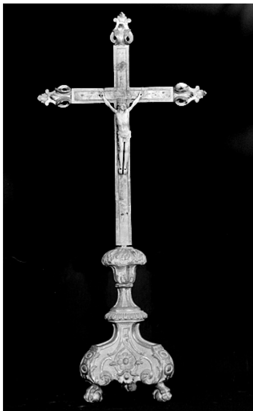
Croix d'autel, vue de face.