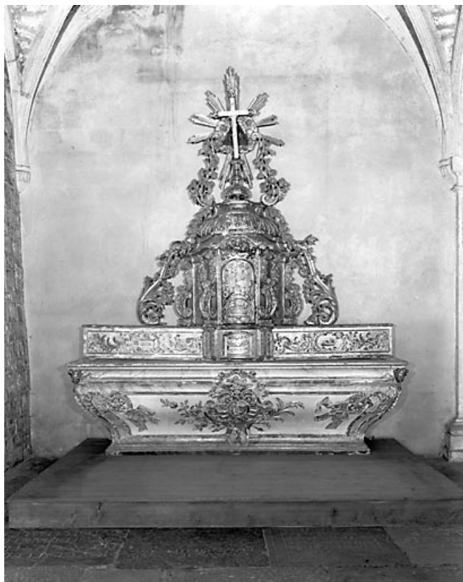
Ancien maître-autel et son tabernacle : vue d'ensemble. 25, Morteau