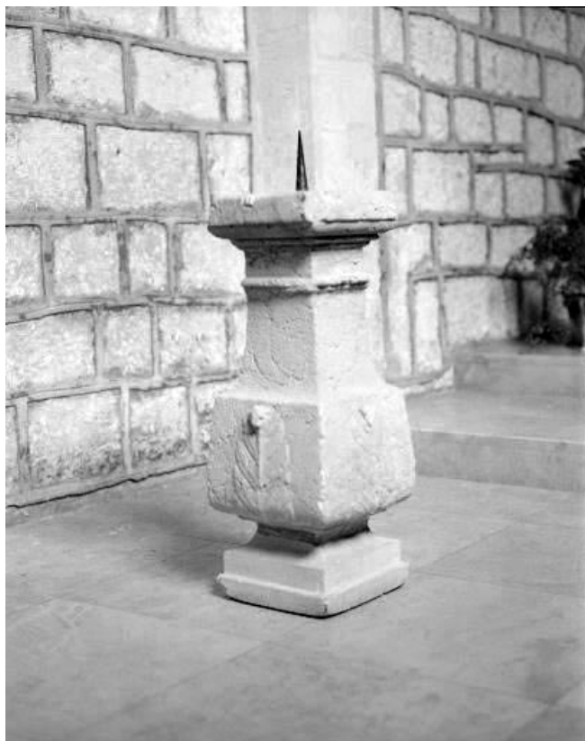
Support de bénitier ou de cuve baptismale. 25, Morteau