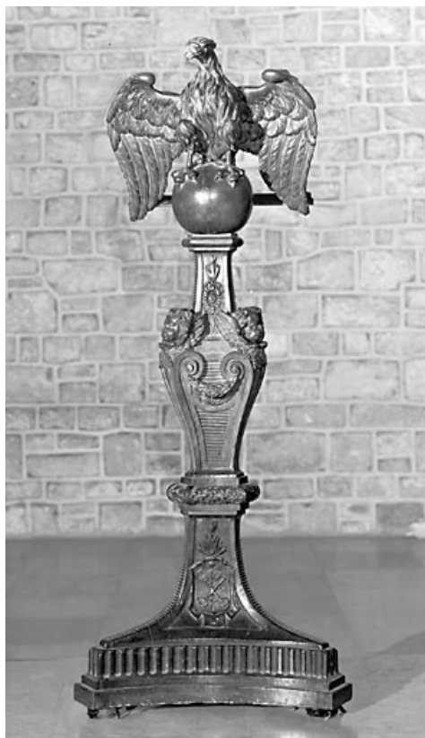
Lutrin à aigle monocéphale : vue de face.