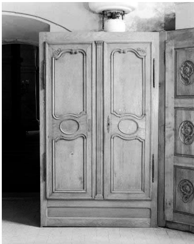
Deux battants de porte d'armoire : vue d'ensemble. 25, Morteau