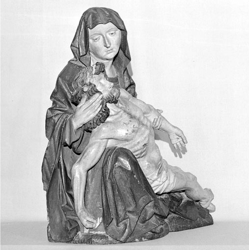
Vierge de Pitié en bois : vue de trois quarts droit.