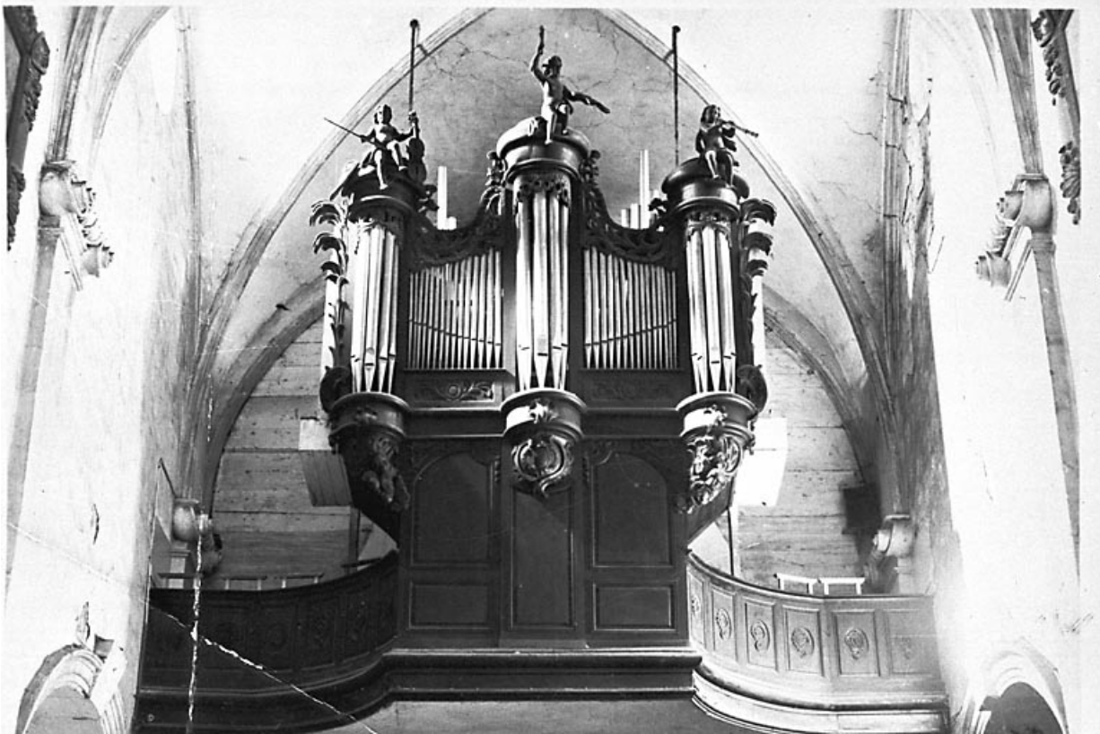
Vue d'ensemble (reproduction du cliché de Pierre Faivre). 25, Morteau