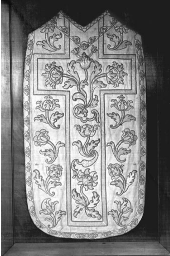
Chasuble brodée de paille et verroterie : vue de face.