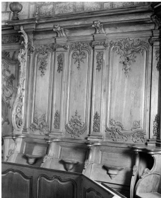
Détail : stalles et dorsaux I, II et III. 25, Morteau