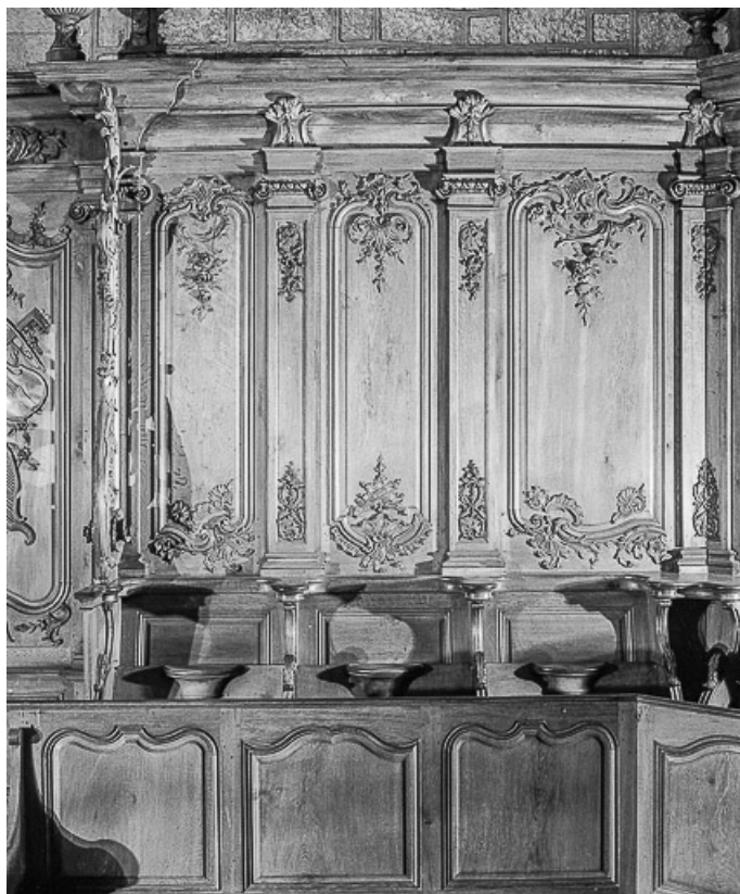
Dorsaux des stalles, de face.