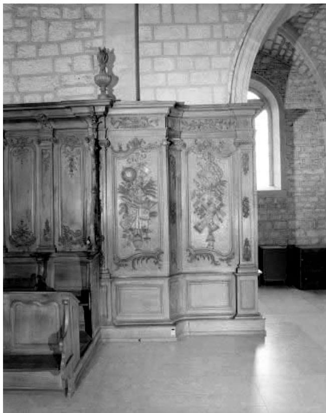
Détail : panneaux avec chutes d'objets liturgiques. 25, Morteau