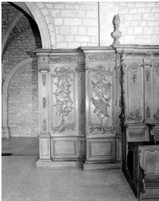
Détail : panneaux avec chutes d'instruments de musique. 25, Morteau