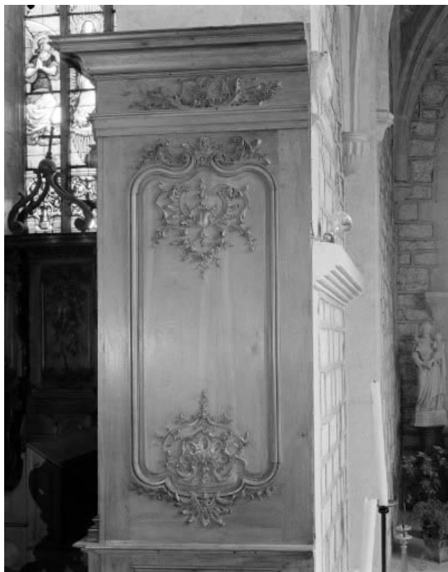
Détail : panneau formant retour sur le pied droit de l'arcade droite du chœur. 25, Morteau