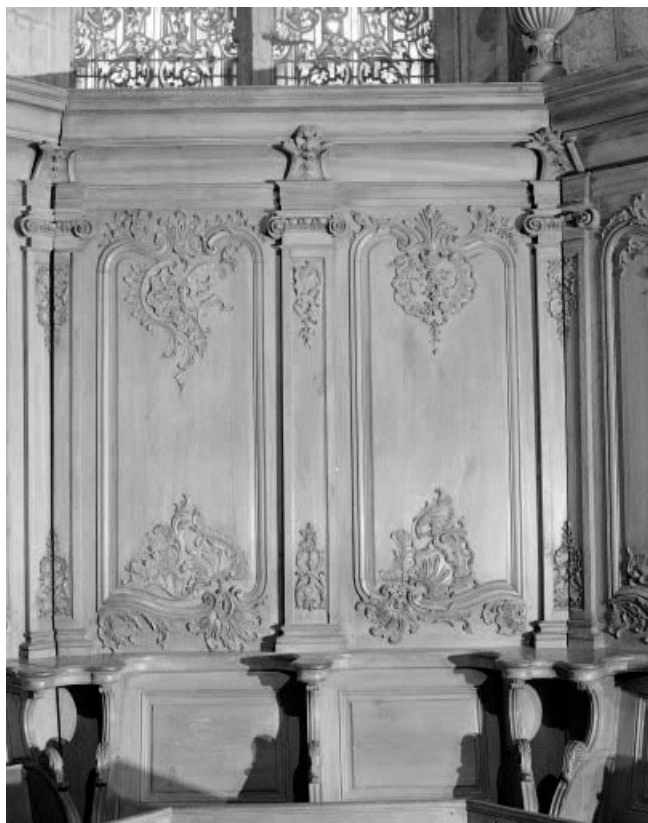
Détail : dorsaux des stalles du pan coupé du chœur. 25, Morteau