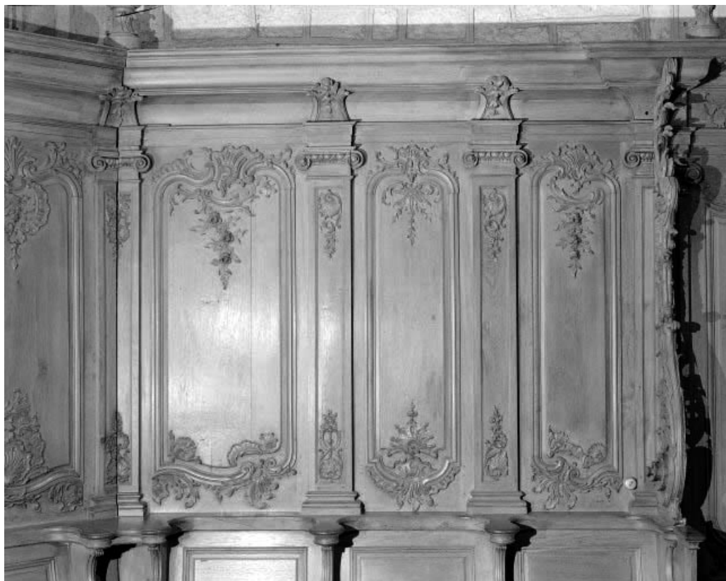
Détail : dorsaux des stalles du mur droit du chœur. 25, Morteau