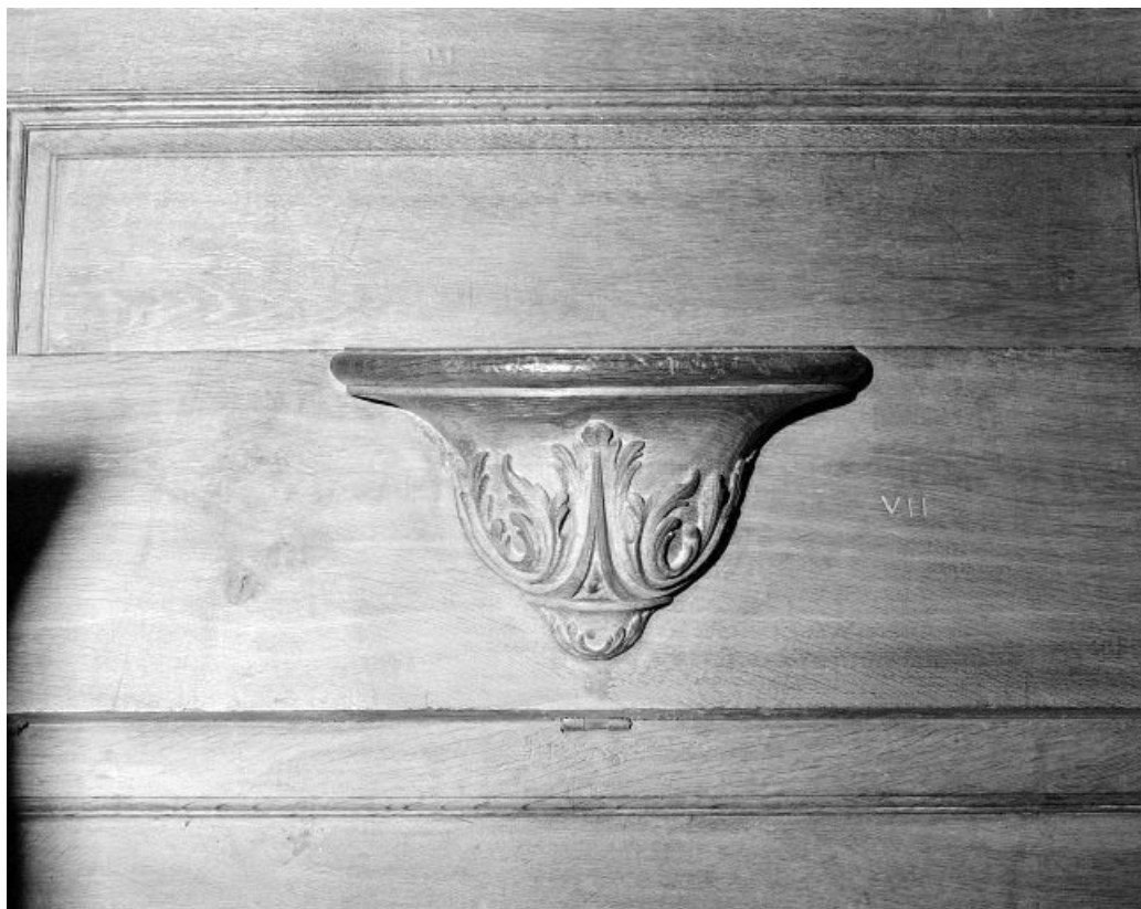
Détail : miséricorde avec motifs végétaux. 25, Morteau