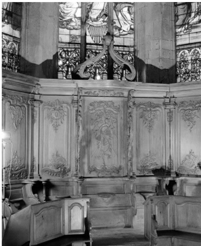
Détail : stalle de prieur. 25, Morteau