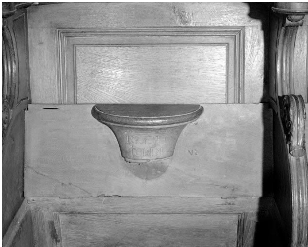
Détail : miséricorde avec signature JOSEPH IOBIN. 25, Morteau