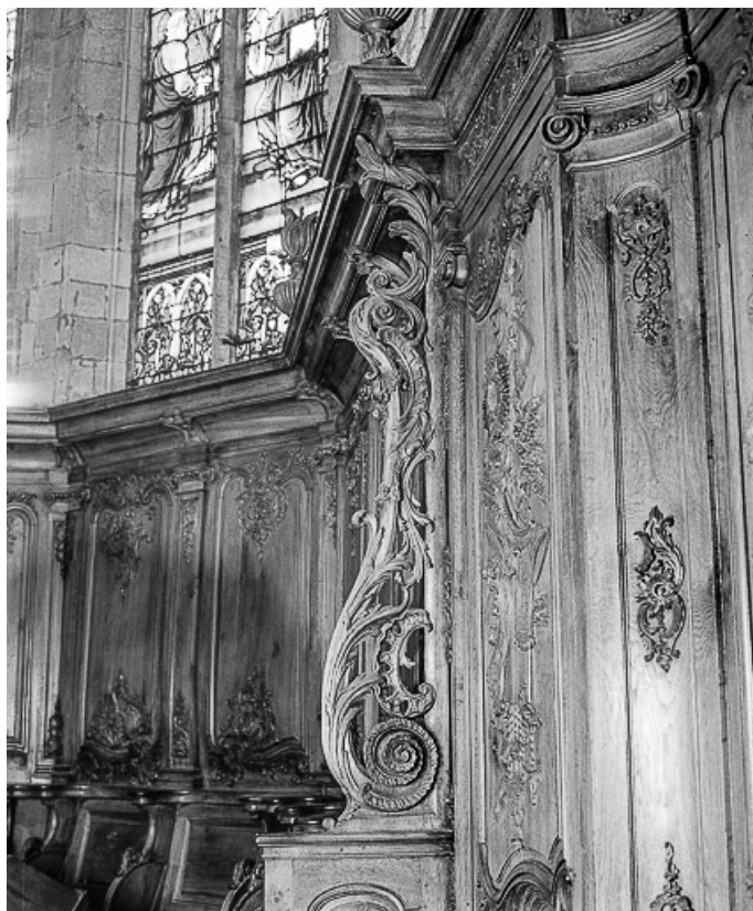
Jouée, côté droit. 25, Morteau