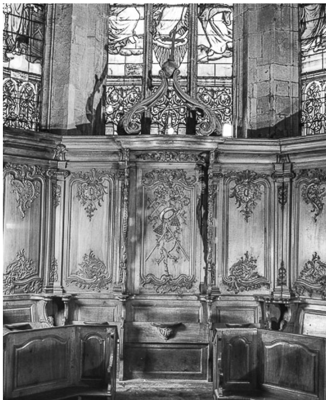
Stalle abbatiale, vue de côté. 25, Morteau