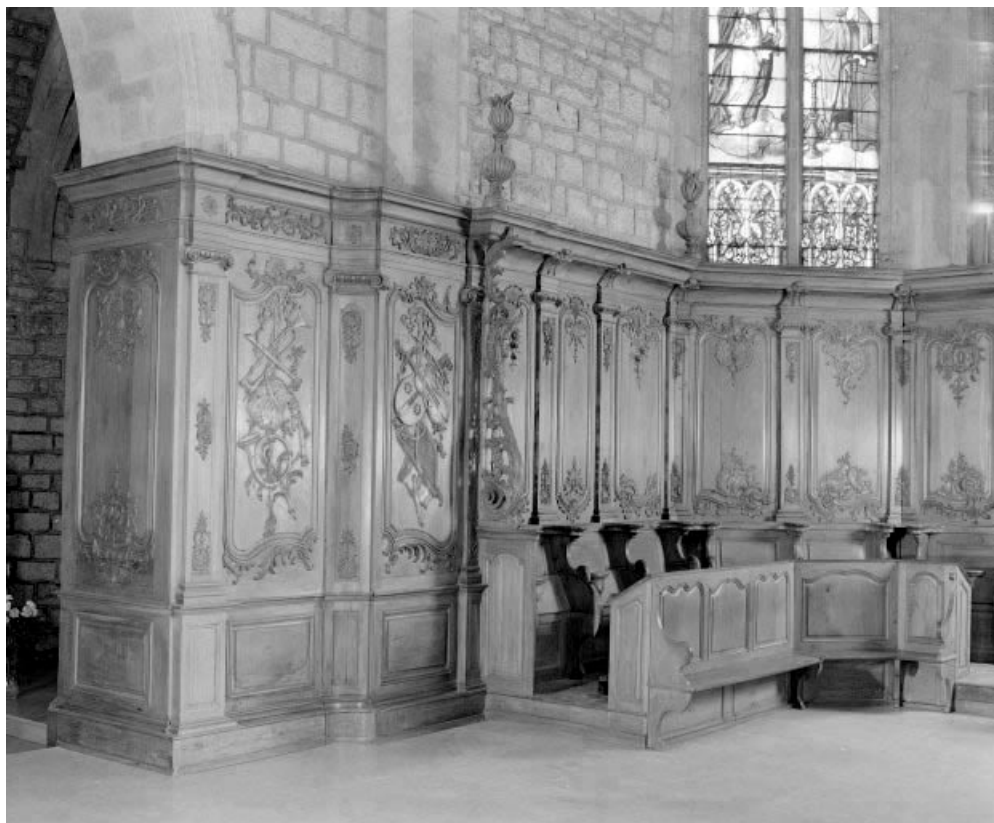
Vue d'ensemble de trois quarts.