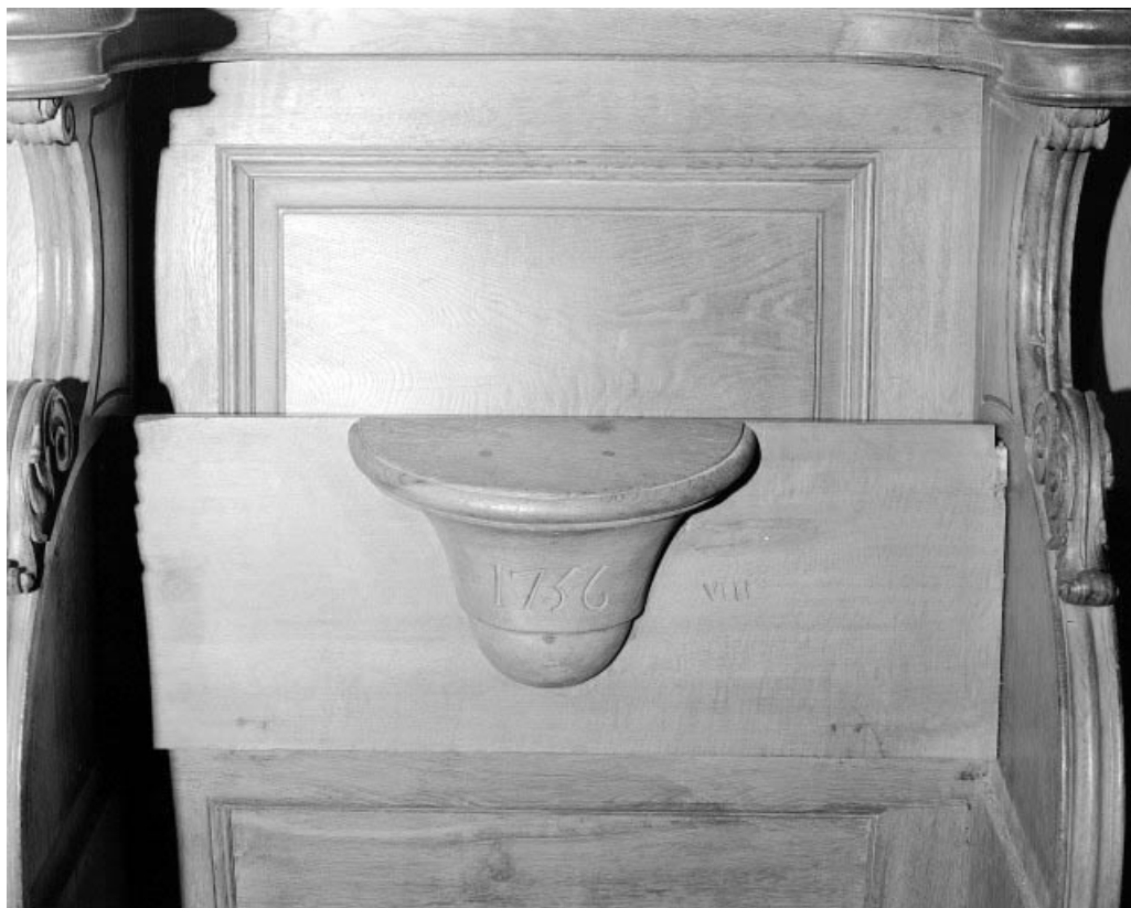
Détail : miséricorde datée de 1756.