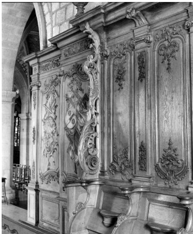
Détail : panneaux 2 -3 et stalles II-III. 25, Morteau