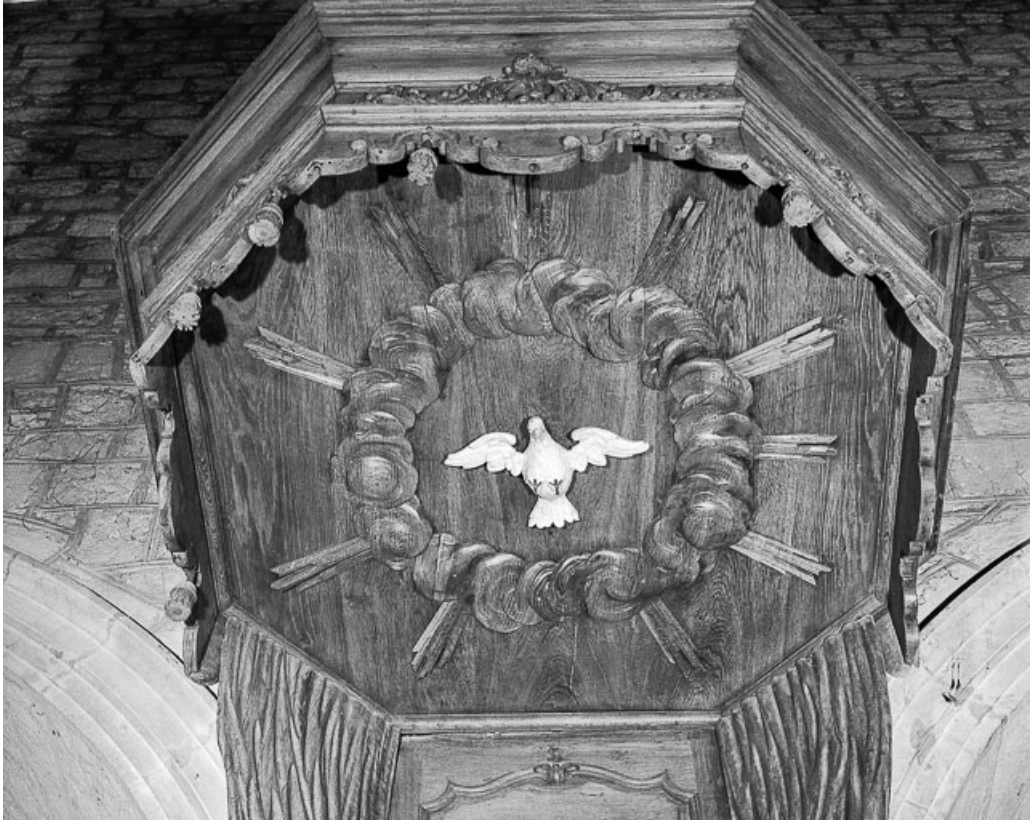
Détail : ciel de l'abat-voix.