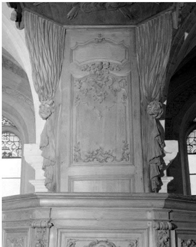
Détail : le dorsal.