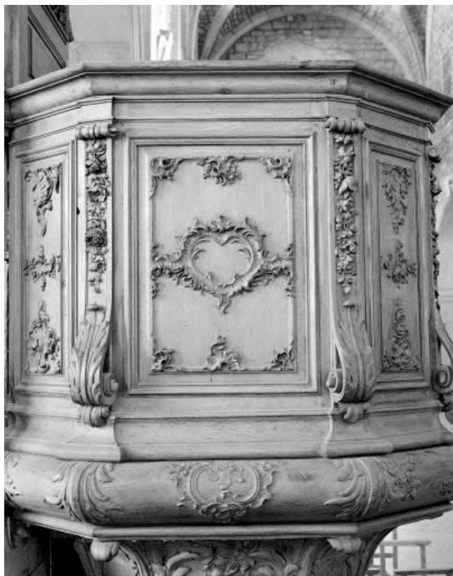
Détail : un grand panneau de la cuve, pan Est. 25, Morteau