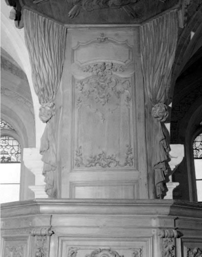
Détail : le dorsal.