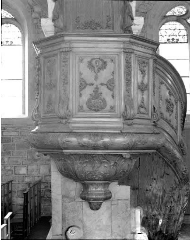
Détail : la cuve et le culot.