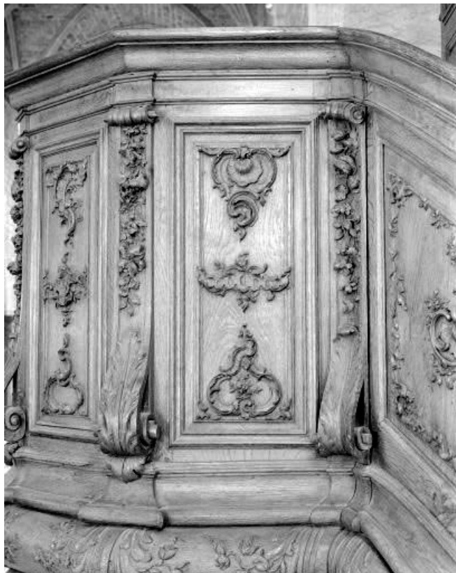
Détail : un petit panneau de la cuve, pan Ouest. 25, Morteau