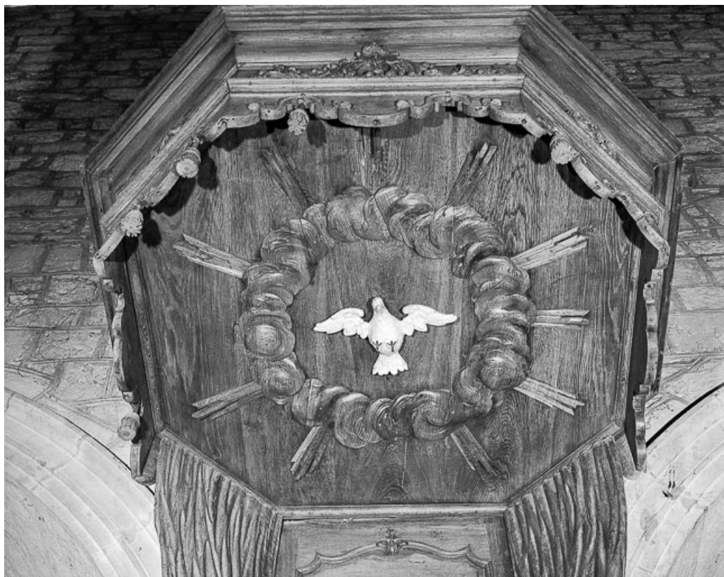
Détail : ciel de l'abat-voix. 25, Morteau