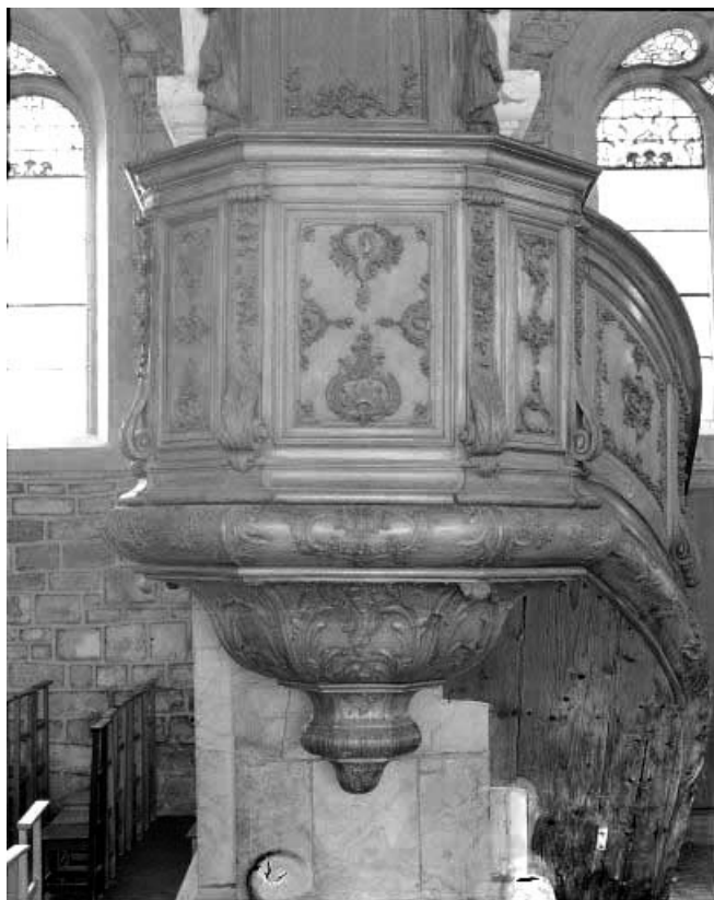
Détail : la cuve et le culot. 25, Morteau