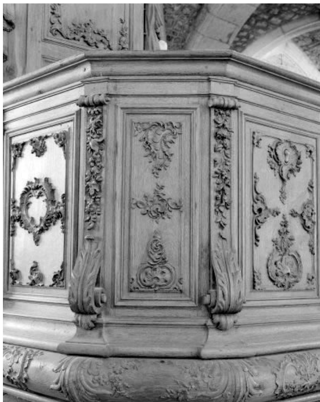
Détail : un petit panneau de la cuve, pan Nord-Est. 25, Morteau