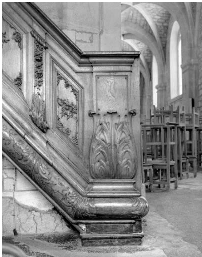
Détail : le départ de la rampe. 25, Morteau