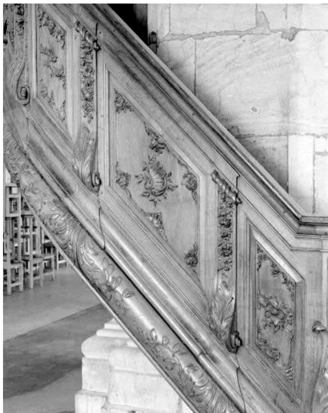
Détail : panneau de la rampe. 25, Morteau