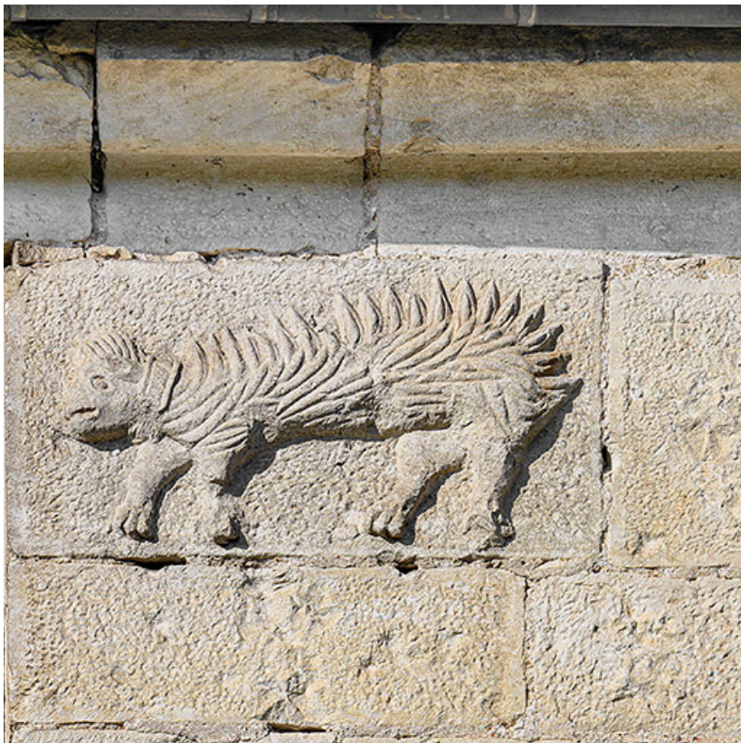
Détail d'un porc-épic.