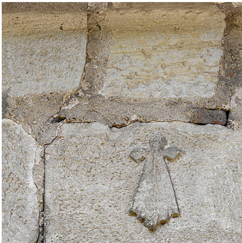
Détail d'une hermine.