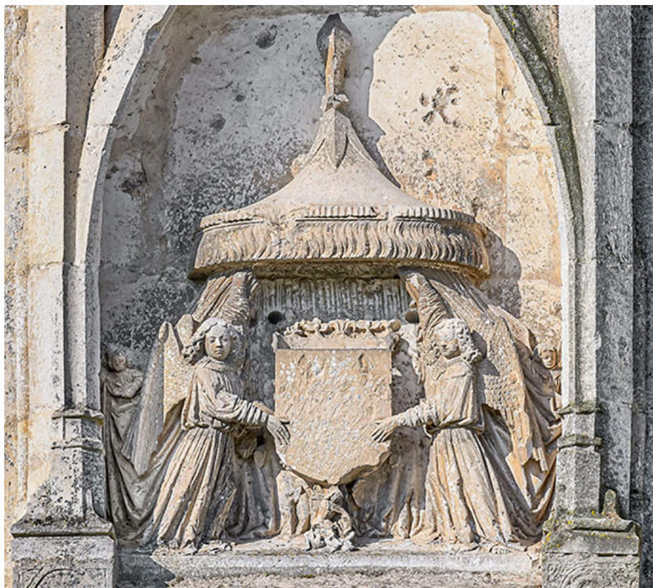
Le groupe sculpté : détail des anges porte-écu sous le baldaquin. 21, Auxonne boulevard Pasteur