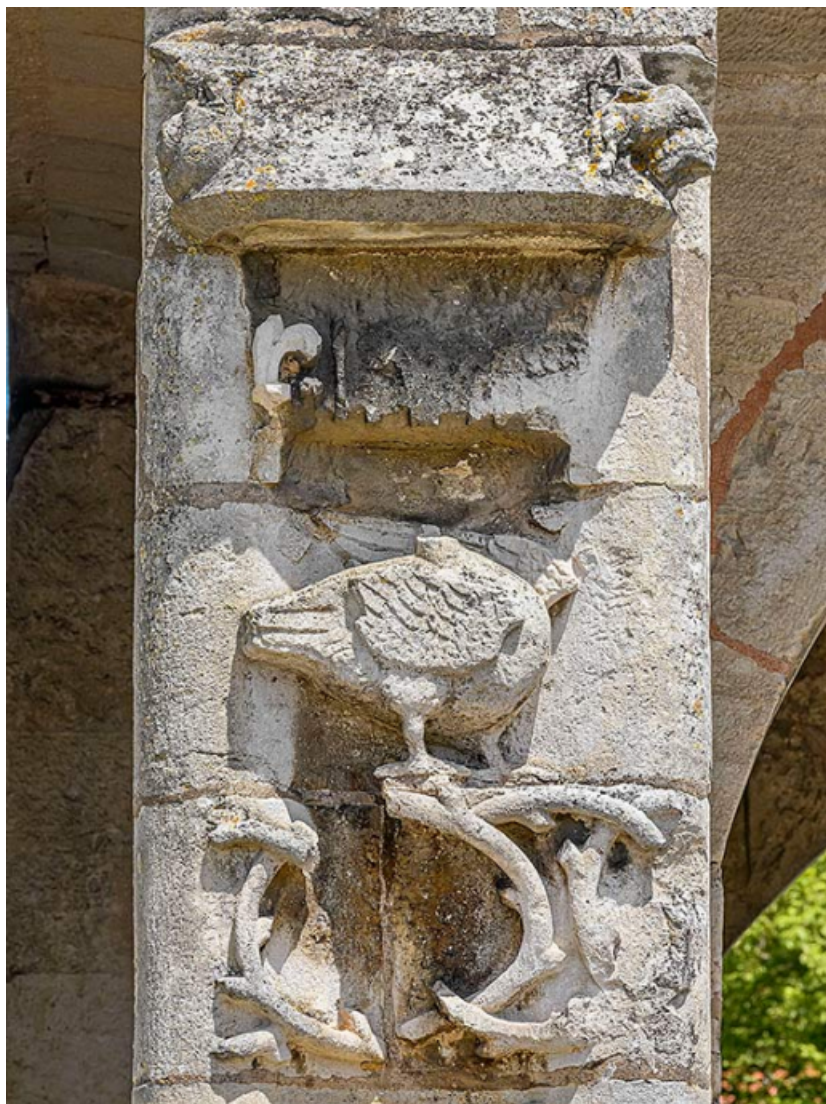
Détail de l'oiseau et son couronnement.