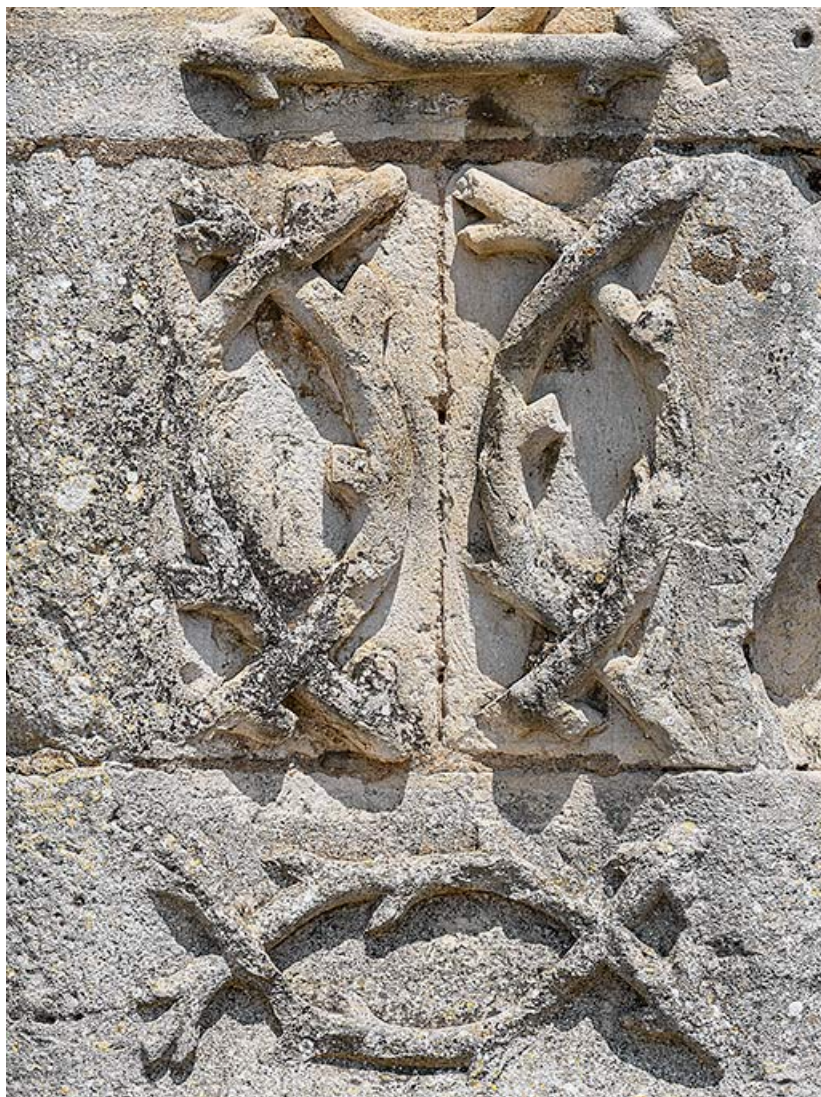
Détail des rinceaux végétaux.