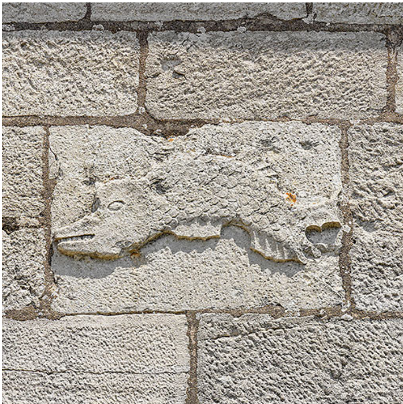
Sculpture représentant un second dauphin.