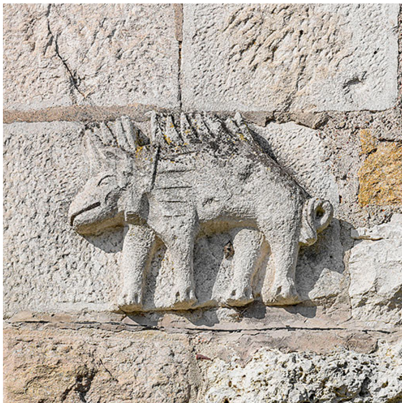
Détail d'un porc-épic.