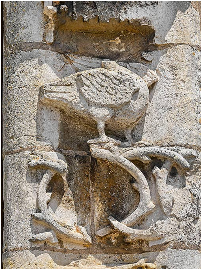
Détail de l'oiseau décapité. 21, Auxonne boulevard Pasteur