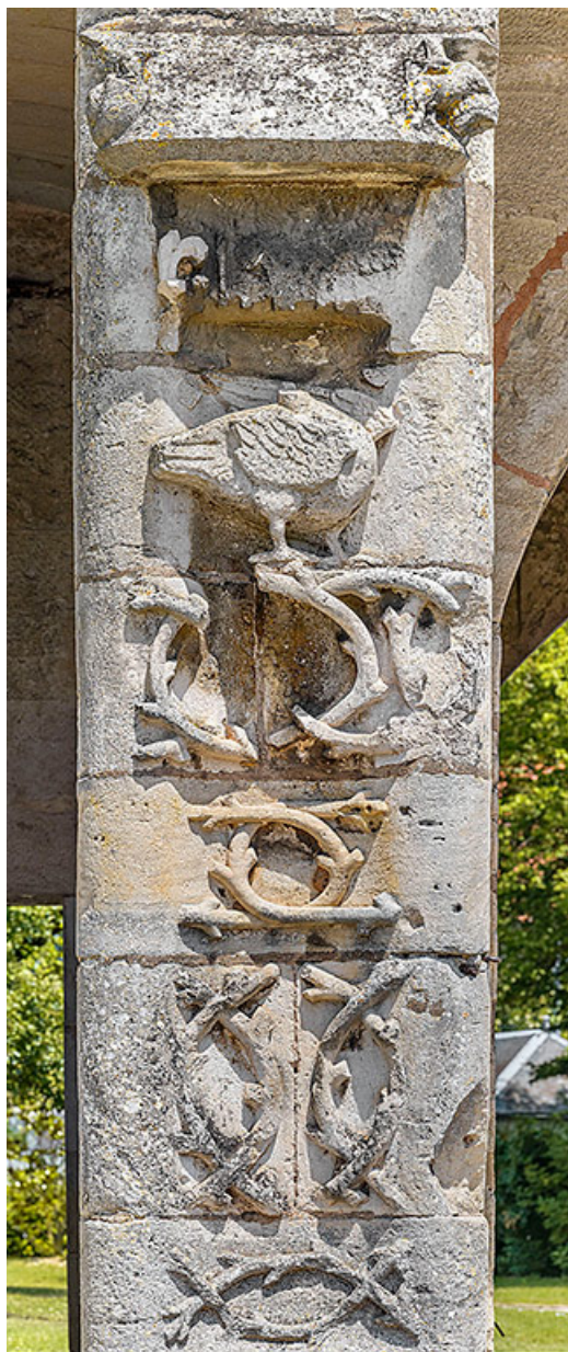
Pilier sculpté de rinceaux végétaux entrelacés et d'un oiseau.