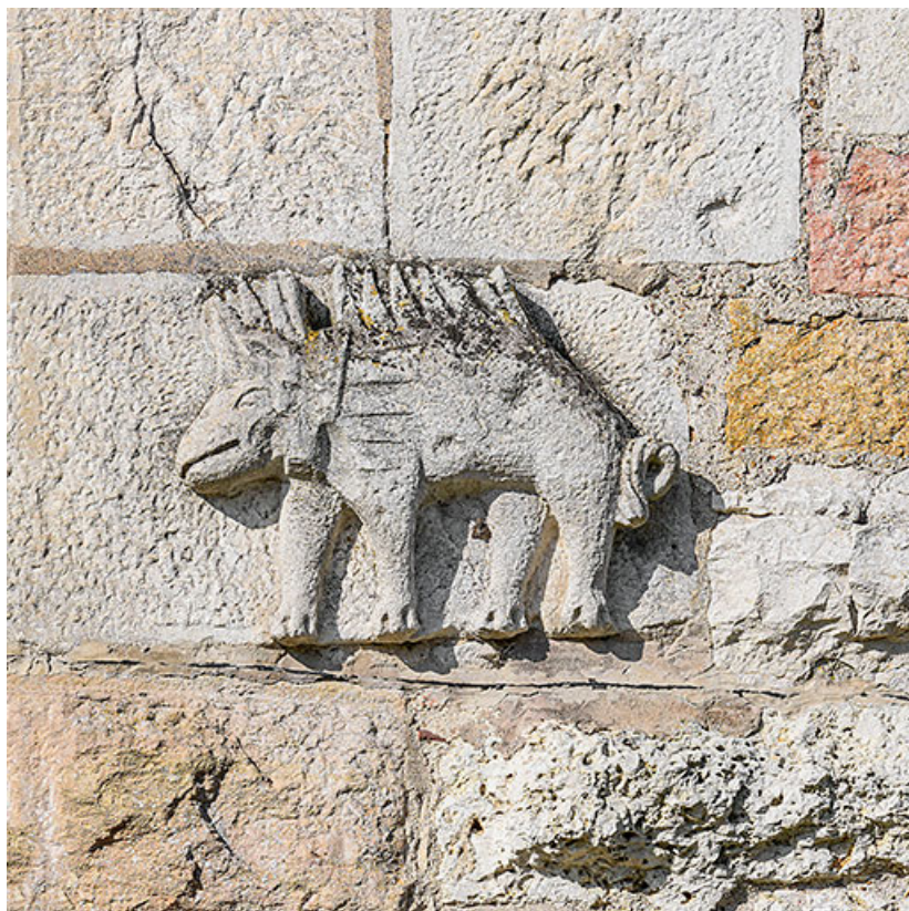
Détail d'un porc-épic.