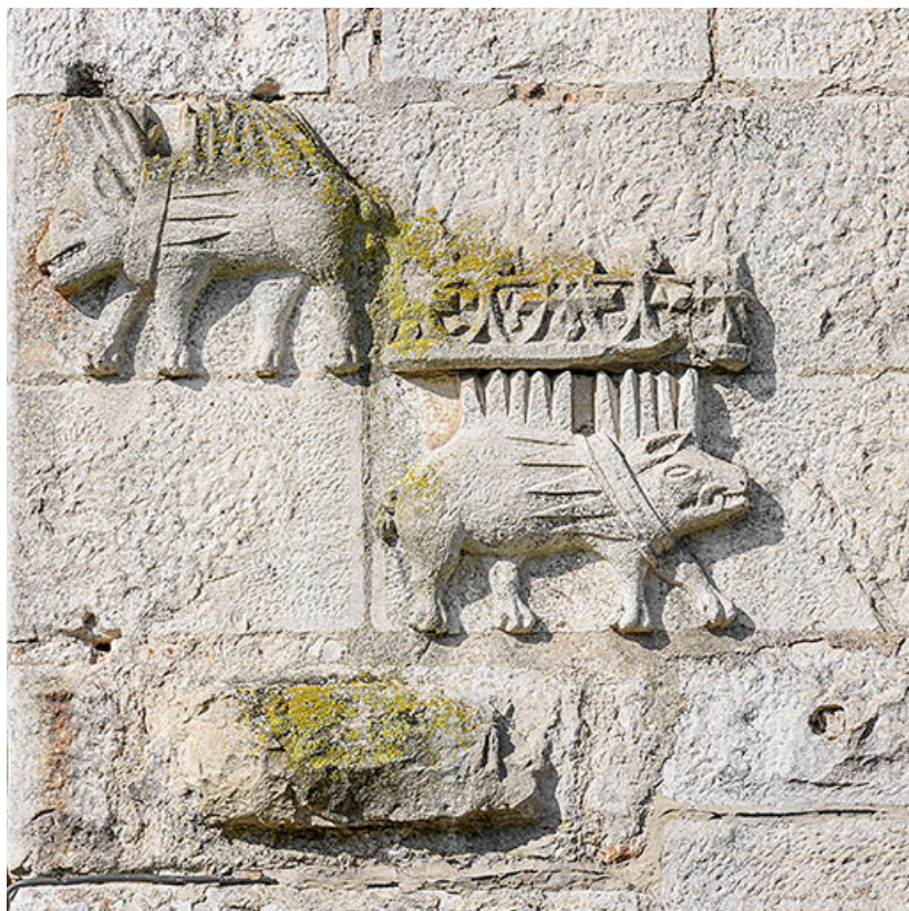
Détail d'un porc-épic couronné.