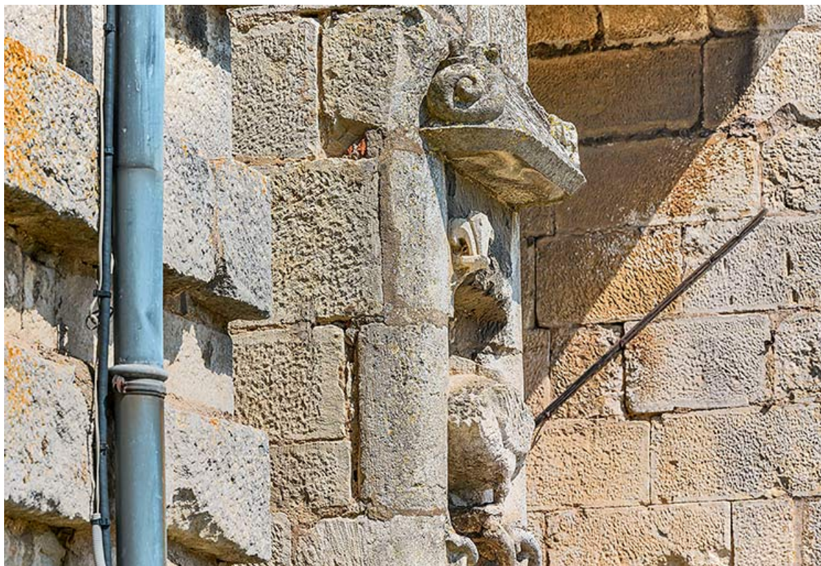
Couronne de l'oiseau décapité, vue de trois quarts.