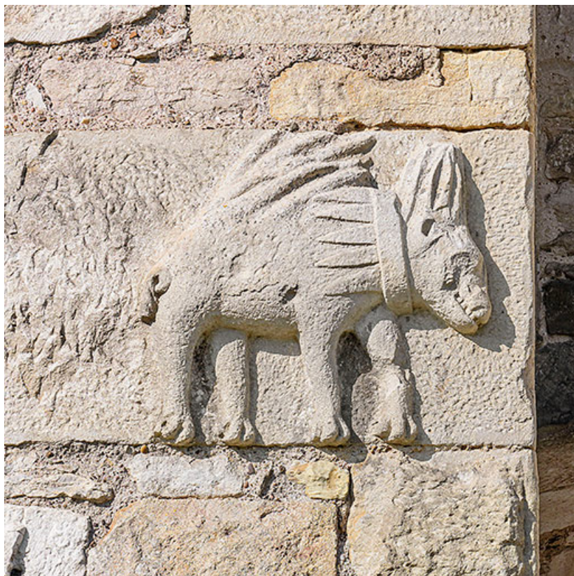
Détail d'un porc-épic.