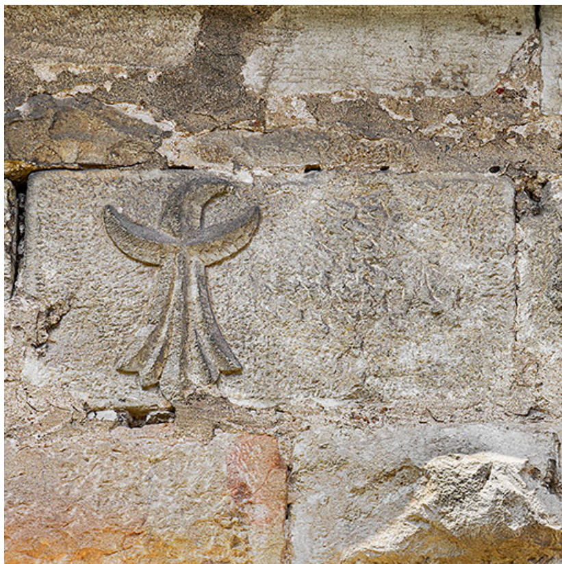
Détail d'une hermine.