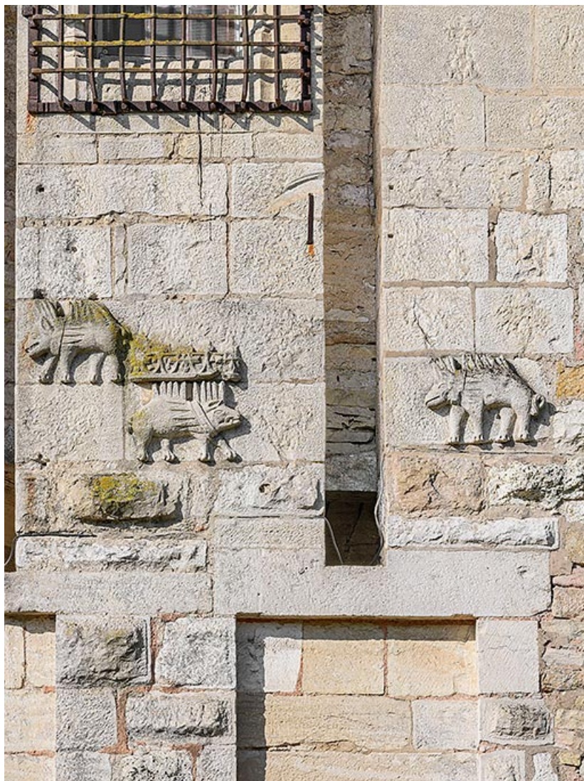
Porc-épic sur la façade côté campagne.