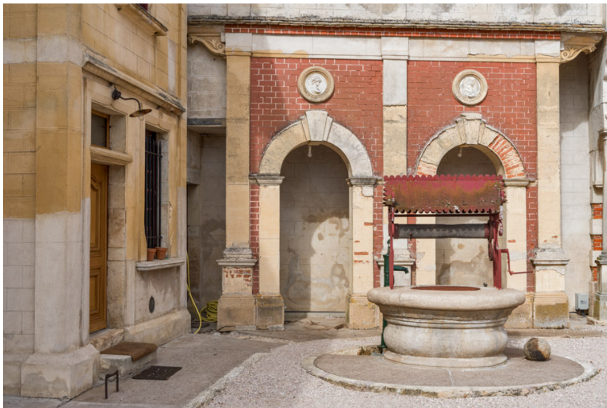
Angle nord-ouest de la cour, avec le puits.