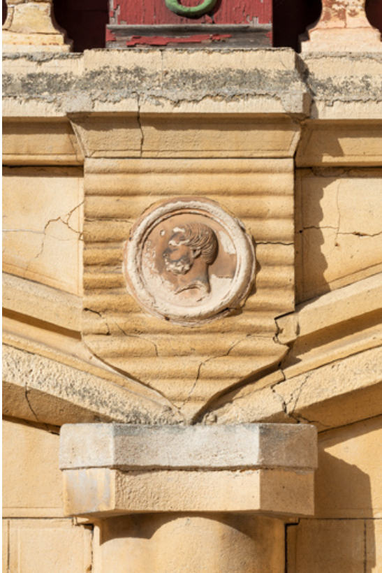
Bas-relief sur l'élévation antérieure de la maison.