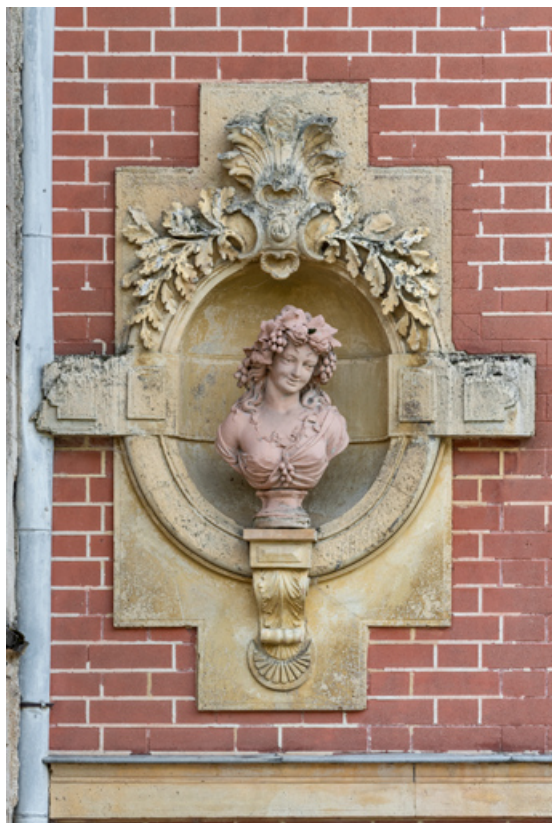
3e buste (à gauche sur l'élévation de la maison).