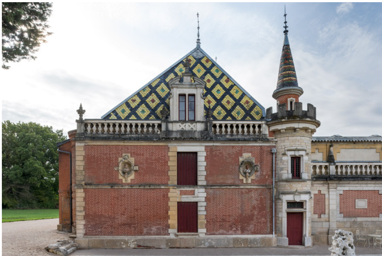
Elévation latérale gauche (corps nord).