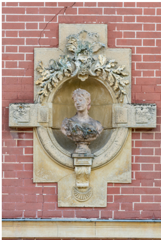
4e buste (à droite sur l'élévation de la maison).