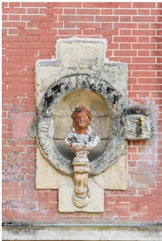
2e buste (à droite sur l'élévation des communs).