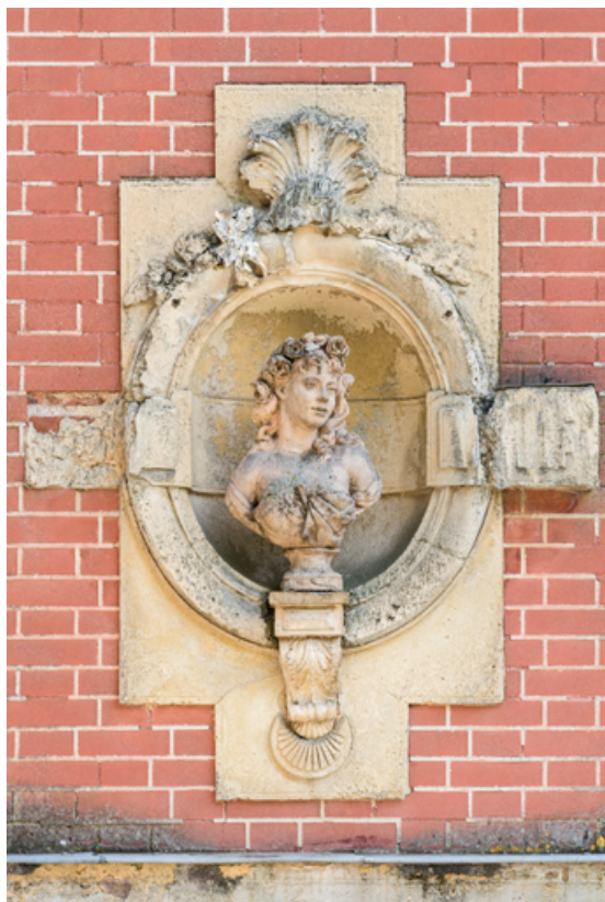
Galerie : 1er buste.