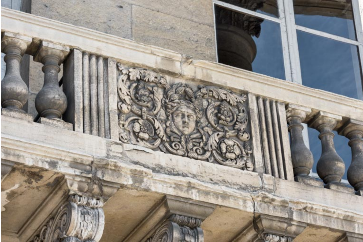
Bas-relief : l'Hiver.