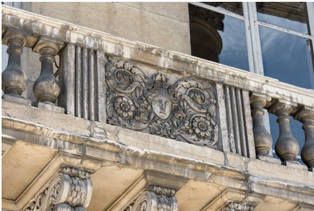
Bas-relief : le Printemps.