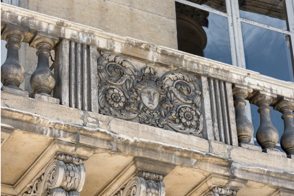
Bas-relief : le Printemps.