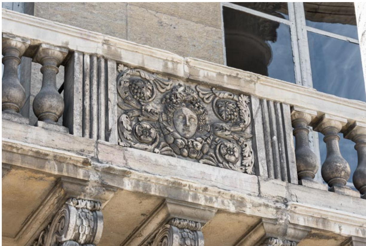
Bas-relief : l'Automne.