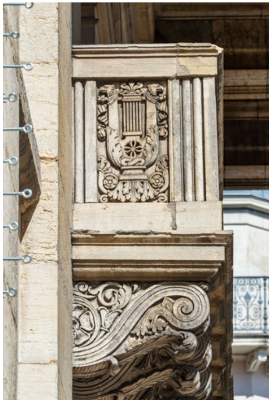
Bas-relief (lyre) et console.