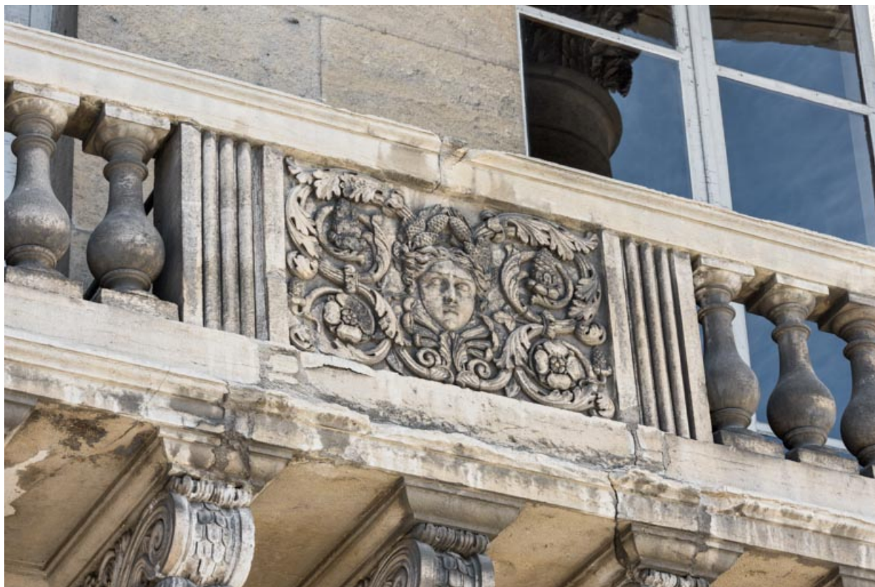
Bas-relief : l'Hiver.