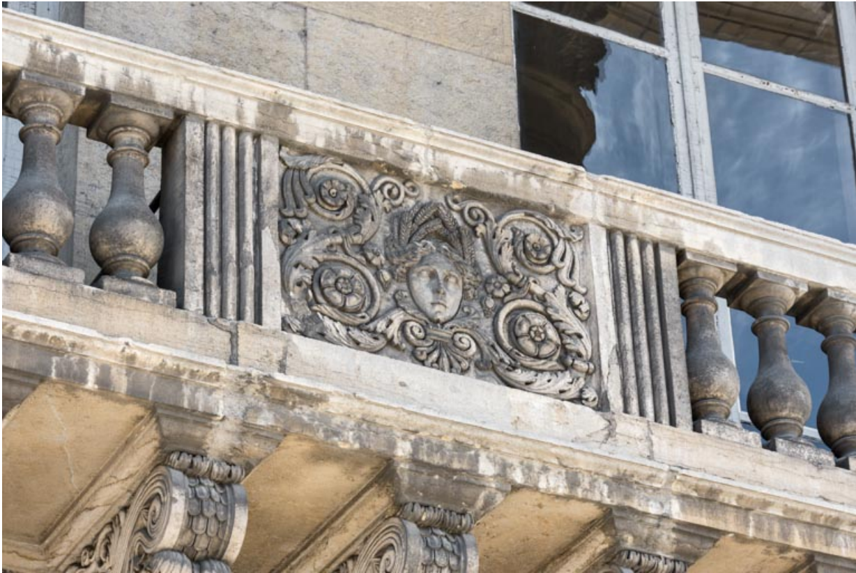
Bas-relief : l'Eté.