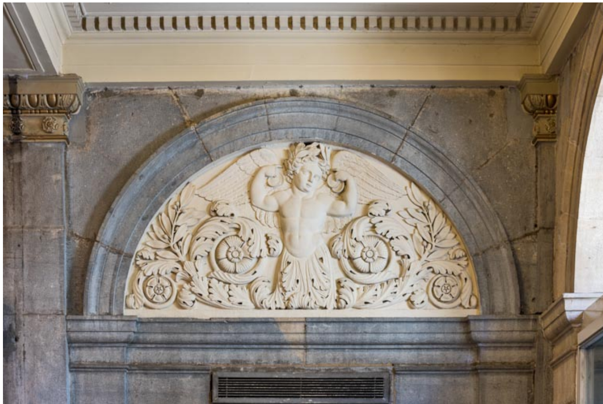
Bas-relief côté cour, à droite : phytomorphe tenant deux castagnettes.