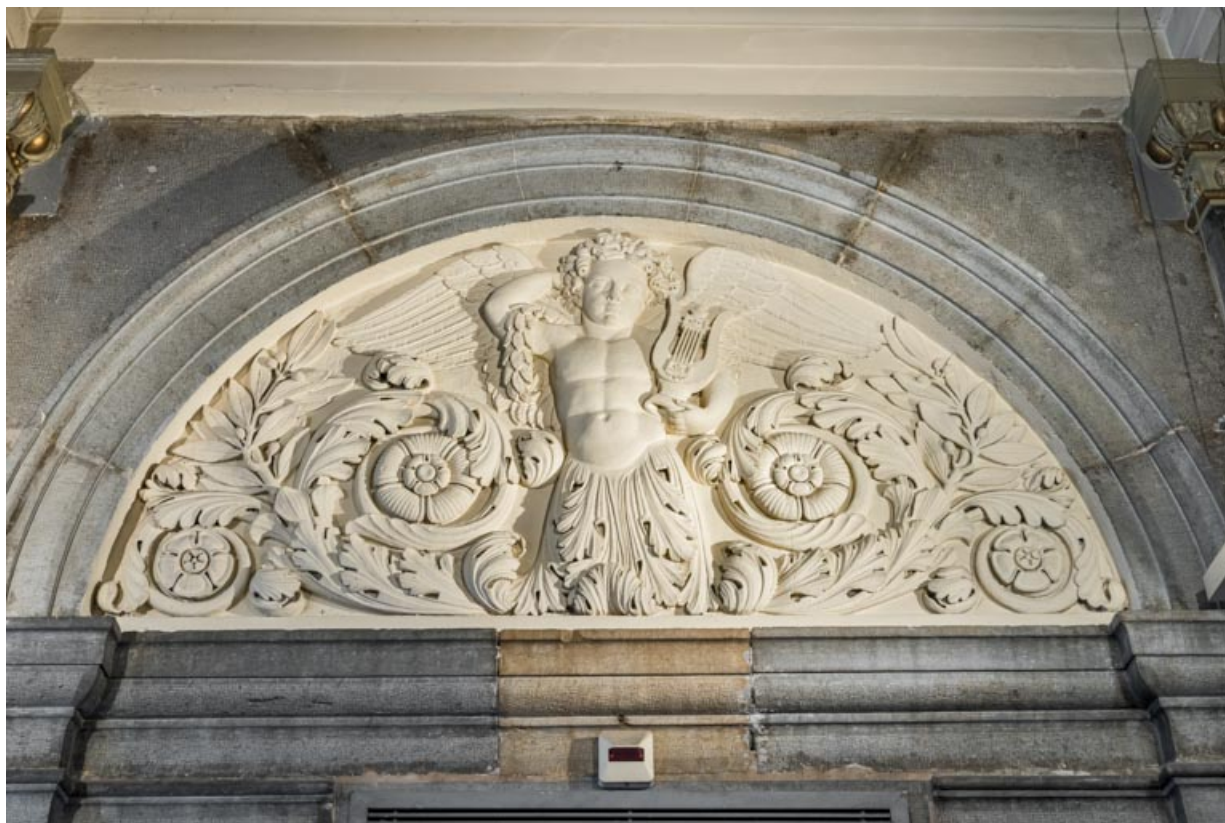
Bas-relief côté jardin, à droite : phytomorphe tenant une lyre dans la main gauche.