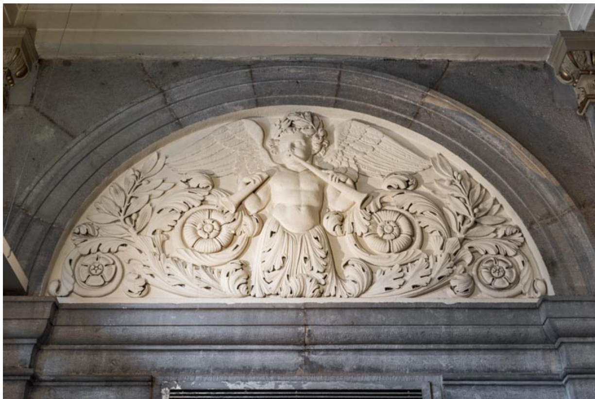
Bas-relief côté jardin, à gauche : phytomorphe tenant un instrument à vent et jouant d'un 2e semblable. 21, Dijon place du Théâtre