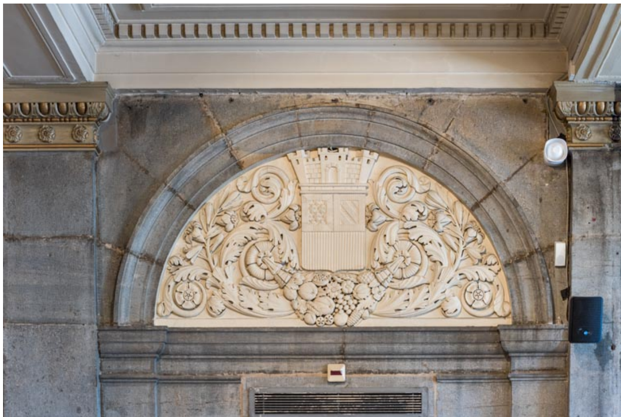
Bas-relief côté cour, au centre : blason de Dijon.