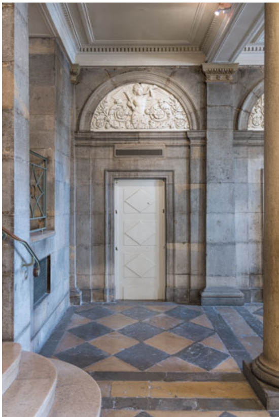
Mur latéral droite (côté cour) : porte de gauche. 21, Dijon place du Théâtre