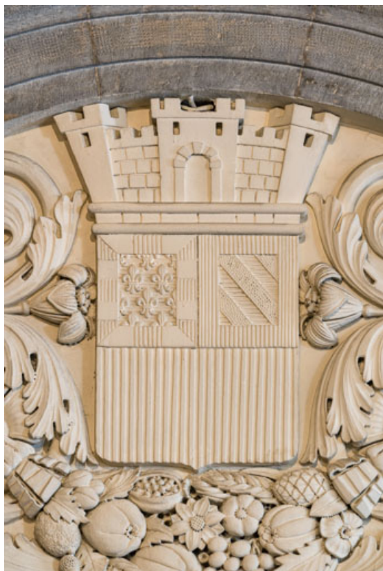
Bas-relief côté cour, au centre : détail du blason de Dijon. 21, Dijon place du Théâtre