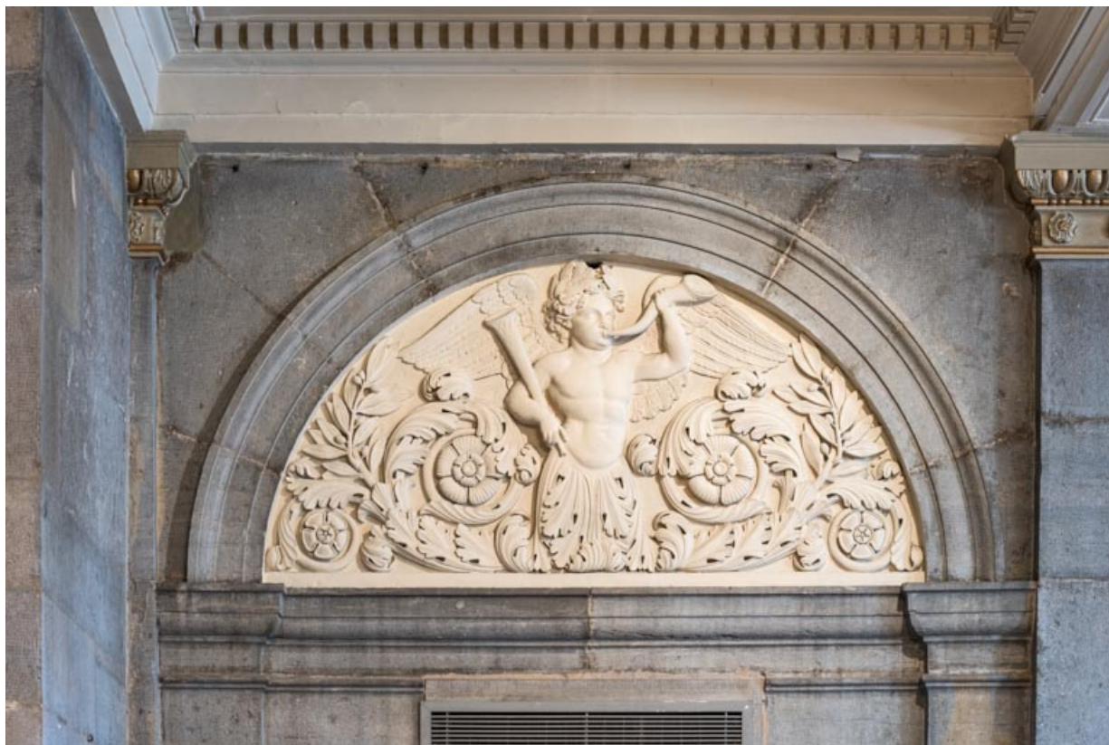
Bas-relief côté cour, à gauche : phytomorphe tenant un instrument à vent et jouant du cor. 21, Dijon place du Théâtre