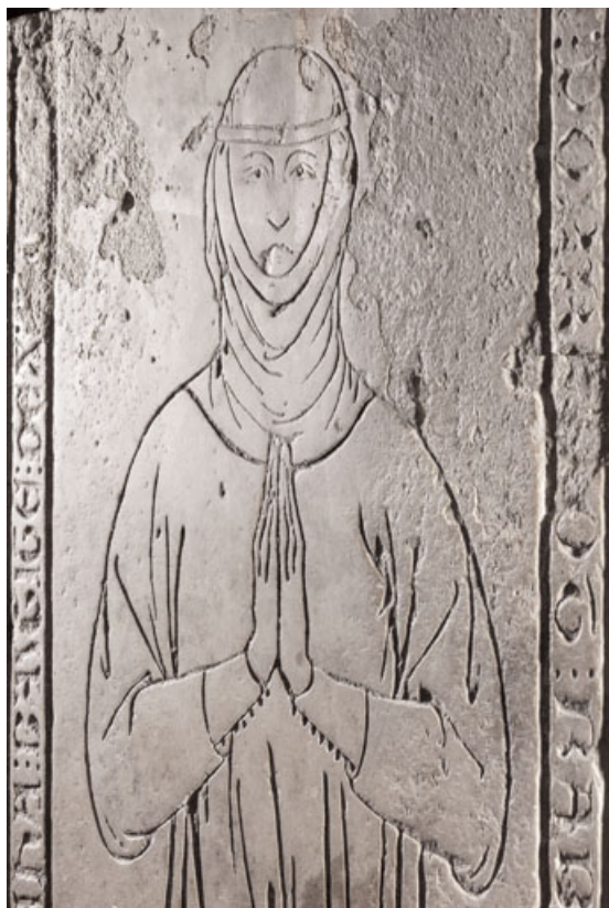
Personnage vu en lumière rasante (vue resserrée). 21, Dijon, 15 rue Danton