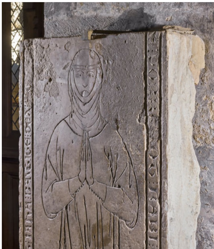
Personnage vu en lumière rasante