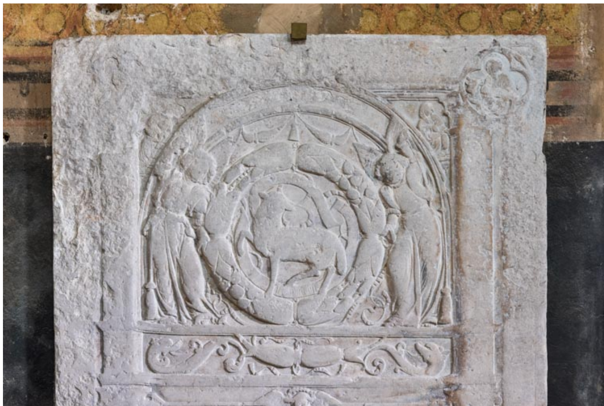
Agneau pascal, dans le registre supérieur.