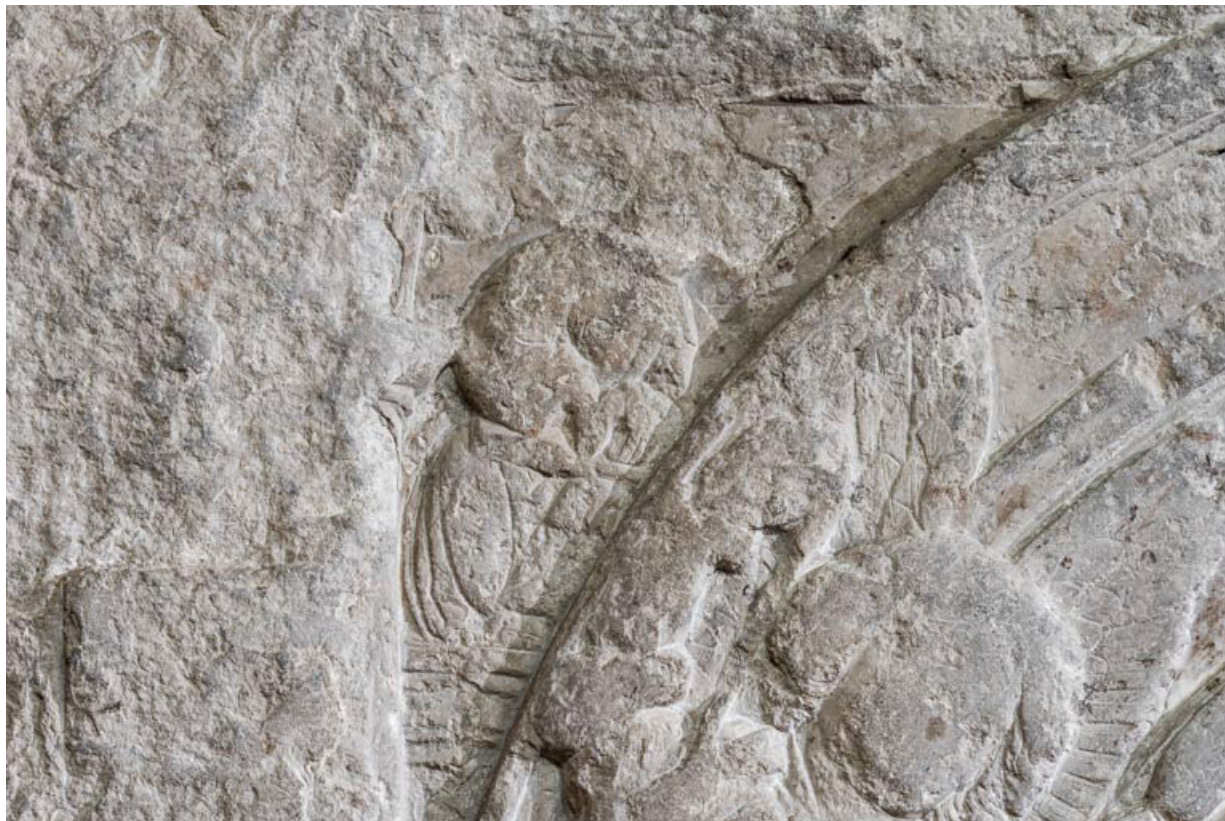
Personnage dans l'écoinçon en haut à gauche (tenant une croix ansée ?).