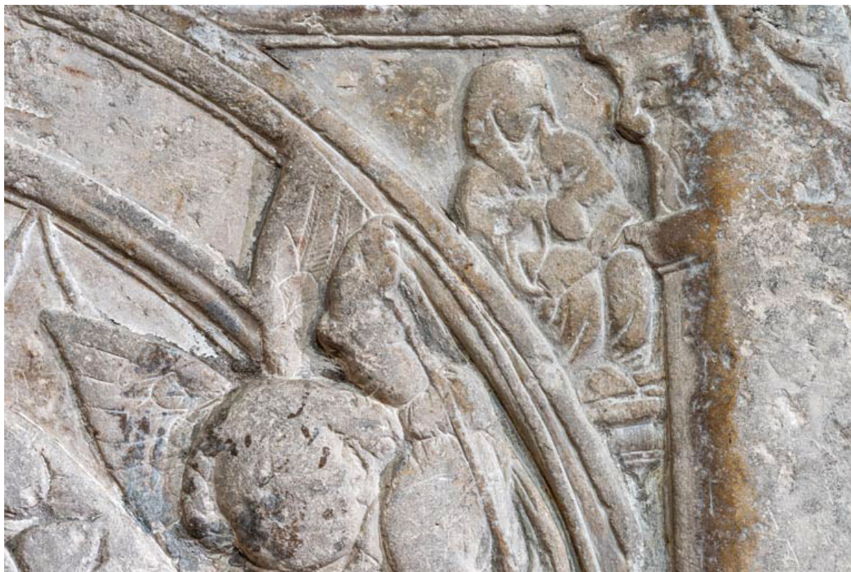
Personnage dans l'écoinçon en haut à droite.