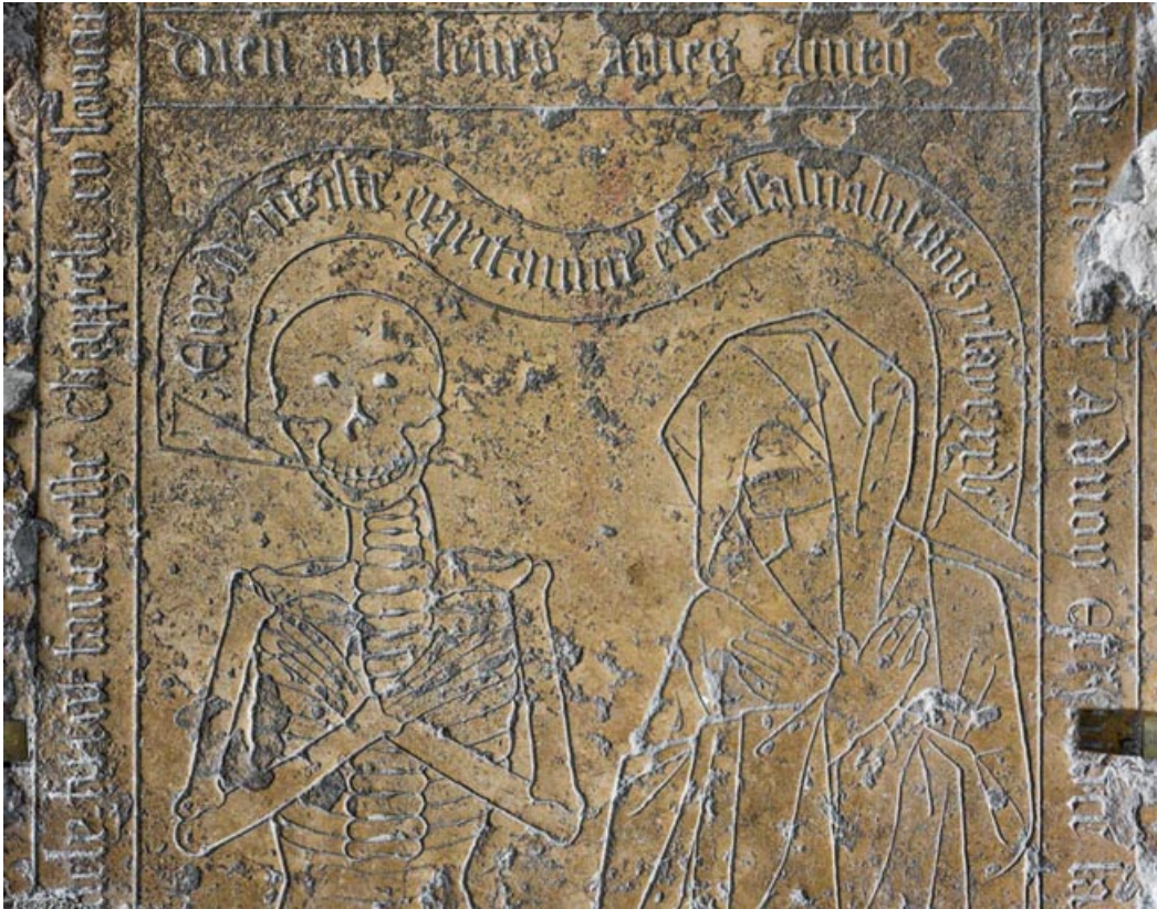
Les personnages en buste.