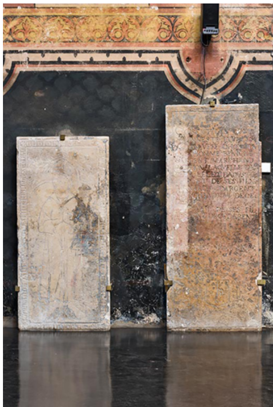
Deux des 12 dalles funéraires (relevées contre le mur nord). 21, Dijon, 15 rue Danton