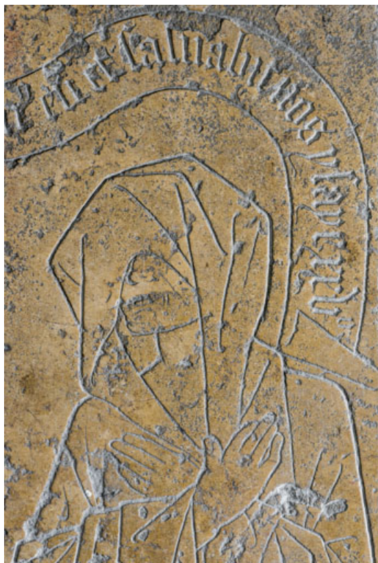
Jacote Douhet en buste.