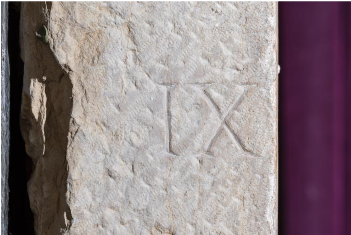
Numéro de repérage gravé sur la tranche gauche.