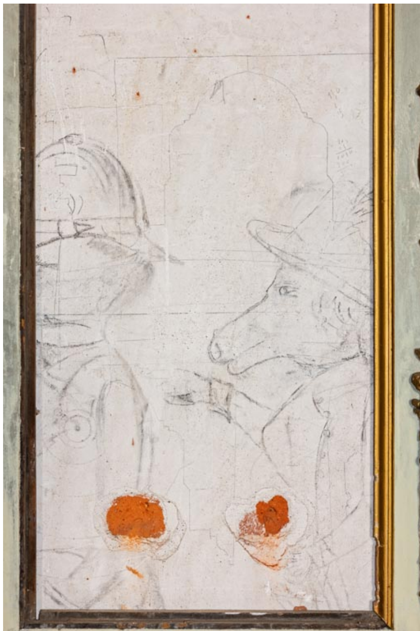
Foyer, travée entre les deux portes donnant sur la salle : dessin crayonné sur le mur. 21, Chevigny-en-Vallière, 23 rue Mercey