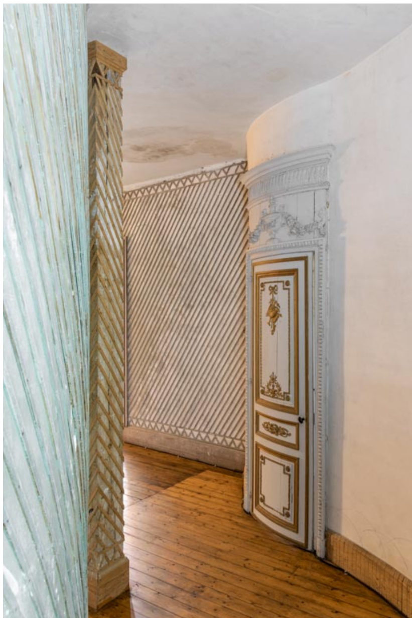
Couloir desservant la salle (à gauche).