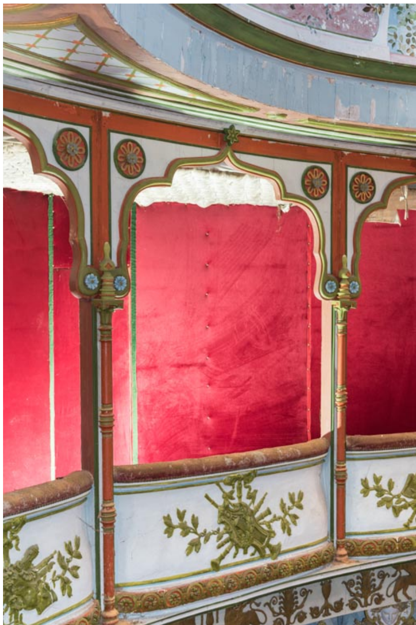
Salle, loge centrale : travée centrale, de trois quarts.