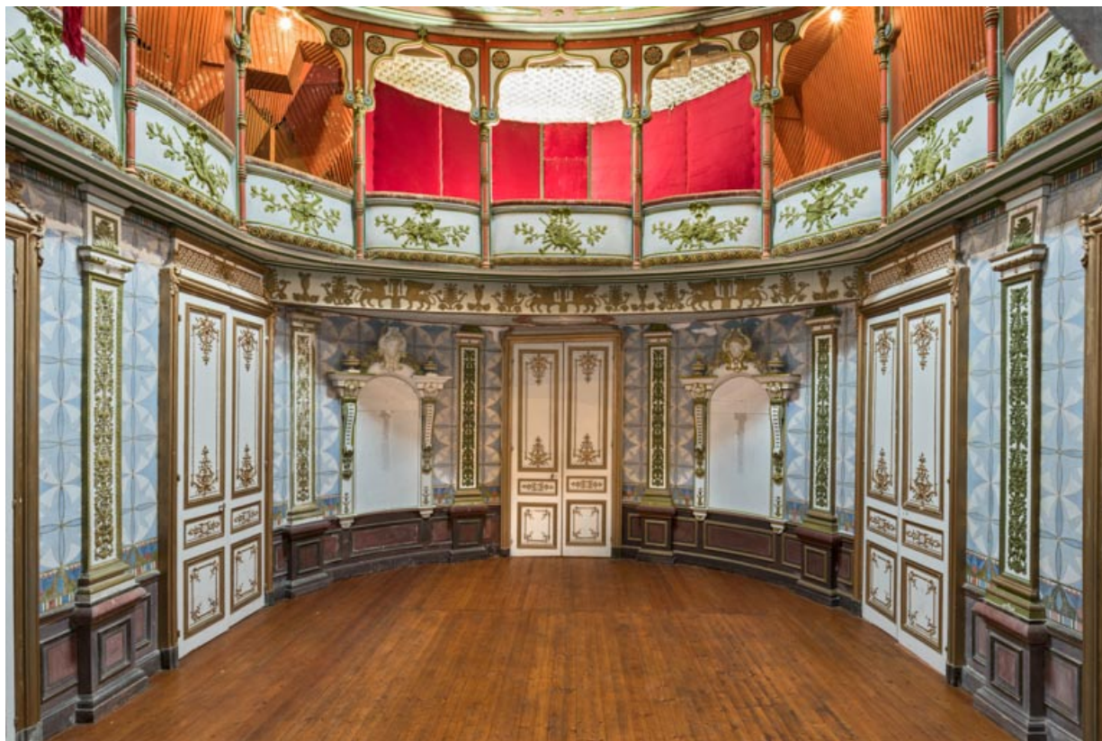
Salle : vue d'ensemble, depuis la scène.