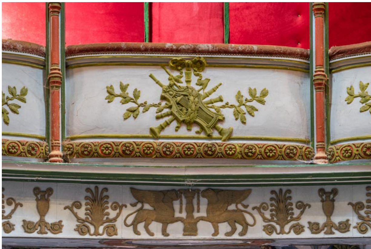
Salle, loge centrale : décor du garde-corps.