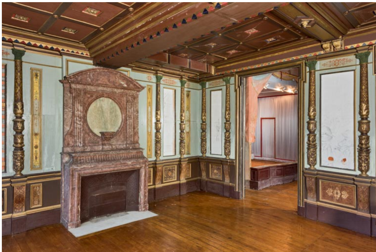
Foyer : vue d'ensemble, montrant la scène à droite.