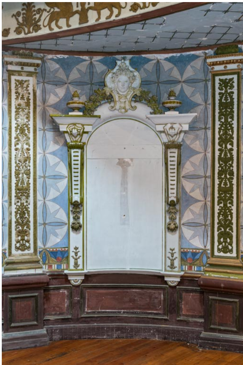
Salle : fausse niche.