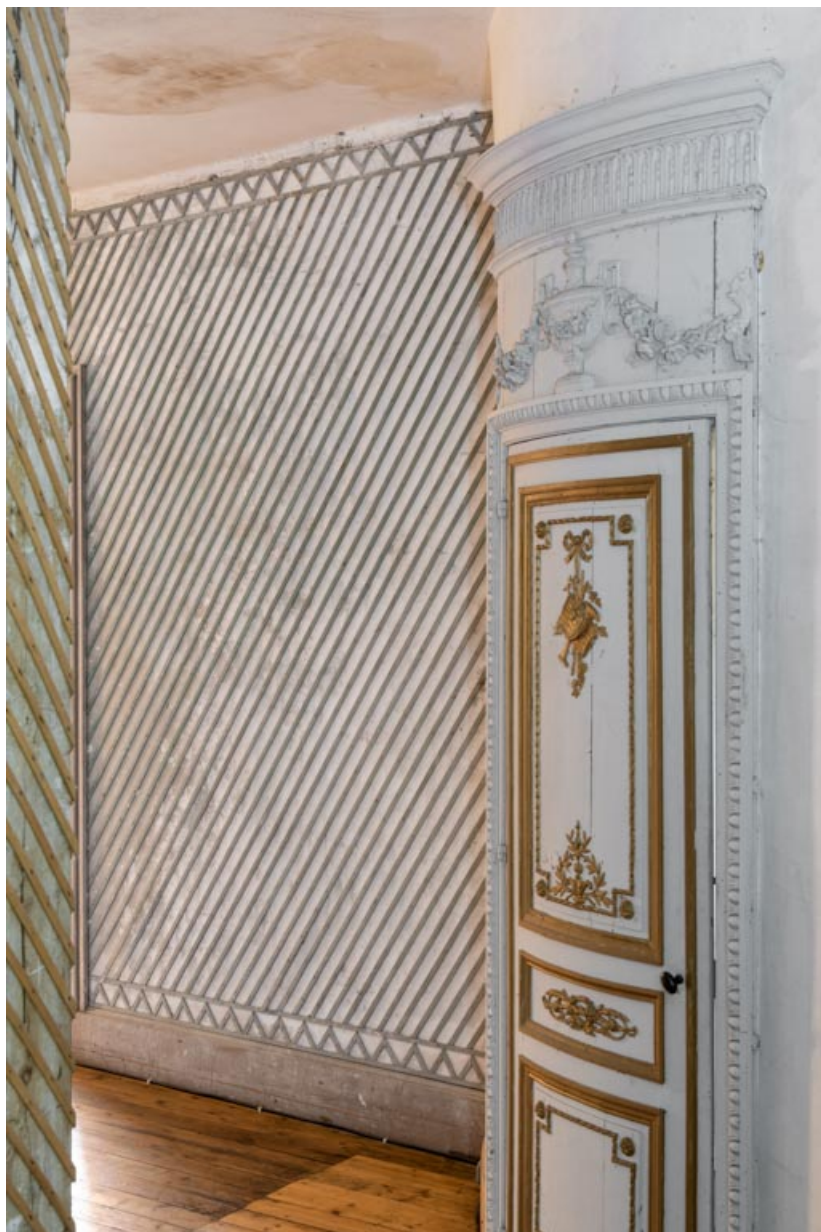
Couloir desservant la salle : décor de treillages en bois.