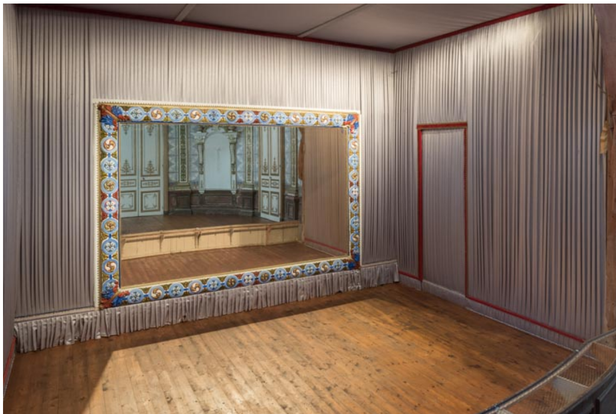
Salle : la scène, vue de trois quarts.