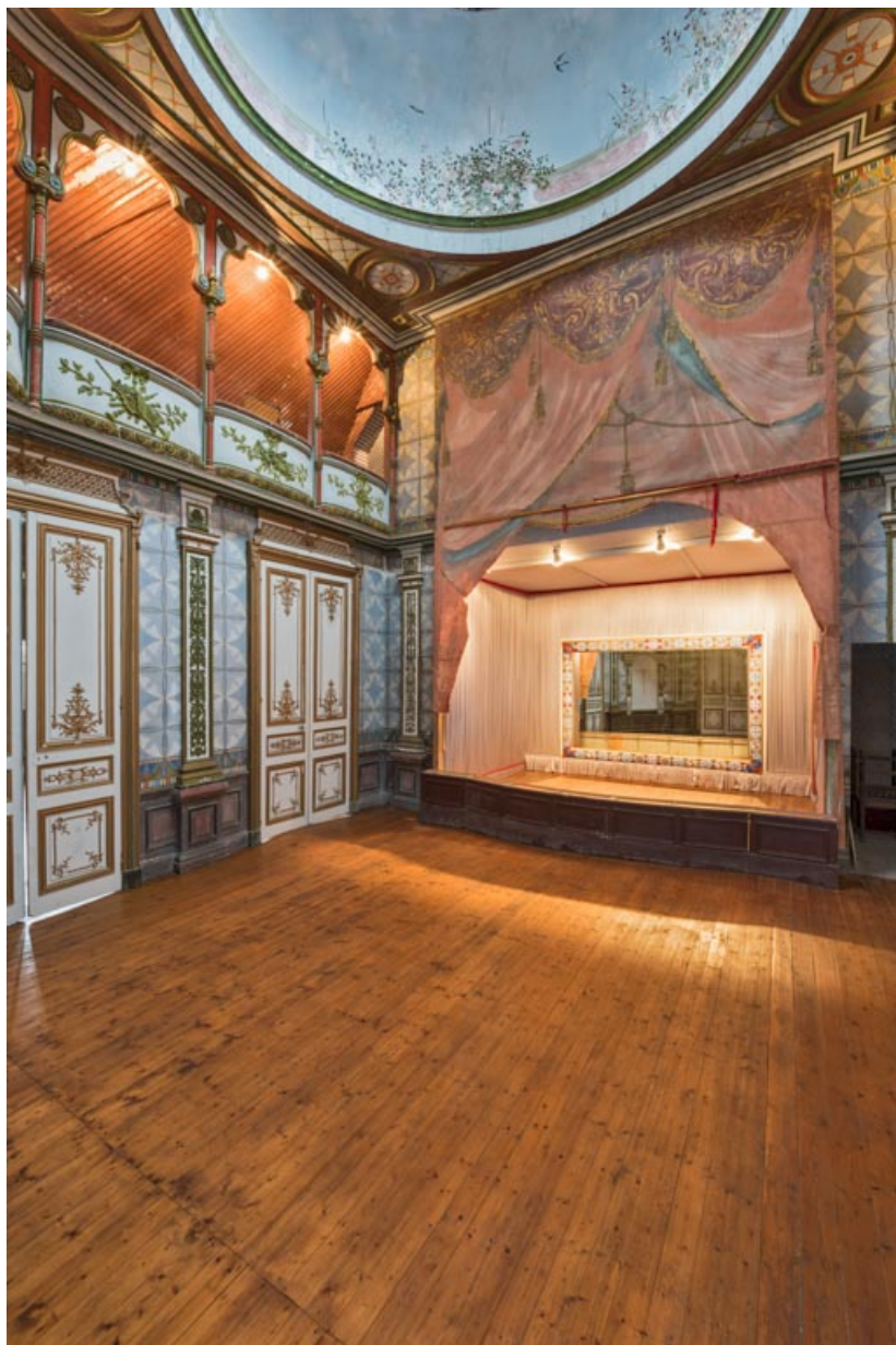
Salle : vue d'ensemble de trois quarts, vers la scène.