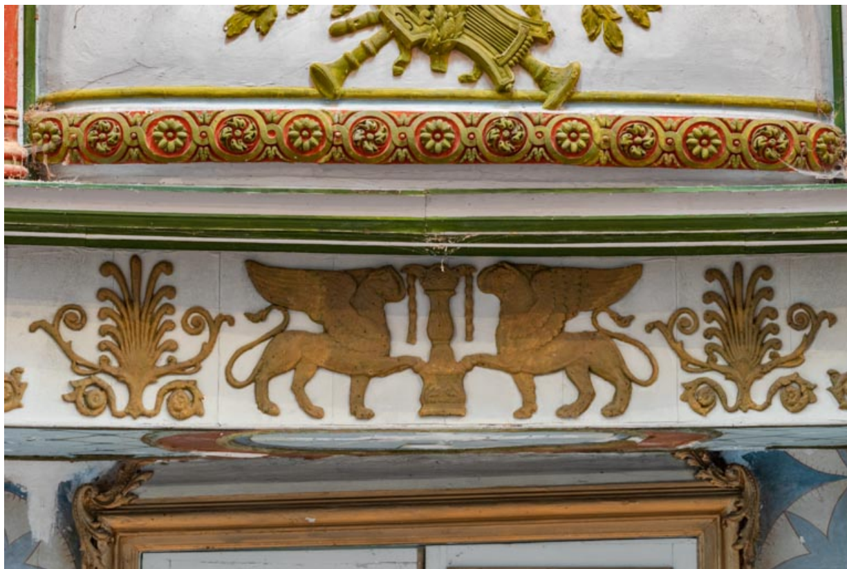
Salle, loge centrale : décor de la frise sous le garde-corps.