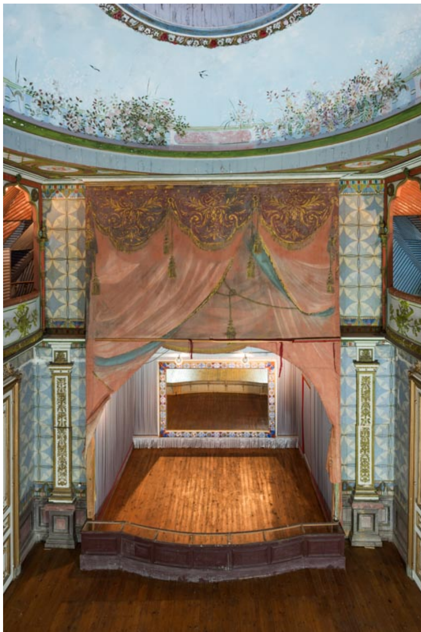
Salle : vue d'ensemble plongeante, vers la scène.