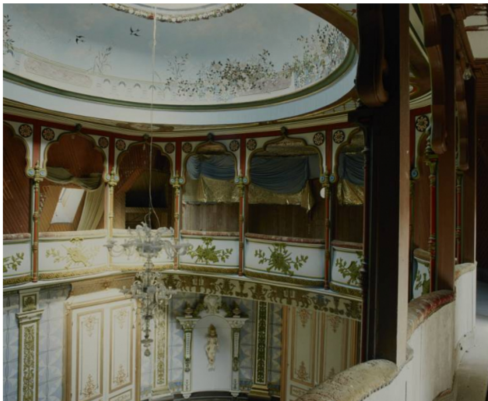
Le balcon, en 1996.