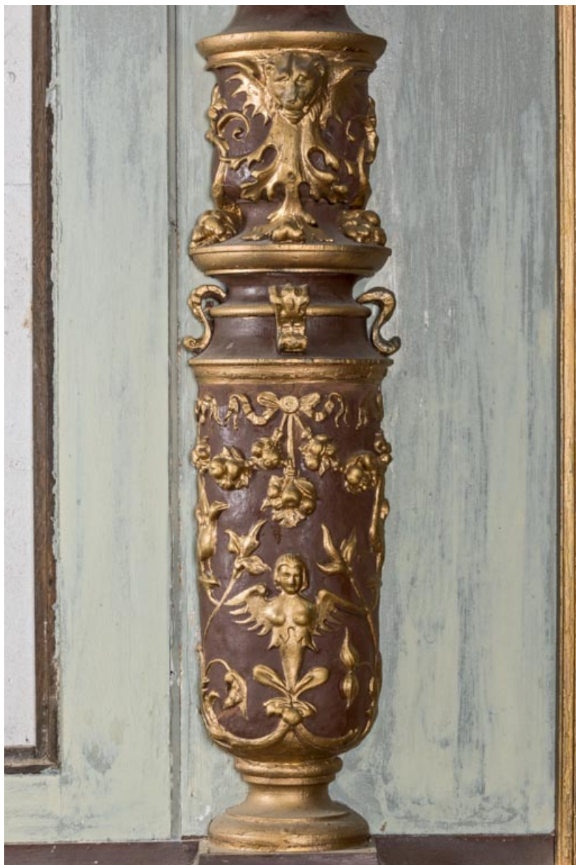
Foyer : décor d'une colonne.