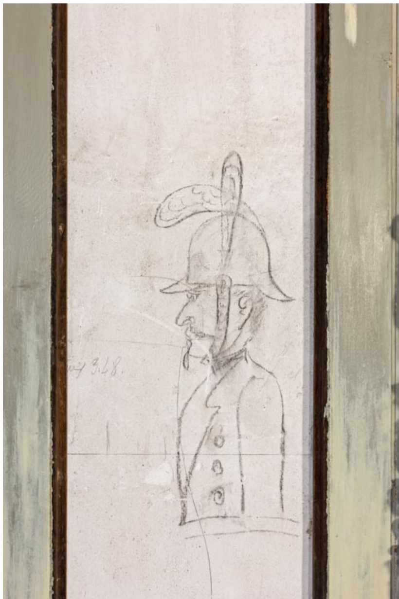
Foyer, vers la porte dérobée : dessin crayonné sur le mur