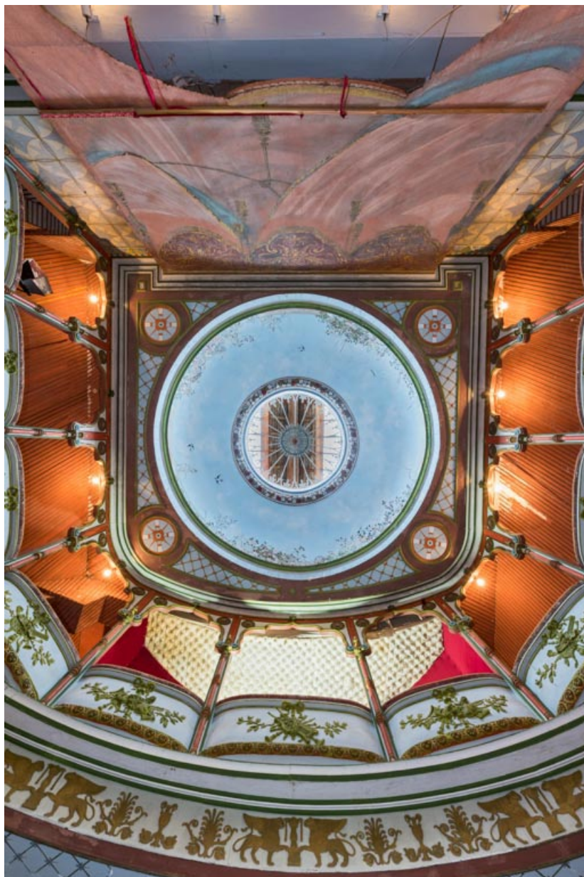
Salle : vue d'ensemble du balcon et du plafond.