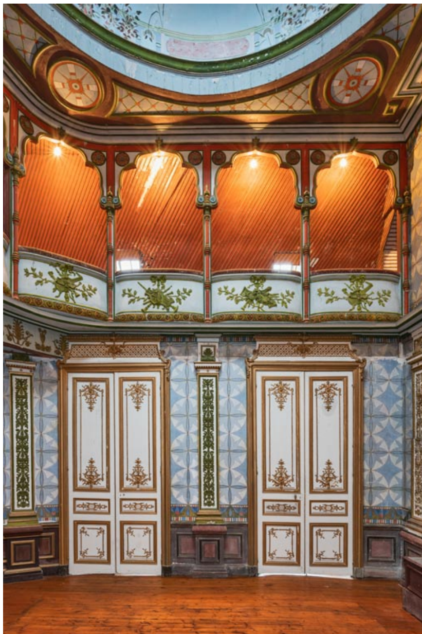
Salle : élévation latérale, avec le balcon.