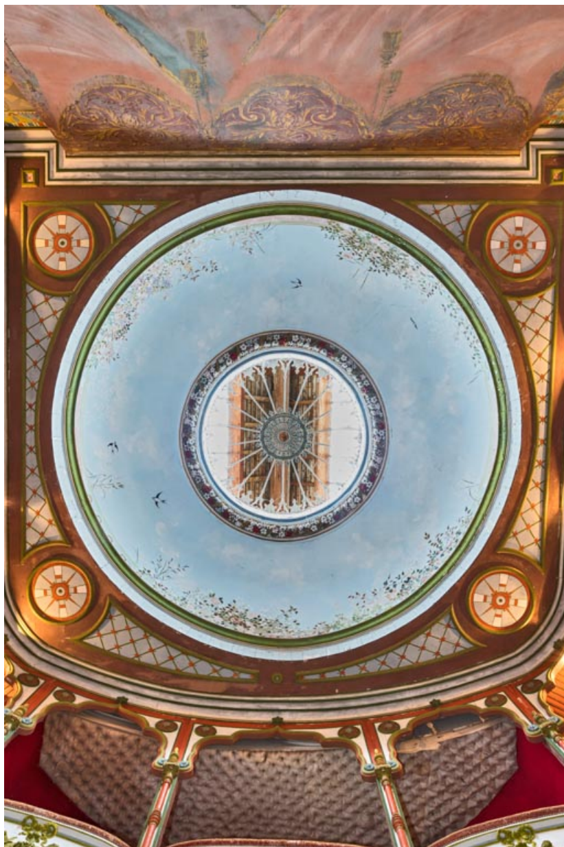
Salle : vue d'ensemble du plafond (fausse coupole).