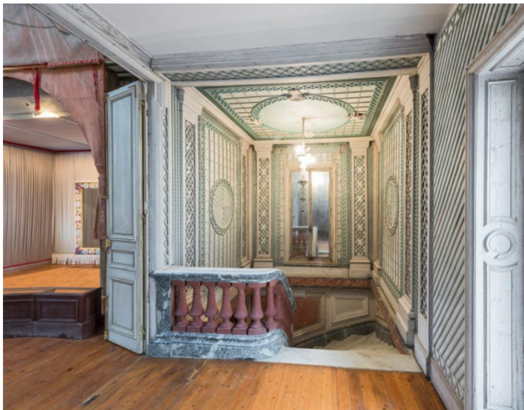
Escalier desservant la salle (la scène est partiellement visible à gauche).