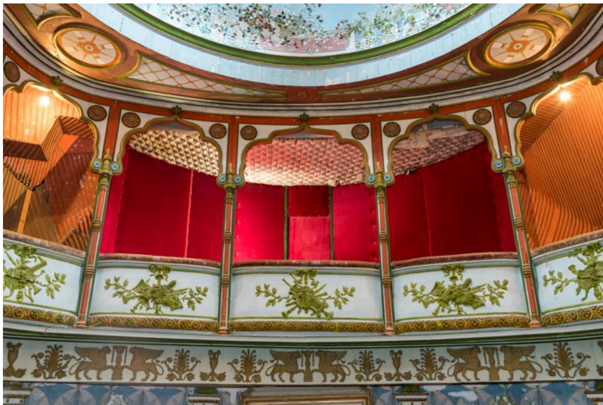
Salle : loge centrale au balcon.