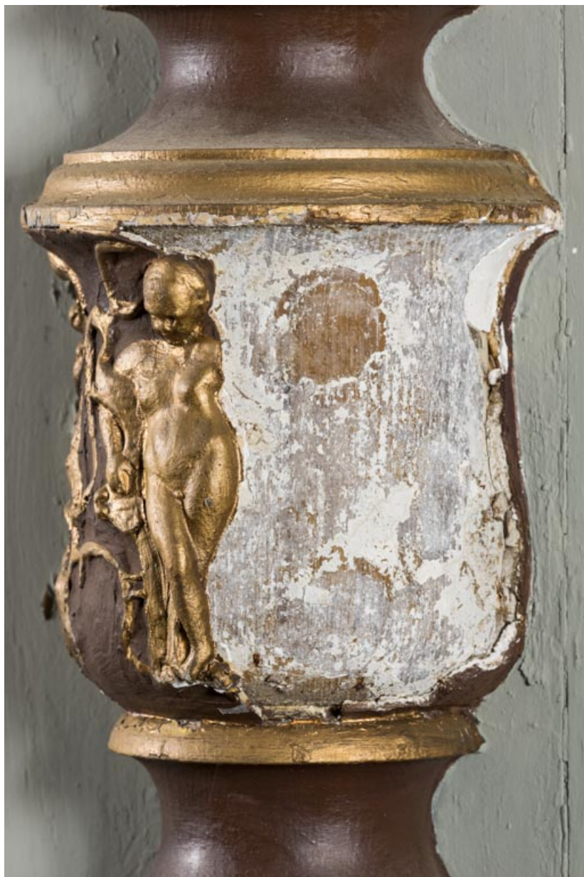
Foyer : décor lacunaire d'une colonne.