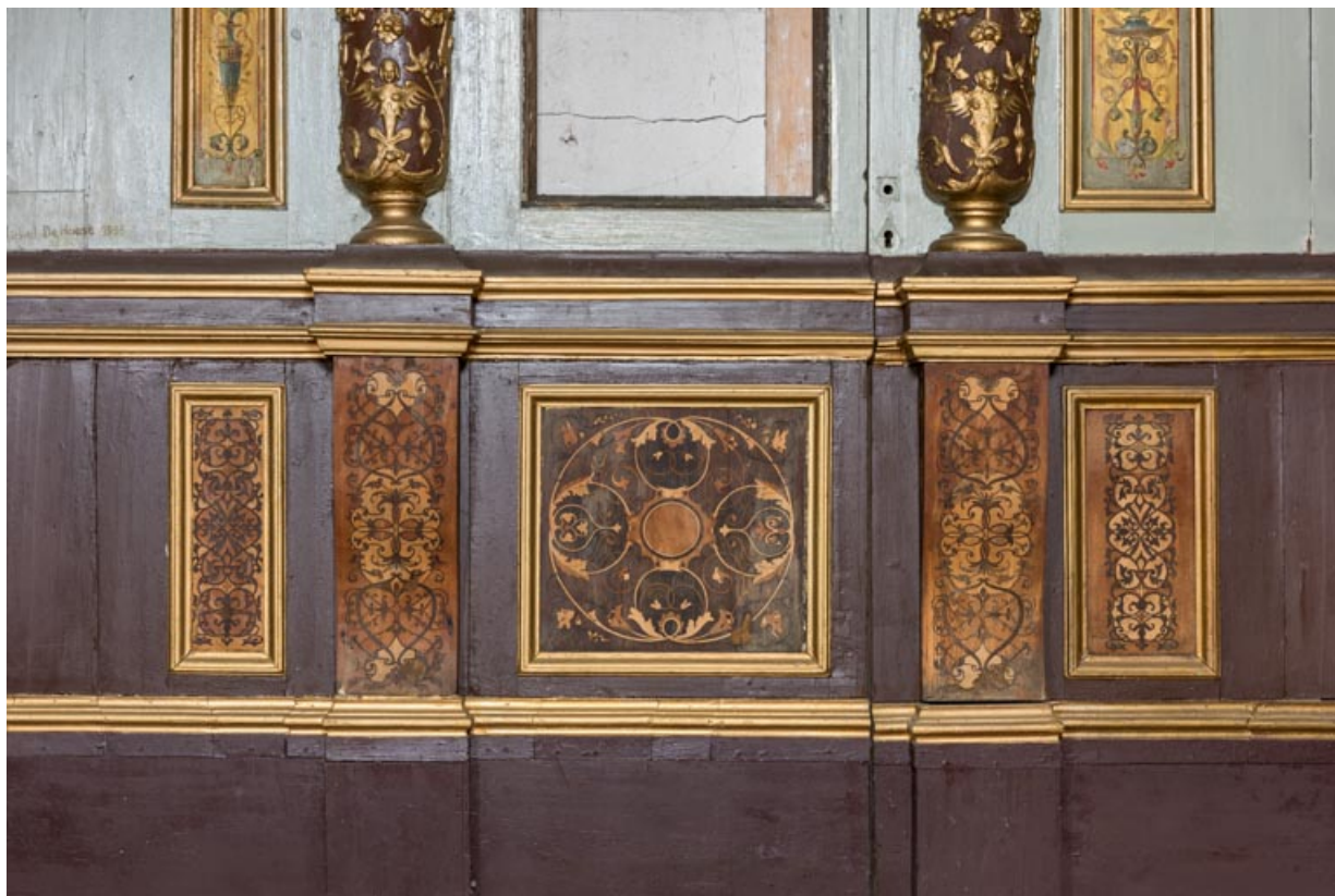
Foyer : lambris à soubassement marqueté.