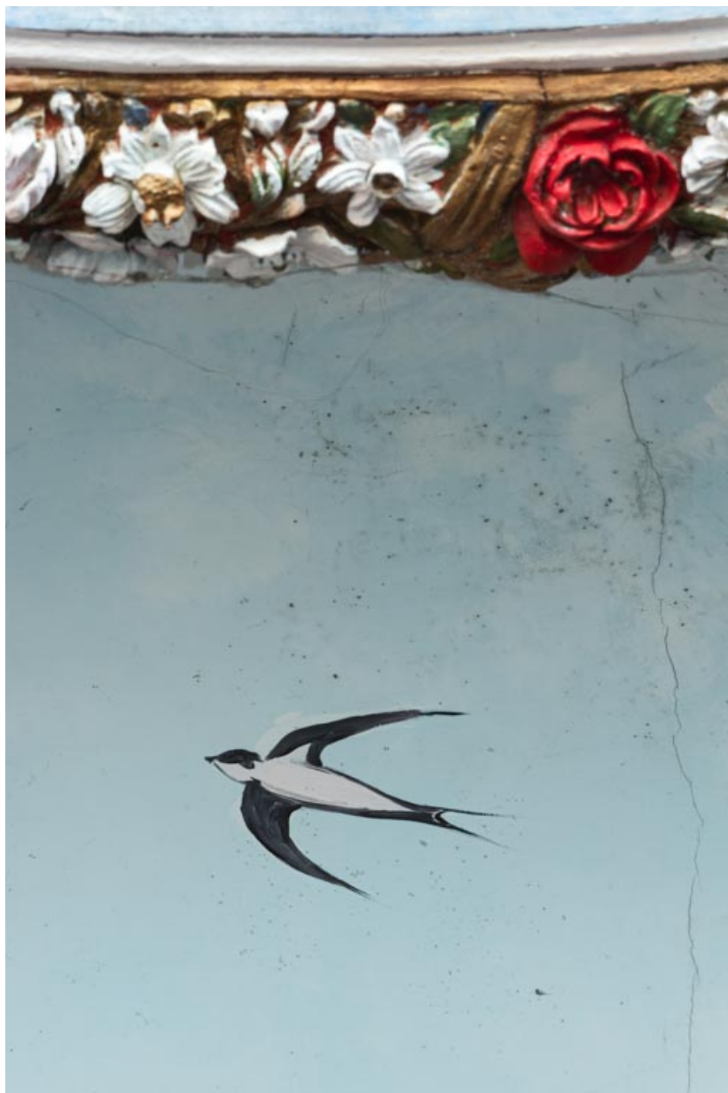
Salle, décor peint de la fausse coupole : hirondelle.