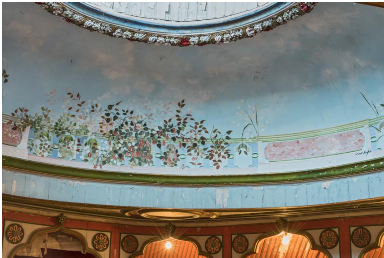
Salle : décor peint de la fausse coupole.