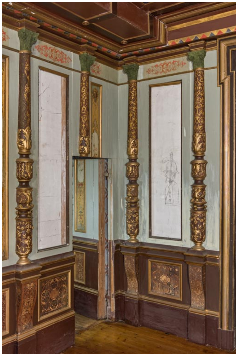
Foyer : porte dérobée donnant accès à l'escalier du balcon.