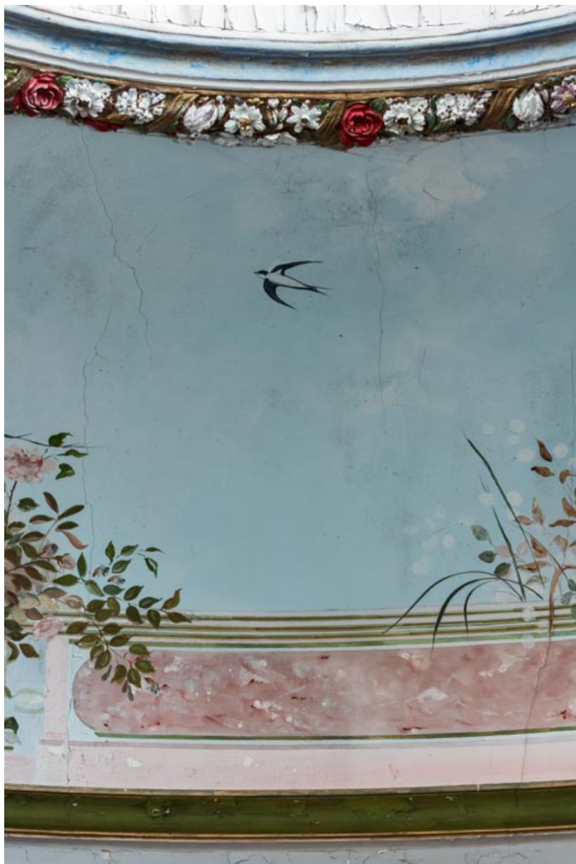
Salle, décor peint de la fausse coupole : garde-corps et hirondelle.