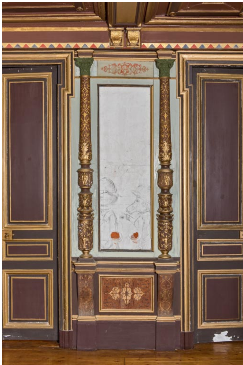
Foyer : travée entre les deux portes donnant sur la salle.