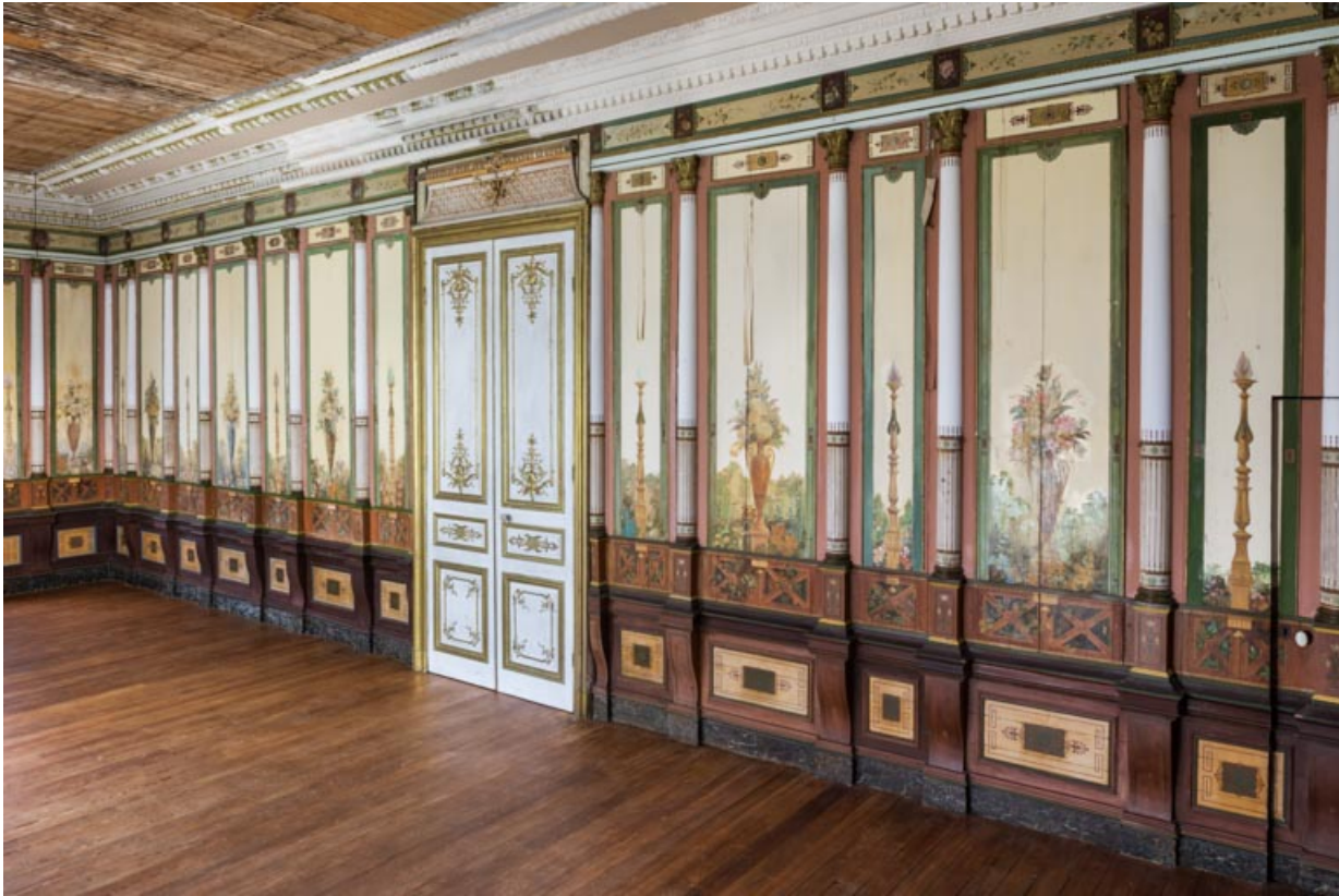
Lambris de hauteur sur le mur nord.