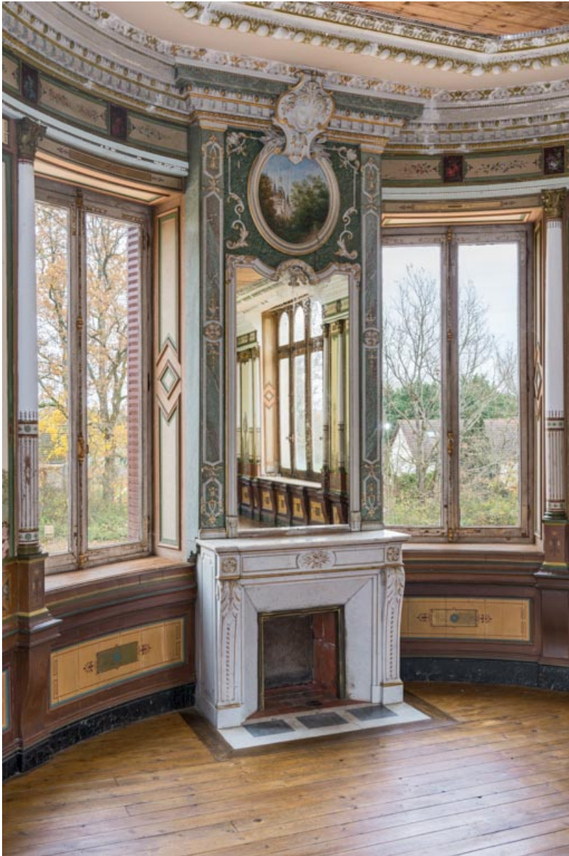
Cheminée à l'est.