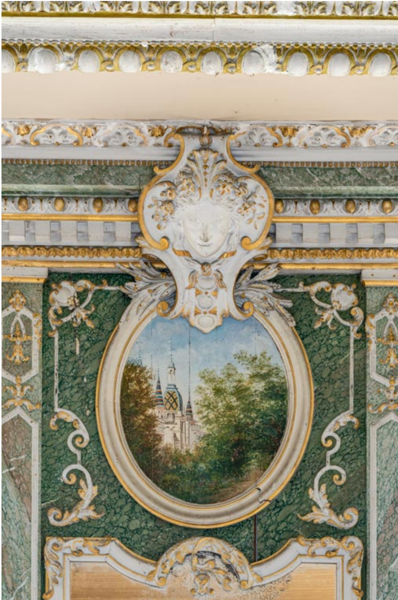
Panneau ovale surmontant le trumeau oriental : dôme du château.