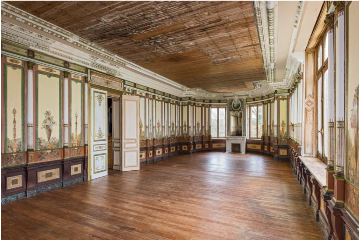
Corps sud : salle des fêtes au 1er étage (vue vers l'est).