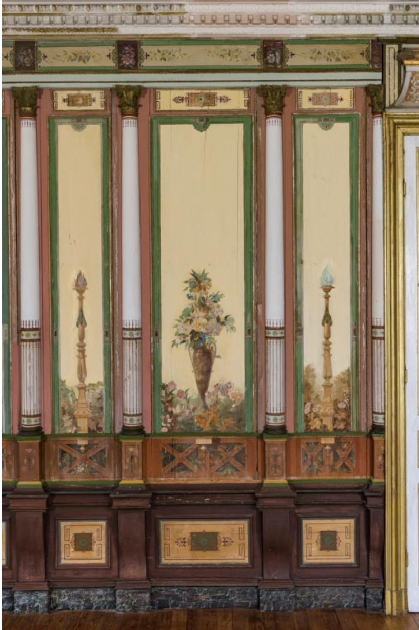
Communs (salle des fêtes dans le "Donjon") : décor peint.