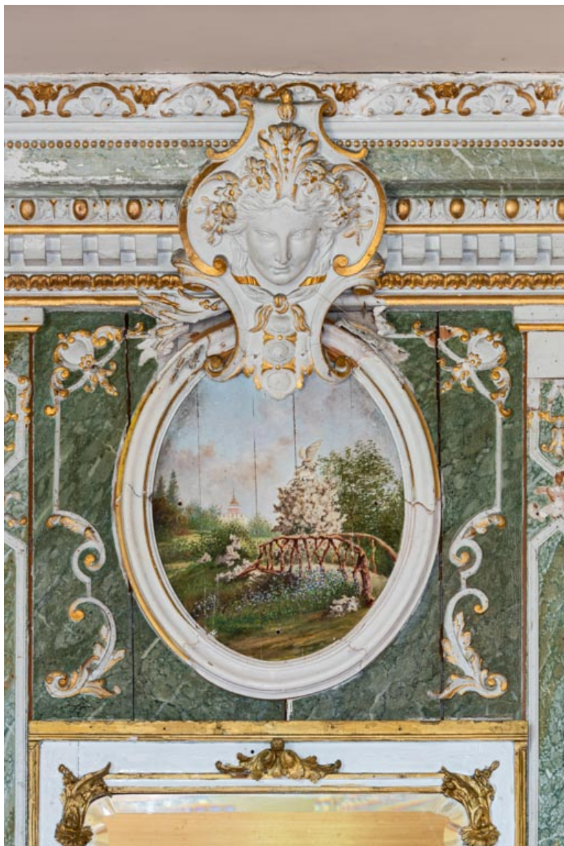
Panneau ovale surmontant le trumeau occidental : pont et décor de rocailles portant la statue du phénix. 21, Chevigny-en-Vallière, 23 rue Mercey